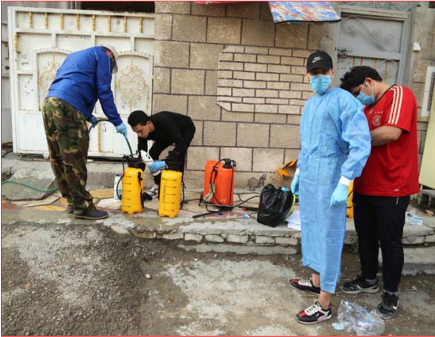
حملات تعفير في المناطق الشعبية...