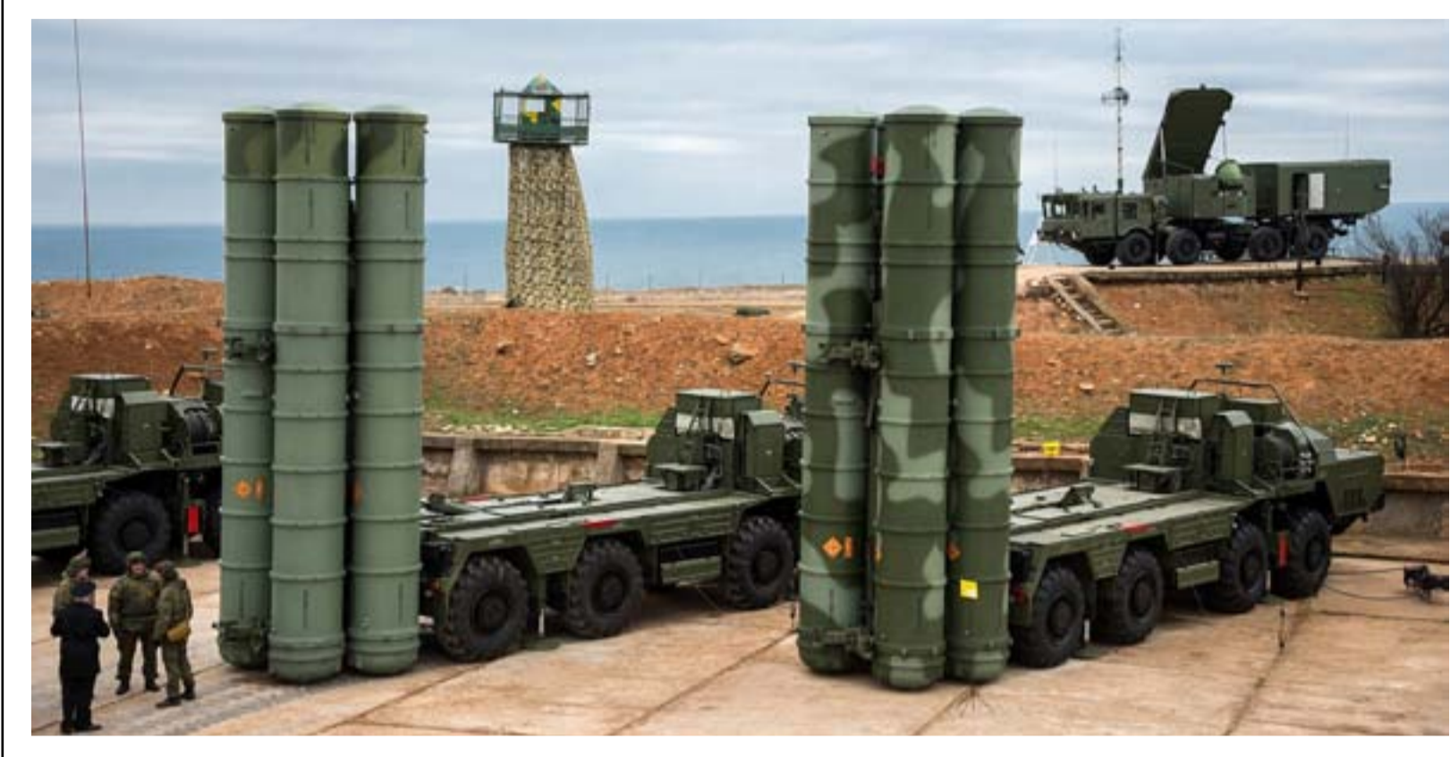
منظومة الدفاع الروسية

وبيّن أنه أوضح للجانب العراقي أن "تركيا استمدت شرعية عملياتها ضد أهداف (بي كا كا) شمالي العراق من القانون الدولي ومبدأ الدفاع عن النفس المشروع الوارد بميثاق الأمم المتحدة". وذكر السفير التركي أن "معسكر مخمور فقد من زمن بعيد صفته كمعسكر إنساني، مبيناً أن معسكر مخمور تحول إلى وكر للإرهاب، ونقلت للجانب العراقي ضرورة إيجاد حل للمشكلة المتعلقة بالمعسكر في أقرب وقت". وأكد أن تركيا تحترم وحدة التراب العراقي وسيادته، وإنها تنتظر من بغداد القيام بما يترتب عليها في مكافحة الإرهاب.