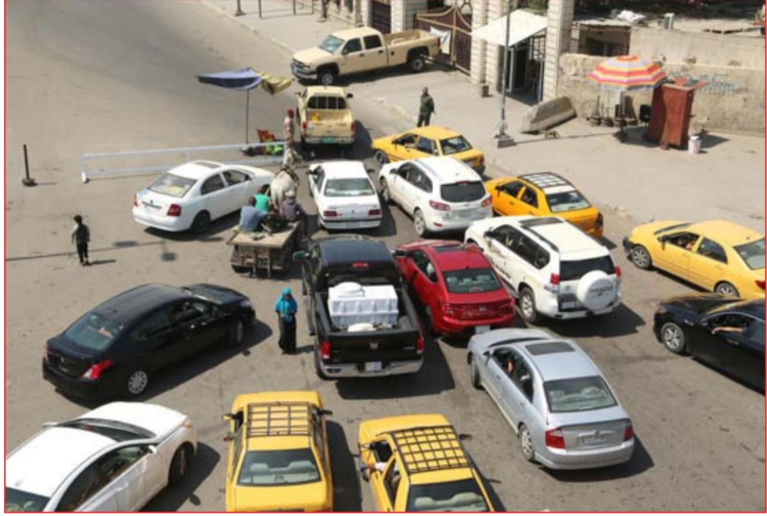
إختناقات مرورية عند السيطرات تسبق إجراءات رفع الحظر..