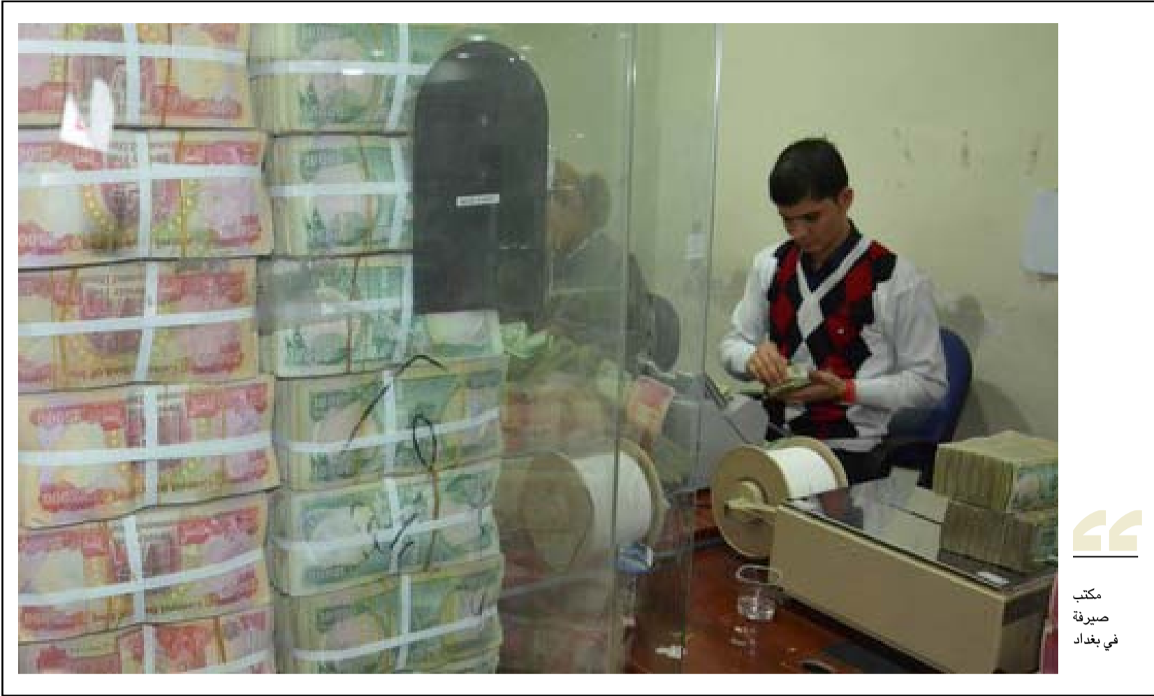
مكتب صيرفة في بغداد

وأضاف الفهد في بيان إلى أن "من الخيارات المطروحة بشكل غير رسمي، تغيير الرواتب بنسبة 20 بالمئة لجميع الموظفين أو اللجوء إلى الإبخار الإيجاري أو تخفيض المخصصات غير الثابتة ضمن الرواتب؛ وهذه كلها خيارات مدروسة ستعمل الحكومة على اختيار أفضلها". ولفت إلى أن "هذا الأمر متروك للحكومة الجديدة حيث ستقدم مسودة قانون الموازنة وفيها مقترحات وحلول لتغيير واقع