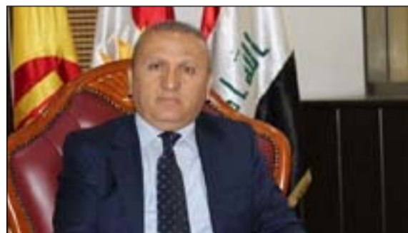
بغداد / المدى

رجح عرفات كرم، مسؤول ملف العراق في مقر زعيم الحزب الديمقراطي الكردستاني مسعود بارزاني، أمس، وجود رغبة شيعية بإجبار رئيس الحكومة المكلف مصطفى الكاظمي على الاعتذار لبيقي رئيس الحكومة المستقيل عادل عبد المهدي في منصبه وقال في تغريدة على (تويت): "أظن أن الكتل السياسية الشيعية ستدفع الكاظمي إلى الاعتذار، وذلك لكي يبقى عادل عبد المهدي في منصبه، وهو آخر قرار قبل الانهيار". ويتعين على الكاظمي عرض تشكيلته الوزارية على البرلمان بحلول الثامن من شهر أيار المقبل، من أجل نيل الثقة. في سياق متصل قال المحلل السياسي احسان الشمري إن "هذا الرفض الشيعي لكابينة الكاظمي، يأتي في إطار الضغوط لأجل مصالح القوى السياسية"، مؤكداً وجود رغبة بعدم تسمية مستقيلين أو وزراء بعديين عن الأحزاب التي تريد فرض رؤيتها". وأضاف أن "هذه الأطراف متصل إلى مساحة مشتركة بين رغبة القوى السياسية وطموحات مصطفى الكاظمي"، مشيراً إلى أن "الانقسام بين القوى الشيعية بات في أعلى مستوياته، في ظل انبعاث توجه الكاظمي إلى تفاهات مع القوى الكردية والسنية". وبشأن الترشيحات بمحاولة بعض الأطراف، الإبقاء على عادل عبد المهدي، أوضح الشمري أن "هناك جهة شيعية قد تحاول الإبقاء عليه، لكن وجود عبد المهدي لم يعد مقبولاً، وقد يفجر الأوضاع في البلاد، لاسيما وأنه تحول إلى إيران، على حساب الوسطية في العلاقات الخارجية للعراق". يشار إلى أن الكاظمي الذي كلفه رئيس الجمهورية، برهم صالح، بتشكيل الحكومة في 9 نيسان الجاري، يعد ثالث مكلف بتشكيل الحكومة، عقب عدنان الزرفي، ومحمد توفيق علاوي، المنسحب مطلع آذار الماضي؛ لفتله في إقناع المكونات السني والكردية وبعض القوى الشيعية بدعم تشكيلته الحكومية.