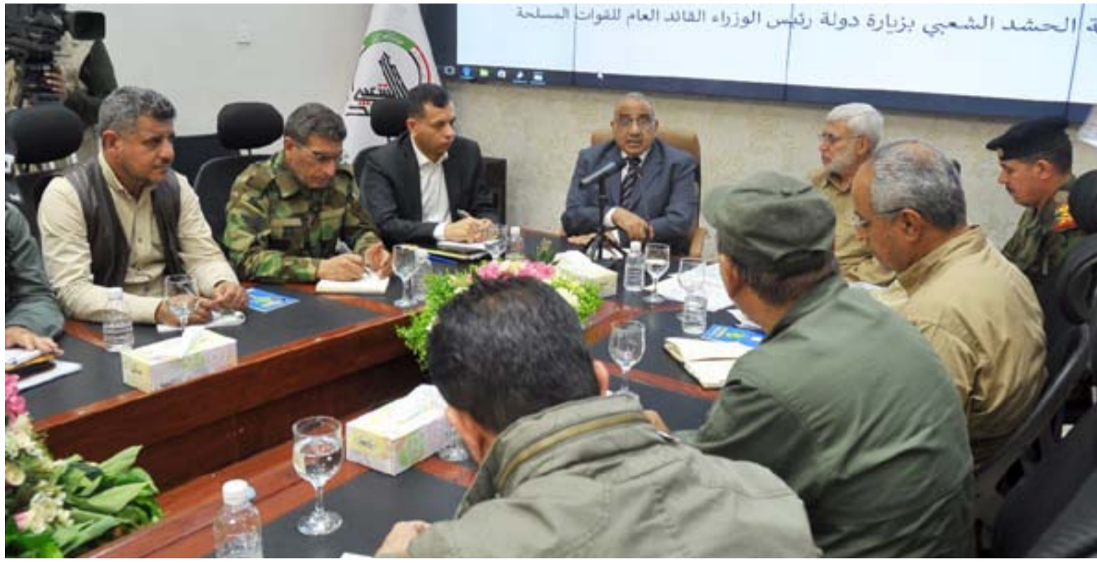
اجتماع عبد المهدي في هيئة الحشد