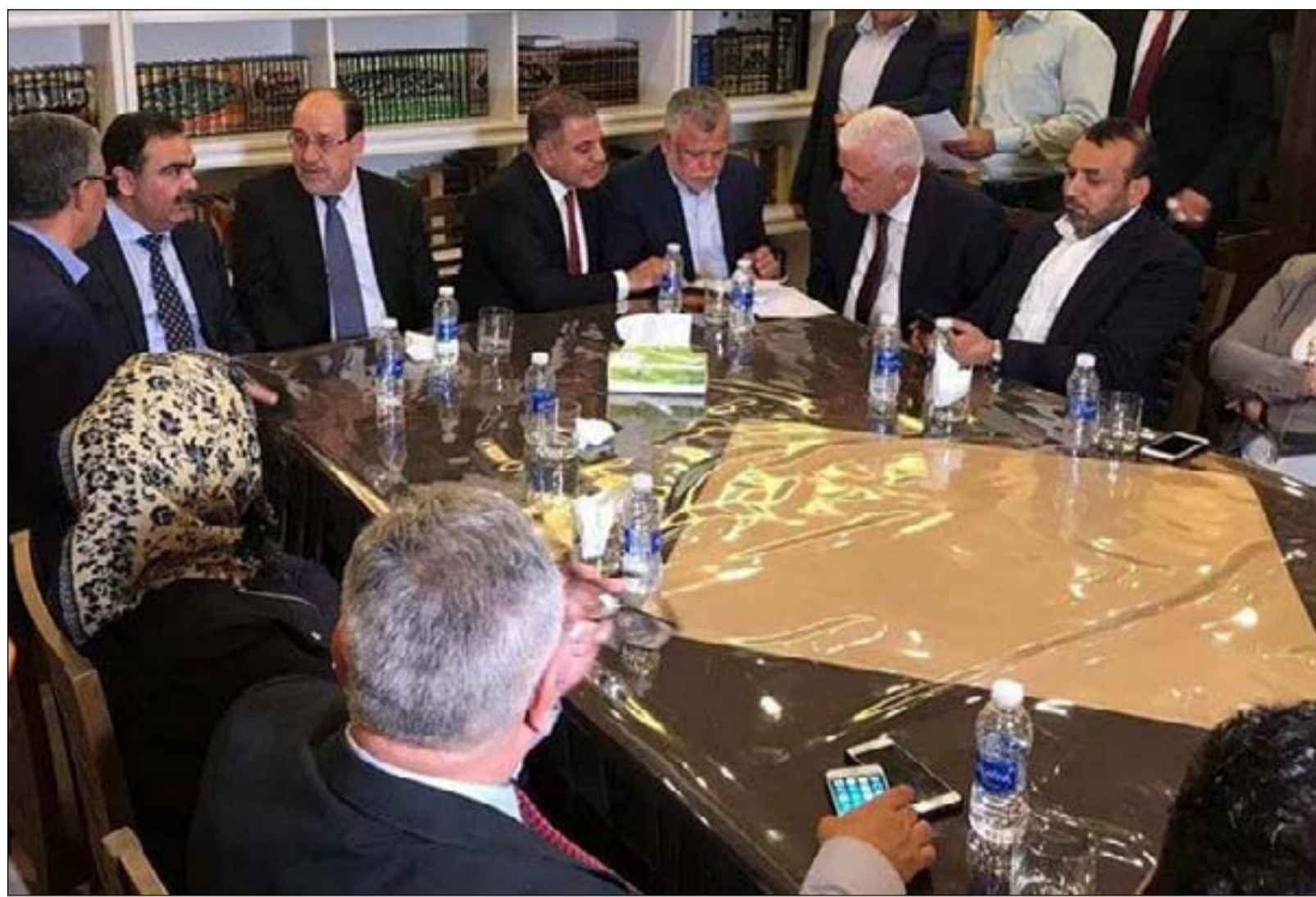
اجتماع سابق للقوى السياسية

اجتماعه مع القوى الشيعية تضمن معالجة المشكلة الاقتصادية ودعم القطاع الصحي لمواجهة أزمة كورونا، وكذلك تضمن على إجراء انتخابات برلمانية مبكرة خلال سنة من تشكيل الحكومة الجديدة، وكذلك دعم المؤسسات الأمنية، وحصر السلاح بيد الدولة، وأيضاً شمل فقرة تخص السيادة وجدولة خروج القوات الأجنبية". ويشير إلى أن "القوى الشيعية