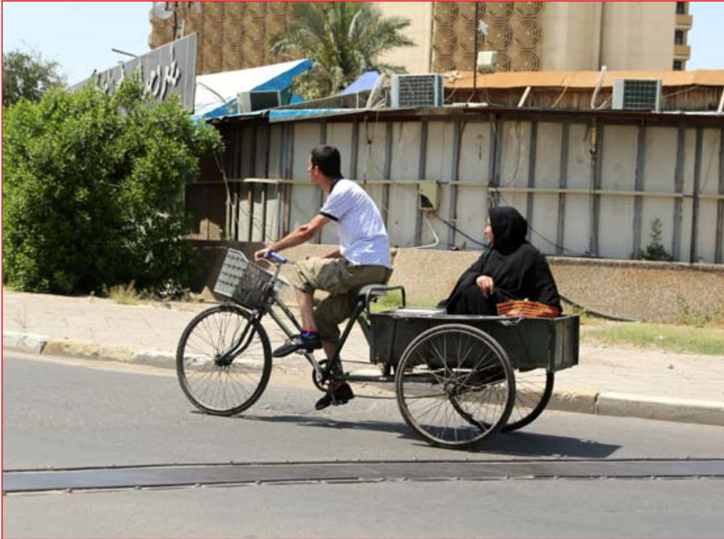
حظر التجوال يُجبر البغداديين على العودة إلى وسائل النقل البدائية...