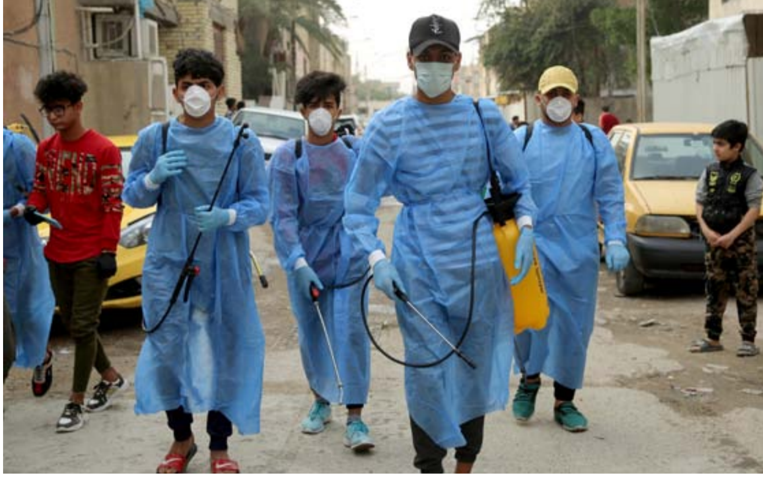
شباب ينظفون حملات تعفير في مناطق بغداد...