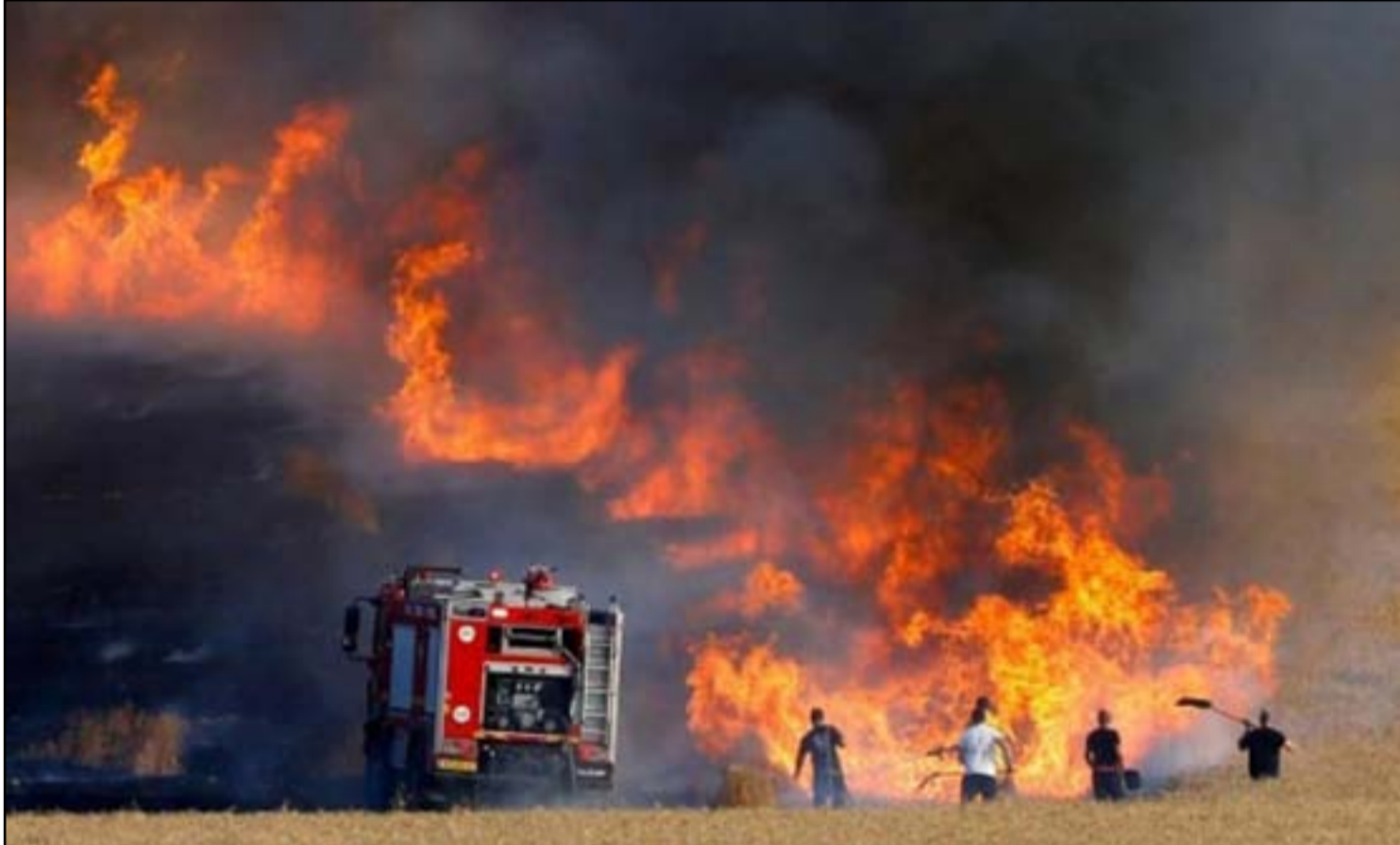
الايات الحكومية تكافح لاطفاء المحاصيل الزراعية

في الوقت الذي تصاعدت فيه هجمات تنظيم داعش في المناطق التي كانت تحت سيطرته قبل نحو 5 سنوات، عادت مشاهد حرق المحاصيل الزراعية مع موسم الحصاد وإعلان العراق الاكتفاء الذاتي من بعض الأغذية. حتى الآن سجلت حرائق في 4 محافظات في الشمال والجنوب والوسط، طالت مساحة تتجاوز الـ 200 دونم، تم إنقاذ الجزء الأكبر منها من قبل فرق الإطفاء، فيما الأراضي المحترقة تجاوزت الـ 45 دونماً.