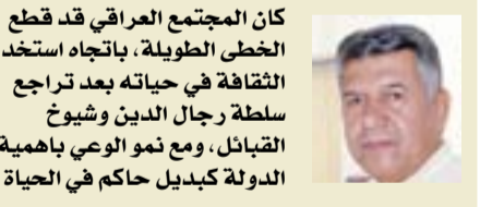
كان المجتمع العراقي قد قطع الخطى الطويلة، باتجاه استخدام الثقافة في حياته بعد تراجع سلطة رجال الدين وشيوخ القبائل، ومع نمو الوعي باهمية الدولة كبديل حاكم في الحياة

كان المجتمع العراقي قد قطع الخطى الطويلة، باتجاه استخدام الثقافة في حياته بعد تراجع سلطة رجال الدين وشيوخ القبائل، ومع نمو الوعي باهمية الدولة كبديل حاكم في الحياة، عبر مؤسساتها الخدمية والانتاجية، التي أصبحت تمنحه الكرامة في عيشه والصحة في بدنه والتعليم بين ابناءه، بل وكان الانسان العراقي يجد التطور ويتمسك الحضرة ويمثل الثقافة في مراجعته للمؤسسات تلك. ففي المدرسة والمستشفى والسوق ولدى صاحب المتجر الكبير وعند نقطة الحدود وفي دوائر الجنسية والجوازات والضريبة وغيرها رأى المواطن البسيط، والفلاح، القادم من اطراف القرية الموظف الابنق والجاذ في متابعة ما يريده منه، وتعرف على الرجل الخلق والمهذب، الذي احترمه ومنحه الكرامة فأجلسه على كرسي الانتظار، ريثما يكمل حاجته هناك. لكن، ما حدث في العراق بعد جملة الانقلابات العسكرية، وبعد الحرب مع ايران، كان فاجئياً بحق، فقد انهارت المنظومة الاخلاقية والمدنية، التي كانت قد قطعت خطاها الاجمل، ولعل تحطم صورة الضابط الوطني والمعلم المدني والموظف الشريف وغيرهم كانت الحد الفاصل بين زمنين، ويمكننا معاينة صورة وجه الشهيد وهي تتابع معاملة راتب تقاعد زوجها، وهي تنتقل بين الغرف الكثيرة، او صورة والده وهو ينتظر مفجوعاً يائساً بين الجنود ذوي القبعات الحمر، وعند بوابات الفرق والاولية والافواج، من هناك ابتدأت خطى الانهيار.