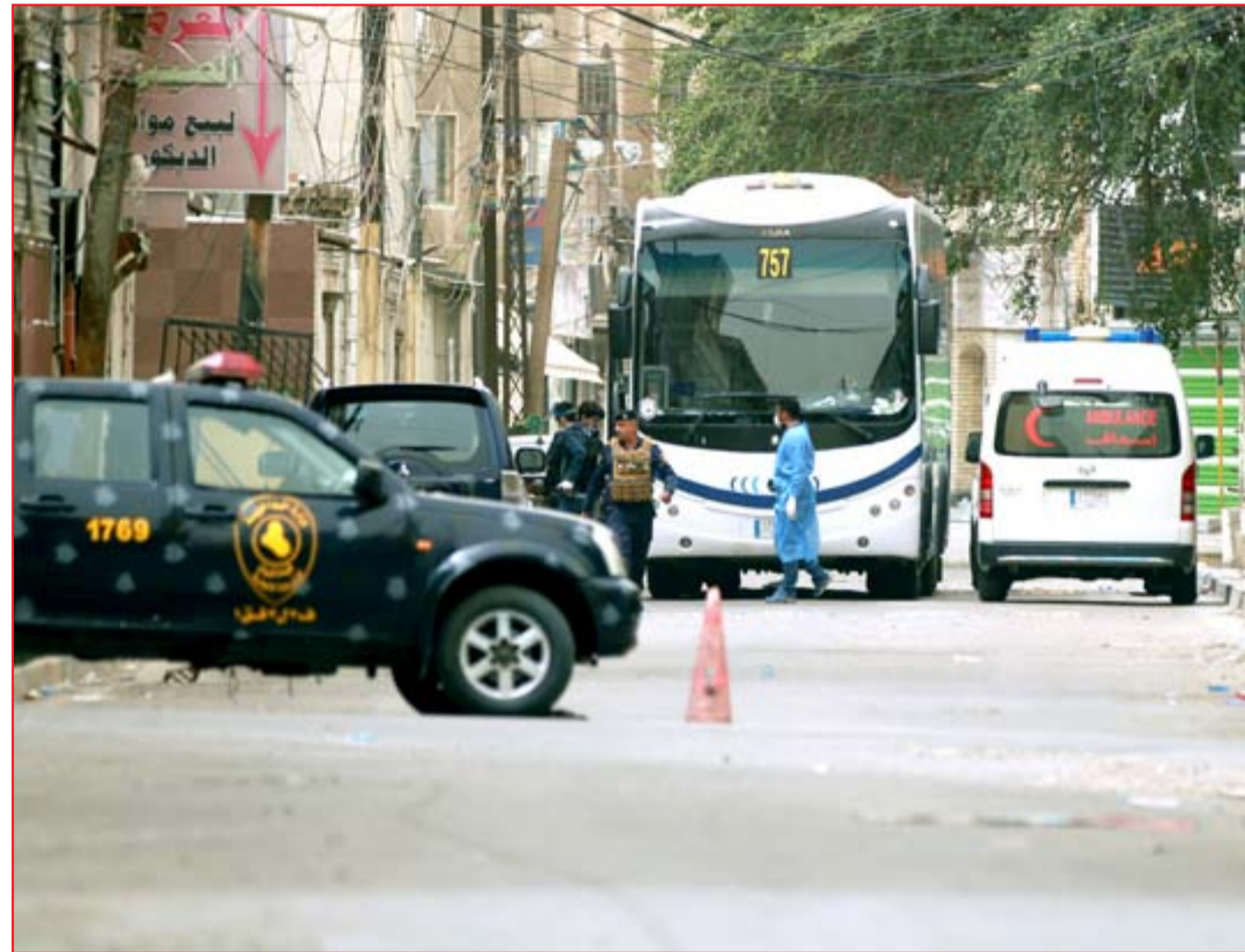
فنادق السعدون تتحول إلى أماكن للحجر الصحي - (عدسة: محمود رؤوف)

الجيش اللبناني بإطلاق النار عليه. ووقعت مواجهات ليلاً بين المتظاهرين والجيش في طرابلس، أقدم خلالها شبان على تحطيم واجهات مصارف وعدد من الصرافات الآلية. وترافقت الاحتجاجات مع "هاشتاغات" على وسائل التواصل الاجتماعي وأصبحت الأكثر تداولاً وفيها دعوات إلى إحراق المصارف، وكان أبرزها: "#ليلة_سقوط_المصارف". وعمل الجيش حتى وقت متأخر على تطويق الترحكات. وأعلنت قيادته في بيان تعرض ثلاثة مصارف وعدد من الصرافات الآلية للحرق واستهداف آلية عسكرية ودورية في المدينة، ما تسبب بإصابة أربعين عسكرياً. وأفادت عن توقيف تسعة أشخاص "لإقدامهم على رمي المفرقعات والحجارة". وأفادت هيئة صحية محلية عن إصابة أكثر من عشرين شخصاً خلال المواجهات. ويشكو المتظاهرون من الارتفاع الجنوني في أسعار المواد الاستهلاكية وخسارة قدرتهم الشرائية جراء أسوأ انهيار اقتصادي تشهده البلاد منذ عقود.