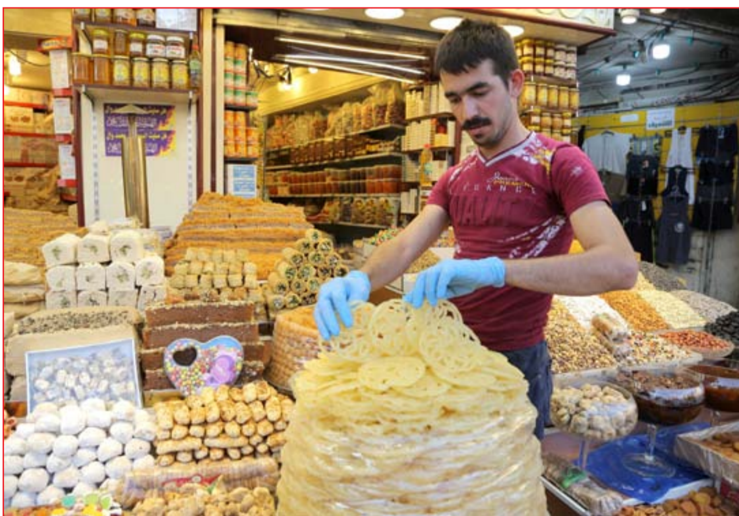
أصحاب محال الحلويات يشكون قلة الإقبال بسبب كورونا ...