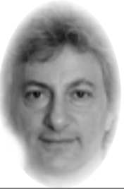
■ بقلم الصحفي البريطاني ديفيد هيرست

في حقبة ما بعد النفط ، سيفقد محمد بن سلمان سلطته على الشباب والمنتفعين ، ولكن انهيار الاقتصاد السعودي يعد أخباراً سيئة للمنطقة . لم يعد ولي العهد السعودي الأمير محمد بن سلمان يخاطب الرعية أو قبلي الخبرة . لقد مر ذلك الوقت . فما تراه هو ما تحصل عليه . سيستمر سوء الحكم ، والأخطاء الفادحة المرتبطة بالحرب ليس بكونه ولي للعهد فقط ، بل حينما يتولى العرش السعودي . لقد استعرض كل مهاراته كرجل دولة في المكالمات الهاتفية العاصفة التي أجراها مع الرئيس الروسي فلاديمير بوتين عشية اجتماع أوبك الشهر الماضي ، والتي انتهت بحرب أسعار مضجعة بين السعودية وروسيا .