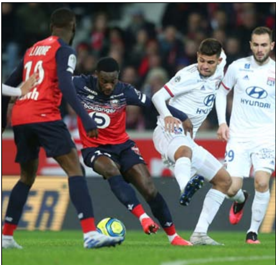
□ بغداد / المدى

سيكون يوم الخامس والعشرين من شهر أيار المقبل الموعد النهائي الذي تم تحديده من قبل الاتحاد الأوروبي لكرة القدم للاتحادات الوطنية الاعضاء المنضوية تحت لوائه لمعرفة مصير دورياتها بال موسم الحالي التي تم تأجيلها في وقت سابق بسبب تداعيات فايروس كورونا المستجد (كوفيد-19).