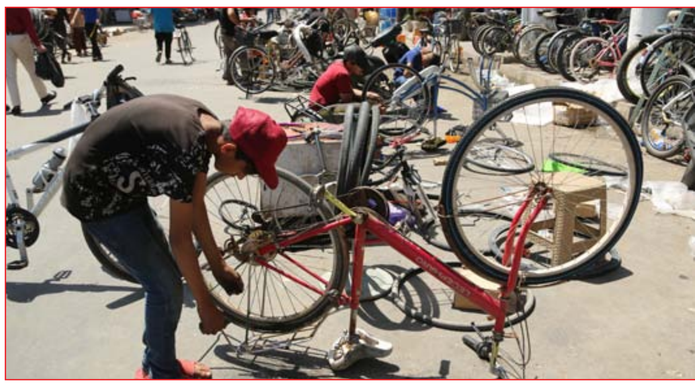
الأسواق الشعبية لا تعترف بكورونا..

وأصدرت الأمانة العامة لمجلس النواب إرشادات وقائية خاصة بجلسة التصويت على حكومة الكاظمي. وذكرت الأمانة أنه من اجل توفير الحماية الصحية اللازمة للنواب أثناء انعقاد الجلسة قررت أن يكون مكان انعقاد الجلسة في القاعة الكبرى وتنظيم جلوس النواب بين صف وآخر، فضلاً عن ترك عدد من المقاعد الفارغة بين نائب وآخر. وأكدت أن موظفي قسم