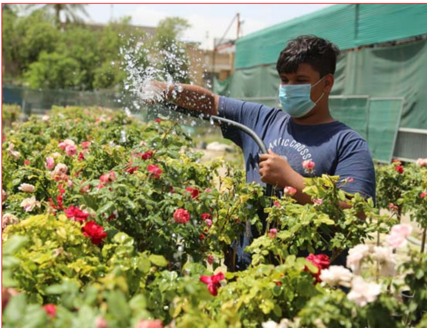
مشاتل بيع الورد تشكو قلة الطلب...