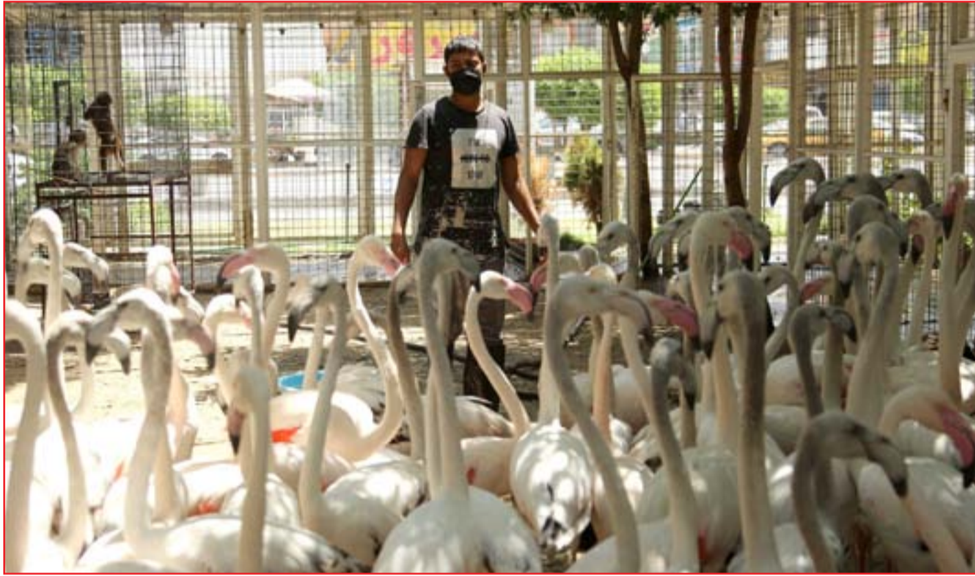
باتعو الطيور يشكون تراجع تجارتهم بسبب اجراءات الحظر ..