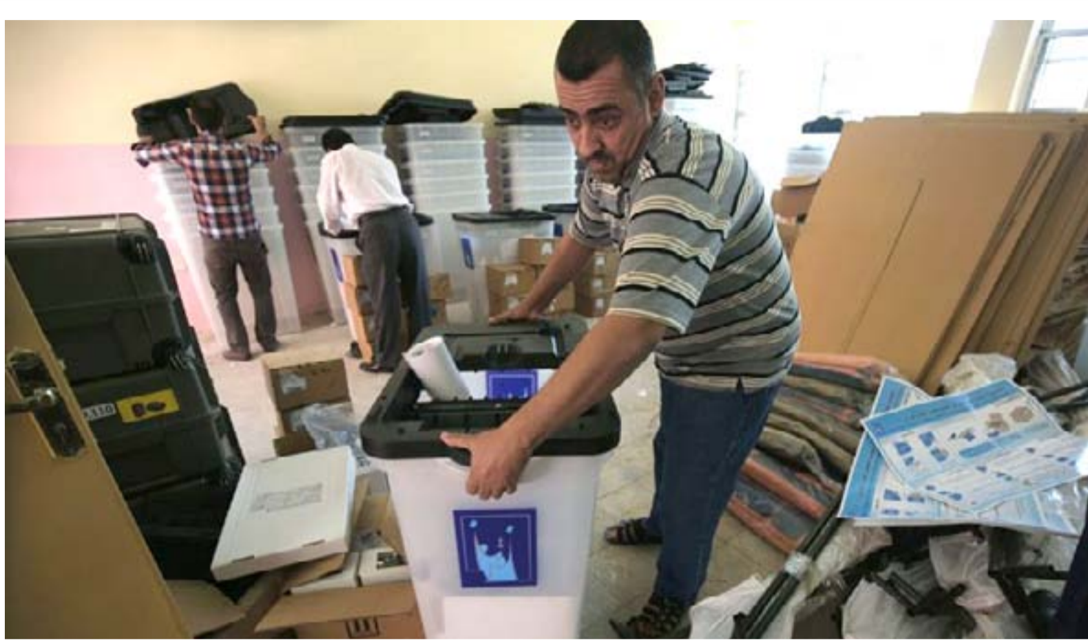
أحد موظفي مفوضية الانتخابات خلال عملية العد والفرز .. ارشيف

ويؤكد الغزي أن "إجابات من وزارة التخطيط وصلت إلى اللجنة القانونية النيابية بشأن القانون وإن اللجنة بدأت بدراسة كل المشاكل الموجودة في قانون انتخابات مجلس النواب، مبينا أن هناك اقتراحات ستناقشها القانونية النيابية بما يتعلق بالدوائر الانتخابية