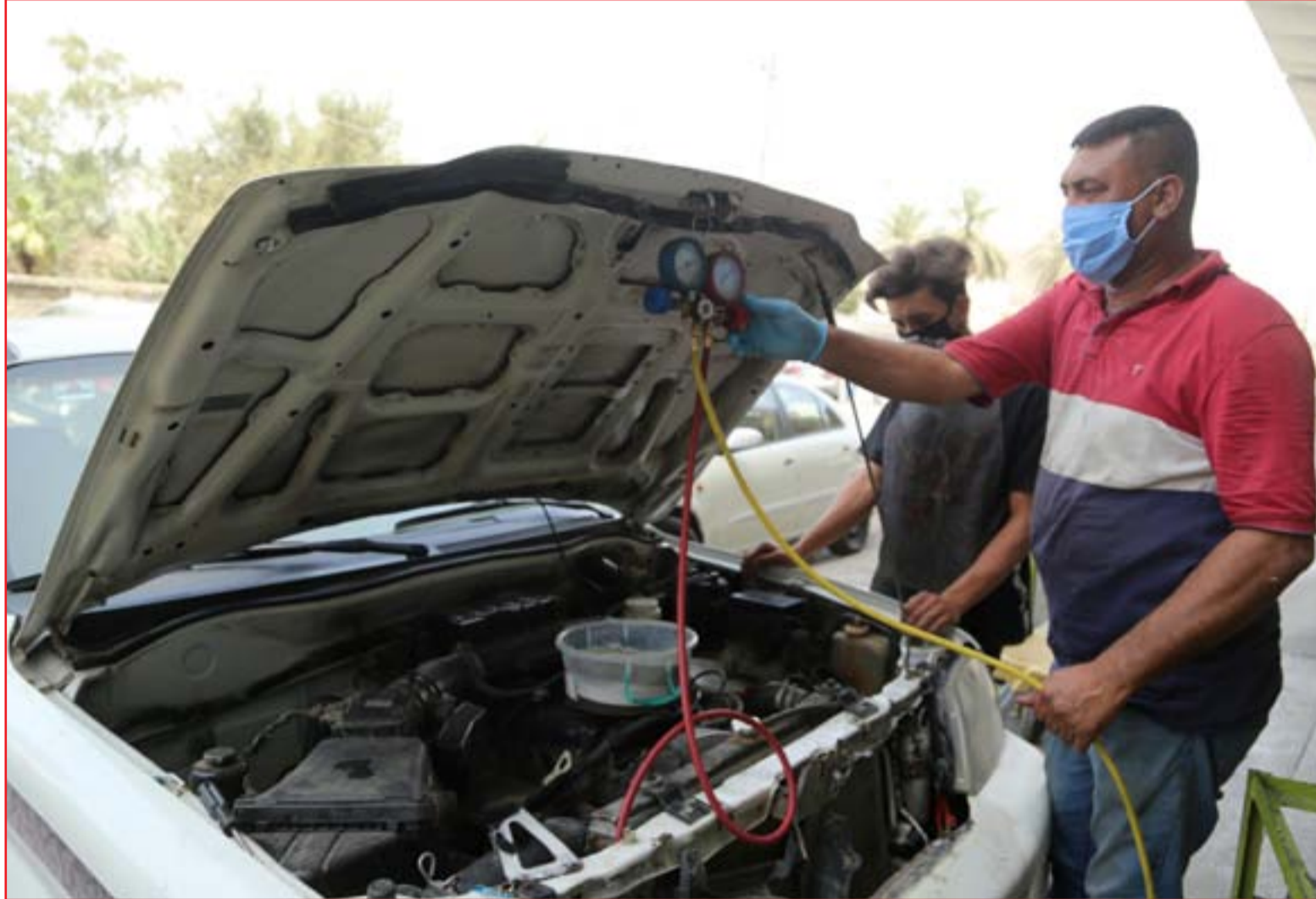
أصحاب المهن يلتزمون بإجراءات الوقاية والسلامة الصحية ..