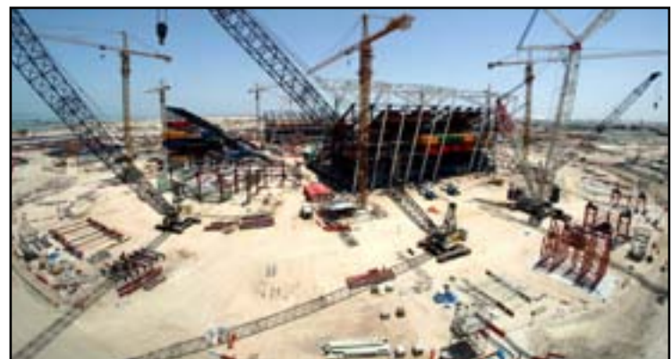
موقع بناء ملعب "راس أبو عبود" في الدوحة، قطر، خلال أعمال الإنشاء.

يذكر أن ملعب "راس أبو عبود" يستضيف عدداً من مباريات المونديال ضمن دور المجموعات حتى الدور ربع النهائي والمؤمل انطلاقه في الفترة ما بين 21 تشرين الثاني و18 كانون الأول 2022.