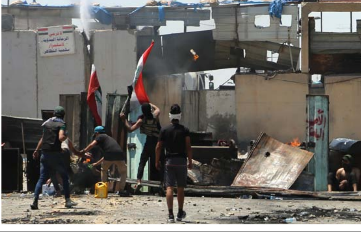
مظاهرات في ساحة التحرير