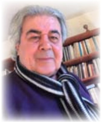
المخرج محمد توفيق

لقد تأزر المخرج محمد توفيق مع الممثل فاروق داود على إجحاح عملية السرد البصري، فالتجريب يكاد يكون ضُناً لمحمد، فهو شغوف إلى حدّ اللوع بهذا النمط الإبداعي الذي ينطوي على تحديات جدية لا تخلو من المجازفة غير أن رهانه لم يذهب أدراج الرياح لأنه كان متيقناً إلى حد كبير بأن فاروق داود يعرف أسرار اللعبة ربما نسمع ردها الصوتي المسجل الذي يوحي بحيوية ونشاط واضحين وكأنها أصغر من التوقع العمري التي رسمته مخيلات المتلقين. حينما يعود المنتظر من موعده مخذولاً يلقى بهوده باقة الورد على أرضية حديقة عامة ويمضى إلى شقته نسمع قطرات المطر المتساقطة على مظلته السوداء التي تذكرنا بفيلم "المطر" للمخرجين الهولنديين مانوس فرانكن وبورس إفغن وهو من الأفلام المتقدمة في السينما الوثائقية الهندية. كما أن فكرة "الانتظار" بحد ذاتها تحيلنا إلى مسرحية "في انتظار غودو" للروائي والكاتب المسرحي الإيرلندي صامويل بيكيت التي تقول ثيمتها الرئيسية: "لا شيء يحدث، لا أحد يأتي، لا أحد يذهب،