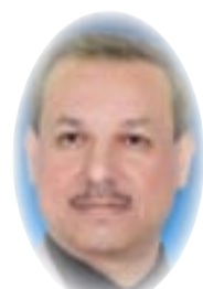
■ د. د. عدنان عودة الطائي

أحداث ساهمت بتغيير نظام الحكم من ملكي دستوري إلى جمهوري عام 1958 وبعد ذلك توالى الأحداث والانقلابات فحصل انقلاب شباط 1963 ومن بعده انقلاب 1968 حتى سقوط العراق دولة محتلة من قبل أمريكا وحلفائها ورافق هذه الأحداث والتطورات الكثير من حالات التمرد والحروب الخارجية والداخلية والانتفاضات ومانمخص عنها من نتائج ساهمت إلى حد بعيد من سقل مكانة العراق الدولية. ... لكن الذي حصل بعد العام 2003 من احتلال مباشر ومارافقه من انهيار لكل أسس الدولة ومازاد من تعقيد الموقف من تصدع مؤسسات الدولة التي يقوم عليها نظام الحكم فإنهار الجيش وغاب القانون وتسيدت لغة السلاح على المنطق وقبلها النظام والقانون وانفلتت الدولة الماسكة ليكون المشهد تحت رحمة الخارجيين عن القانون ليتشرذم البناء القومي للدولة وهكذا صار للعراق أكثر من علم وراية تحاكي تنوعه القومي والديني وحتى القبلي بعد أن كان العراق كله ينحني تحت راية واحدة وهذا ماشرعه دستور ملغوم في بعض من موه كتب على عجلة وبإياد غير وطنية فكانت المصيبة الكبرى وهي تشرذم الدولة قومياً ودينياً وحتى طائفياً، بل أبعد من ذلك لما تفرق أبناء الطائفة الواحدة مما جعلها أي دولة العراق فريسة سهلة أمام طموحات دول الجوار والقوى النافذة في العالم حتى أمسى العراق مسرحاً لأكثر من نفوذ فاعل لهذه الدولة أو تلك، بل الأدهى من ذلك هو مصادرة القرار العراقي