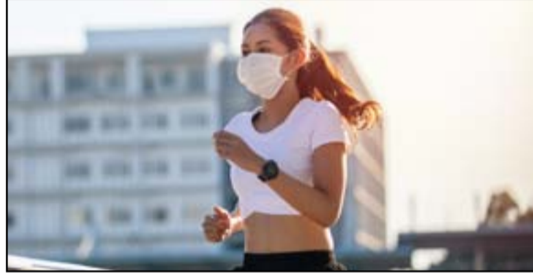
وأشار: "يقترح العلم أن التواجد في الخارج

وطمان البروفيسور آلان بن، عضو المجموعة الاستشارية العلمية للحكومة البريطانية، أن أولئك الذين يتوافدون إلى الحدائق العامة معرضون لخطر أقل بالإصابة بالفيروس مقارنة