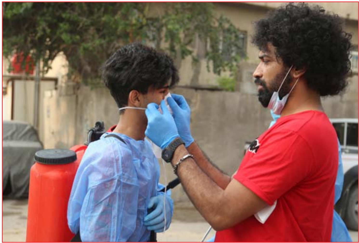
فرق تطوعية للتعفير في مناطق شرق القناة ..

يضيف العقابي أن "تجاوز هذه الأزمات (الصحية والاقتصادية والأمنية) يتطلب