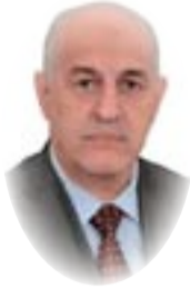
■ القاضي سالم روضان الموسوي

فئة ضحايا النظام السابق والحالي والعمليات الإرهابية وتنظم موارده المالية بشكل مستقل عن صندوق تقاعد الموظفين لخصوصيتهم باعتبارهم أن ما يتقاضوه هو تعويض عن ضرر وليس استحقاق تقاعدي عن خدمة قضائهم في العمل تمتد لسنوات عدة. 3. فصل العمال عن الموظفين وإلغاء قرار مجلس قيادة الثورة المنحل رقم 150 لسنة 1987 الذي قضى بتحويل جميع العمال إلى موظفين، مما أفقد شريحة العمال امتيازات كانت ممنوحة لهم بموجب قوانين العمل والحماية الدولية التي توفرها لهم منظمة العمل الدولية وكان الهدف في حينه سياسي لإبعاد العمال عن الانخراط في المنظمات النقابية خارج إطار الحزب الذي كان يتولى الحكم آنذاك، ومن ثم العودة إلى العمل بتقاعد العمال والضمان الاجتماعي وتفعيل ضم العمال في القطاع الخاص إلى نطاقه لشمولهم بامتيازاته، وفي الفترة الأخيرة ظهرت أصوات عنالية كثير تنادي بهذا الطلب. 4. الاهتمام بالاتجاهات الحديثة في علم تشريع النصوص القانونية أو ما يسمى بعلم الصياغة التشريعية والتحسب لكل الكلف التي يرتبها القانون وبيان ماهية مصادرها حتى لا يصدر القانون وهو غير قابل للتطبيق والتنفيذ لعدم وجود موارد مالية تكفي لتنفيذه، لأن النظريات الحديثة في علم القانون تشير إلى أن كل قانون يشكل كلفة مالية ولابد من إيجاد مصادر تمويل لتنفيذ ما ينص عليه في صلب القانون.