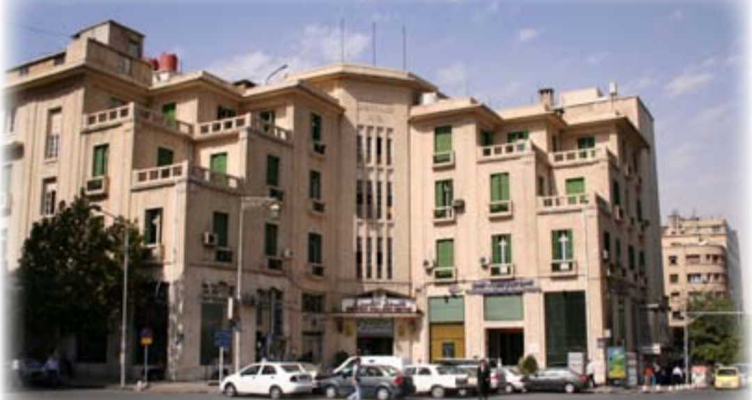
مبنى فندق أوريان بالاس "1934، دمشق/ سوريا، المعمار: انطون تابت، منظر عام.

تحدث في هذه الحلقة من «عمارات» عن مبنى في مدينة عربية امتلك لغة معمارية استثنائية في حينها، وعن معمار عربي اكتسب رؤى تصميمية، عدت وقتها، جذ طليعية في مقاربتها التصميمية، وجد حداثية في طروحاتها المعمارية، وغير مسبوقة في تداعياتها ونتائجها البنائية. نحن نتحدث عن فترة زمنية هي بدء الثلاثينيات من القرن الماضي، وعن معمار شاب امتلك جميع الأدوات لأن يكون حداثيا ورائداً ومجدداً، نحن، بالطبع، نتحدث عن عمارة فندق "أوريان بالاس" قصر الشرق > بدمشق / سوريا (1934)، وعن معمار هذا المبنى اللبناني: "انطون تابت" (1905 - 1964)، ولهذا فبالإمكان، أيضاً، قراءة عنوان هذه الحلقة >.. عندما يكون "المعمار" رافعا للحدائثة.. وخالقاً لها!؛ ذلك لأن دور "العمارة" و"المعمار" هنا، في هذه الحالة تحديداً، يكاد أن يدعجا معنا في مهمة فريدة: يكمل الواحد الآخر ويتممه.