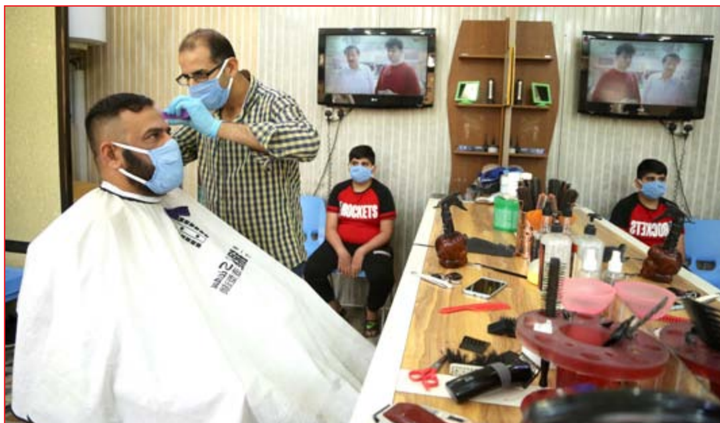
محل الحلاقة تعمل بأقصى طاقتها قبل العيد في ظل إجراءات الوقاية..

محافظ البنك المركزي، مستشاري رئيس الوزراء، والأمين العام لمجلس الوزراء، وممثل عن الأمانة العامة لمجلس الوزراء. ■ التفاصيل ص ٢