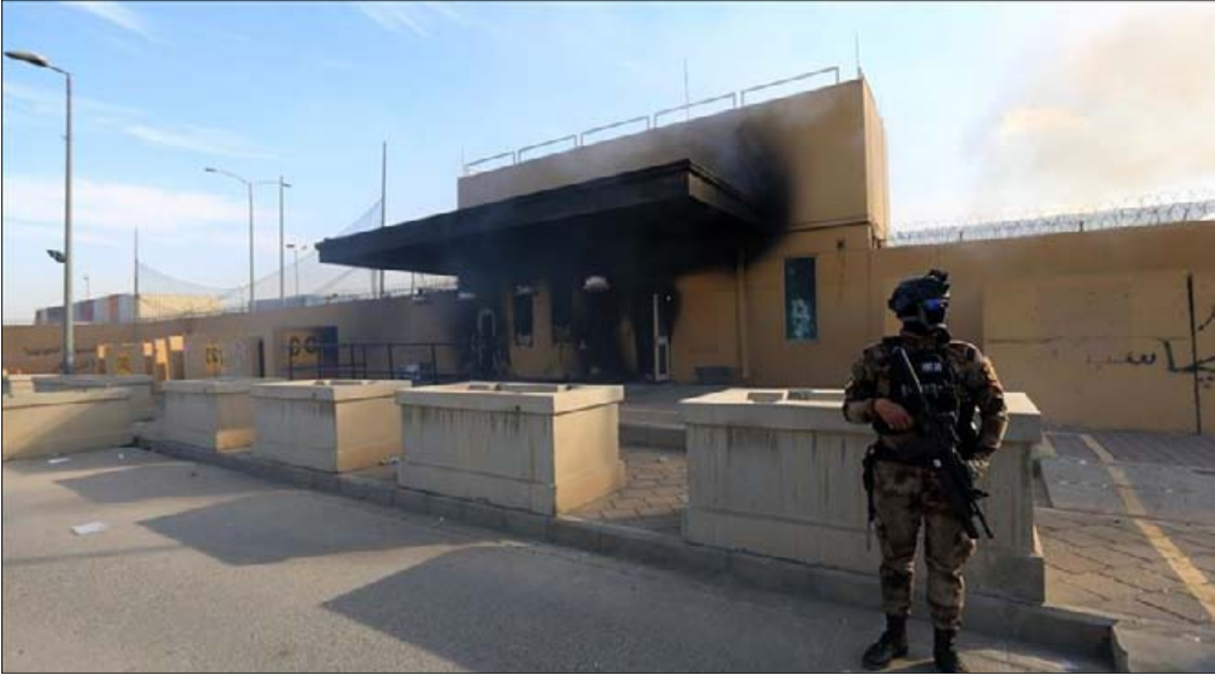
مدخل السفارة الاميركية بعد محاولة اقتحامها من محتجين

ويرى رئيس حزب الأمة، ان على الكاظمي "حل البرلمان" والإسراع في إجراء "انتخابات مبكرة" في حال أراد السيطرة على السلاح الذي يعمل خارج ارادة الدولة، كما يقول الالوسي ان "واشنطن ستساند بغداد في السيطرة على السلاح وكبح جماح إيران، خصوصا إذا اعيد انتخاب الرئيس الأمريكي دونالد ترامب لولاية ثانية".