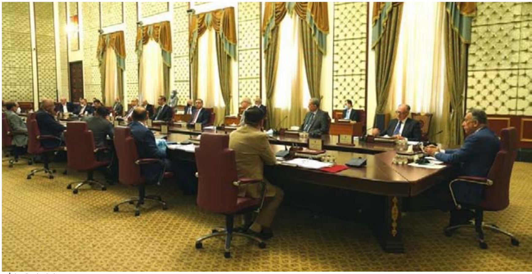
جلسة مجلس الوزراء أمس

قالت اللجنة المالية في مجلس النواب إن خلية الطوارئ للإصلاح المالي التي شكلها رئيس مجلس الوزراء مصطفى الكاظمي بدأت بإعداد قانون الموازنة الاتحادية للعام الجاري، متوقعة وصول مسودة المشروع إلى البرلمان بعد عطلة العيد.