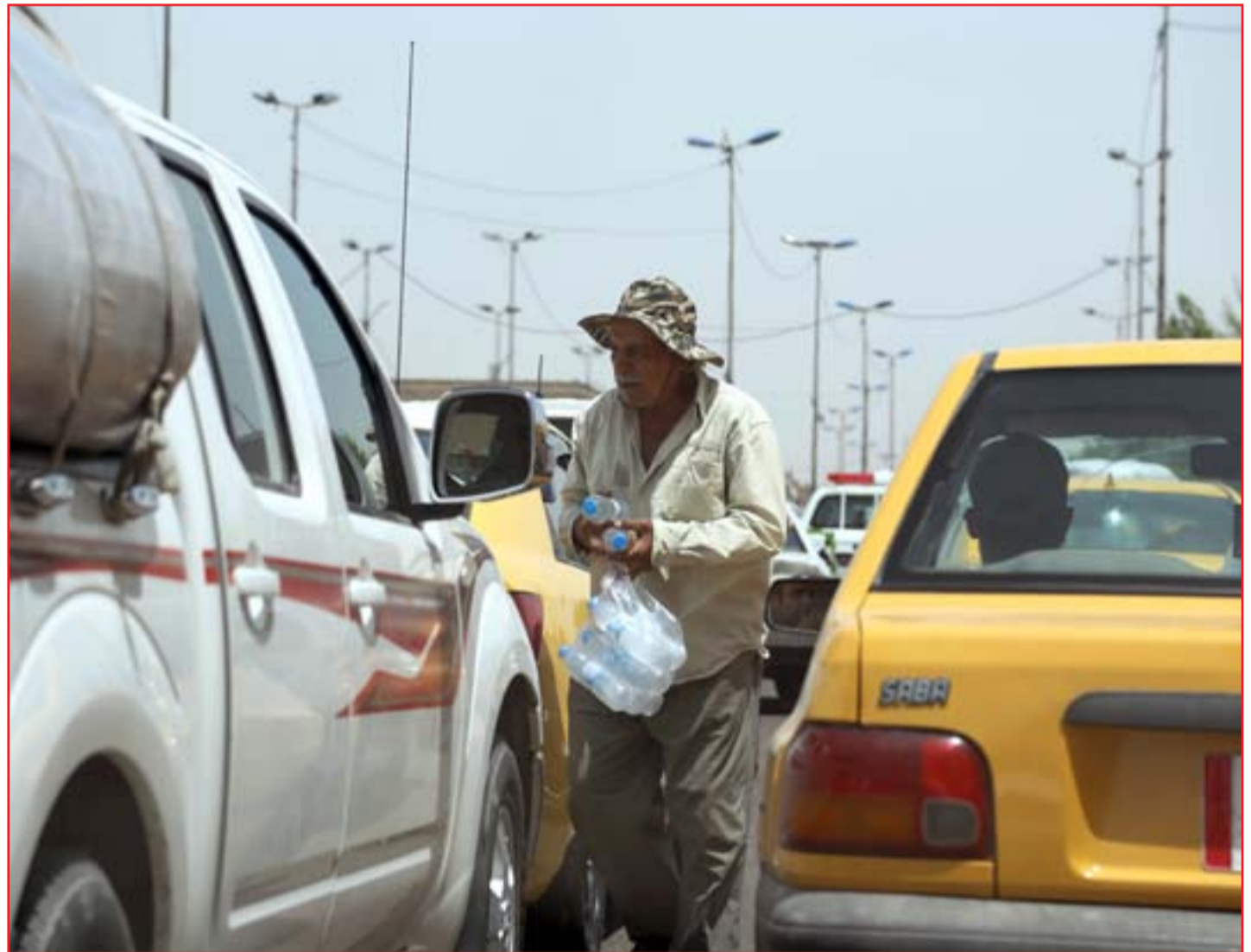
اختناقات عند نقاط التفتيش في ظل حظر التجوال .

الرياض تقرر عودة سفيرها إلى بغداد لمزاولة عمله الوفد العراقي في السعودية يبحث سوق النفط وملف الاستثمار