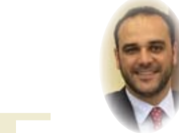
د. أشير ناظم الجاسور

على رضا هذا الشعب الذي لا يهدأ اذا ما تمت المراهنة على إجراءات ترقيعية لا تجدي وتسويف كل ما له علاقة بمصيره، ان المهمة صعبة بهذه الأجزاء الداخلية والإقليمية والدولية التي بكل المقاييس معرقة لكل تقدم لان الحكومة الحالية عليها واجبات وستتحمل معالجة كل التراكمات التي سببتها الحكومات السابقة. ان النظام السياسي في العراق يعاني من جملة تناقضات خصوصاً إذا تم التركيز على توجهاته في عملية الإدارة والتخطيط والوسائل والأدوات ناهيك عن الخطاب الأكثر تناقضاً والذي يحمل في جنباته عوامل الصراع والنزاع، بالتالي فان القضاء على هذه التناقضات يكون من خلال بلورة رؤية علمية ومنظمة تخلق حالة من التوازن مع الأوضاع الداخلية والإقليمية والدولية، وتغيير الكثير من الأفكار والسياسات المستند عليها النظام الحالي. ان هذه الرسالة تبين أيضاً حجم الخطر والتعقيد اللذين صاحبا كل تشكيل حكومي لكن الطرف اليوم أخطر واصعب، تضمنت هذه الرسالة مجموعة من النقاط التي تبين ان مهمته معقدة قياساً بسابقيه خصوصاً وأنه ختمها بتعهد سيتم التذكير به