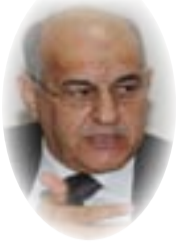
القاضي سالم روضان الموسوي

تاريخ ٢١/١٠/٢٠١٩ صدر قانون (رسم طابع الحملة الوطنية لبناء المدارس ورياض الأطفال) رقم ١٩ لسنة ٢٠١٩ وفي هذا القانون تم فرض رسم طابع مقدارها (١٠٠٠) ألف دينار يدفعه المواطن عن كل معاملة يتقدم بها إلى أي دائرة من دوائر الدولة، وإذ افتراضاً أن عدد الأشخاص البالغين الذين لهم حق تقديم الطلبات يناهز العشرين مليون مواطن على وفق الإحصائيات المعلنة حيث أشارت إلى أن عدد غير البالغين ممن هم أقل من ثمانية عشر يقارب ستة عشر مليون وما تبقى عددهم يتجاوز العشرين مليون،