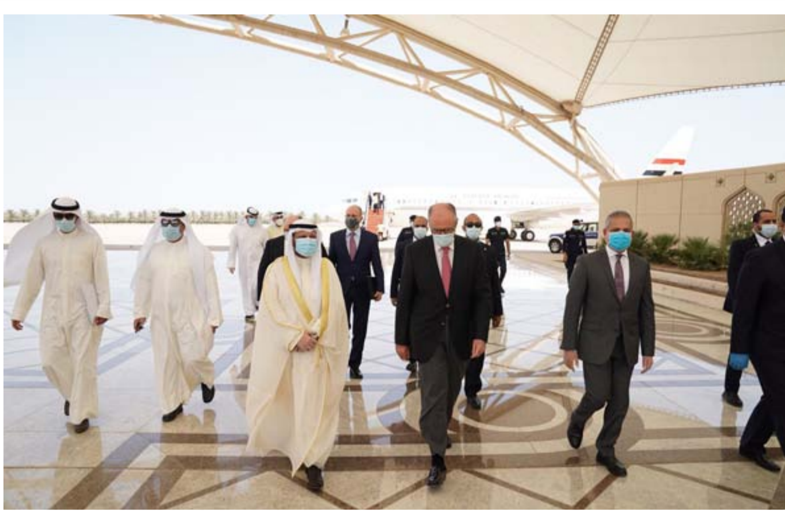
وزير المالية أثناء وصوله إلى السعودية

ويقول عامر الفايز، عضو لجنة العلاقات الخارجية النيابية ل(المدى) إن زيارة وزير المالية علي علاوي إلى السعودية كانت لها ثلاثة اهداف اولها اقتراض ثلاثة مليارات دولار من السعودية لتعزيز الموازنة الاتحادية التي تعيش فترة حرجة، فاندتها ان تقوم السعودية والكويت بتخفيض حصصهما النفطية في اوبك (مليون برميل) مقابل عدم المساس بحصة العراق، وثالثها الربط الكهربائي بين العراق والسعودية لتعويض أو استبدال الربط الإيراني. لكن وزارة المالية نفت في بيان لها، صحة الأنباء المتداولة بشأن طلب العراق من السعودية اقتراض نحو 3 مليارات دولار. وأكدت في بيان أن هذا الكلام لا صحة له، لكن إذا تحدثنا عن حجم الدعم الذي سنحصل عليه من المشاريع السعودية التي يمكن أن تنفذ في العراق، وفي حال لو جمع رأس المال لهذه المشاريع ربما نصل إلى هذا الرقم وأكثر، نحن نريد أن نحرك الاستثمار داخل العراق. وأوضح البيان أن وزير المالية علي علاوي اختتم السبت زيارة رسمية إلى المملكة العربية السعودية، نقل خلالها رسالة من رئيس مجلس الوزراء مصطفى الكاظمي إلى الملك سلمان بن عبد العزيز آل سعود، وبحث خلالها العلاقات الاقتصادية بين البلدين، منابعا، أن الوزير عقد أثناء زيارته اجتماعات مع وزير الطاقة الأمير عبد العزيز بن سلمان آل سعود، ووزير الخارجية الأمير فيصل بن فرحان آل سعود، ووزير المالية محمد الجديعان،