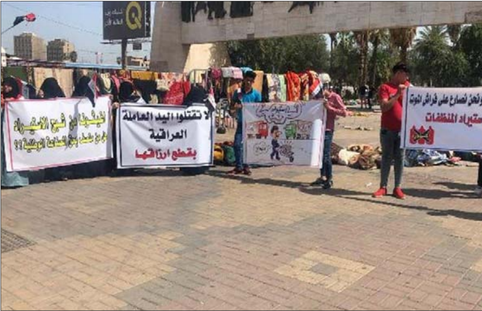
محتجون في ساحة التحرير

وأضاف الناشط: "يبدو تحركهم الآن منفعي واعلنوا انضمامهم إلى التظاهرات فقط لانهم شعروا بالخطر، وسيتركنا في منتصف الطريق بعد ان تعود رواتبهم، مسانلاً: "أين كنتم حين كنا نذبح على يد الاحزاب والمليشيات".