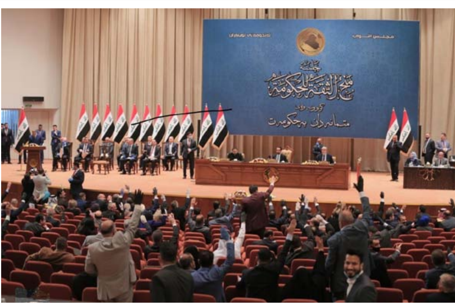
جلسة منج الثقة لحكومة الكاظمي