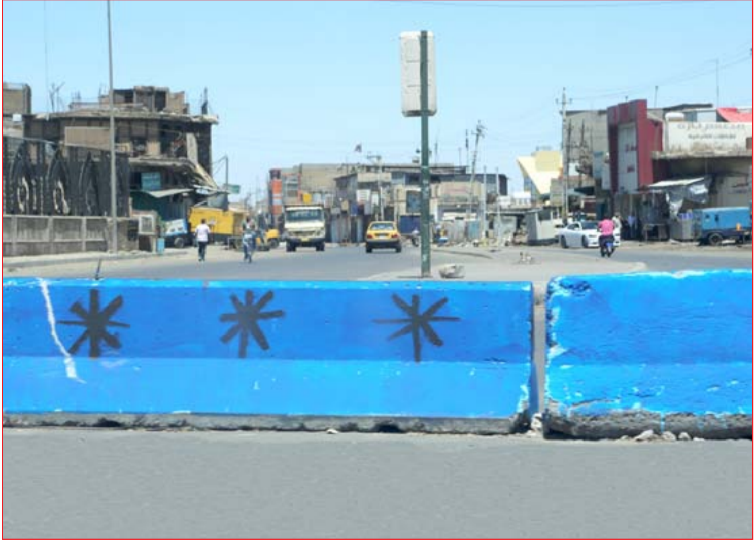
إغلاق الطرق بالكتل الكونكريتية لم يقلل حركة المدنيين ..

يبدو أن العراق يتجه إلى أزمة جديدة مع تحرك تحالف سائرون بزعمارة زعيم التيار الصدري مقتدى الصدر، مجدداً، لإقالة رئيس البرلمان محمد الحلبوسي. وأعلن تحالف "سائرون" أنه وأطراف سياسية أخرى يتبنون إقالة الحلبوسي من منصبه، وأن ذلك يعود إلى "الإشكالات والملاحظات المؤشرة على أداء الحلبوسي، منها انحيازه لمكونات سياسية معينة على حساب كتل أخرى، وعدم محاسبته للغاسدين وقلعة المتظاهرين وتعطيله جلسات مجلس النواب"، بحسب ما صرح النائب عن "سائرون" حسن الجحيشي لـ(المدى) قبل أيام. وجاءت التحركات مباشرة بعدما أعلن التحالف أنه سيقدم ورقة مطالب إلى الحلبوسي، وفيها سقف زمني لتصحيح مساره في رئاسة مجلس النواب وتقويم عمله التشريعي والرقابي، متهما إياه بالتقصير في الجلسات. وكان الحلبوسي قد جاء باتفاق سياسي بين تحالف "سائرون" وكتلة الفتح، لكن لا يعني ذلك أن الكتل لا يمكنها أن تنقلب على ما اتفقت عليه سابقاً من أجل تأمين مصالحها أو ارتفاع سقف مطالبها، بحسب المحلل السياسي العراقي الدكتور علي المعموري. ويضيف المعموري، أن "كتلة سائرون على وجه الخصوص نموذج بارز لهذا النوع من الابتزاز السياسي، حيث تتبع الكتلة الزعيم الصدر، وهو الذي تحالف مع رئيس الوزراء الأسبق نوري المالكي ومن ثم انقلب عليه وتحالف مع رئيس الوزراء التالي حيدر العبادي ومن ثم سحب دعمه عنه ليفشل في الوصول إلى دورة ثانية، ومن ثم دعم رئيس الوزراء السابق عادل عبد المهدي قبل أن يسحب دعمه ليضطر إلى الاستقالة". ■ التفاصيل ص٢