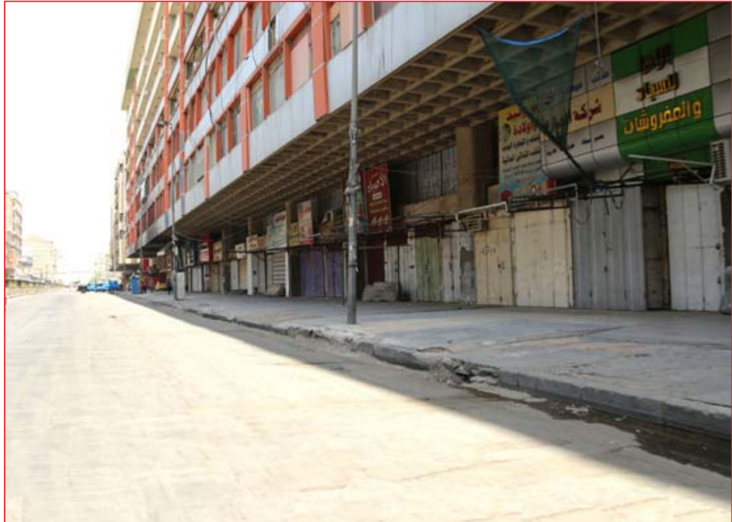
مركز بغداد التجارية مغلقة منذ أسابيع بسبب تفشي كورونا ..