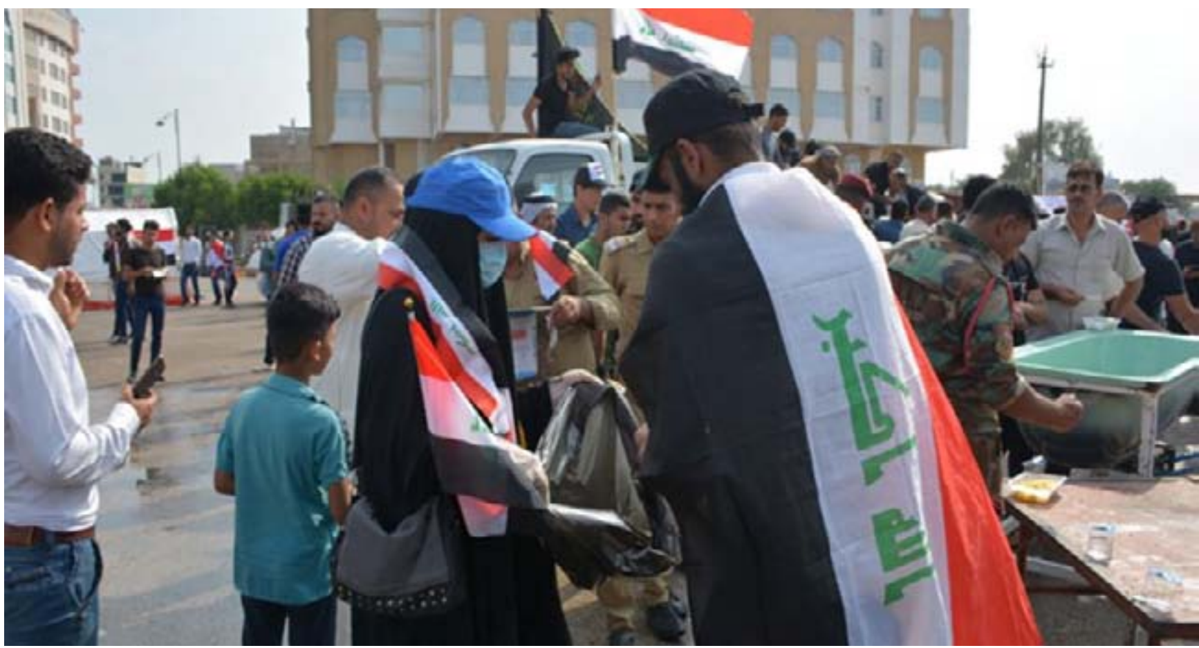
متظاهرون في ساحة الصدرين في النجف