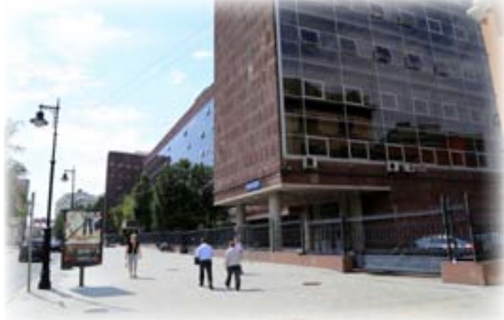
مبنى "مركز الاتحاد" (١٩٢٨ - ١٩٣٦)، موسكو، المعمار: لو كوربوزيه. منظر عام.