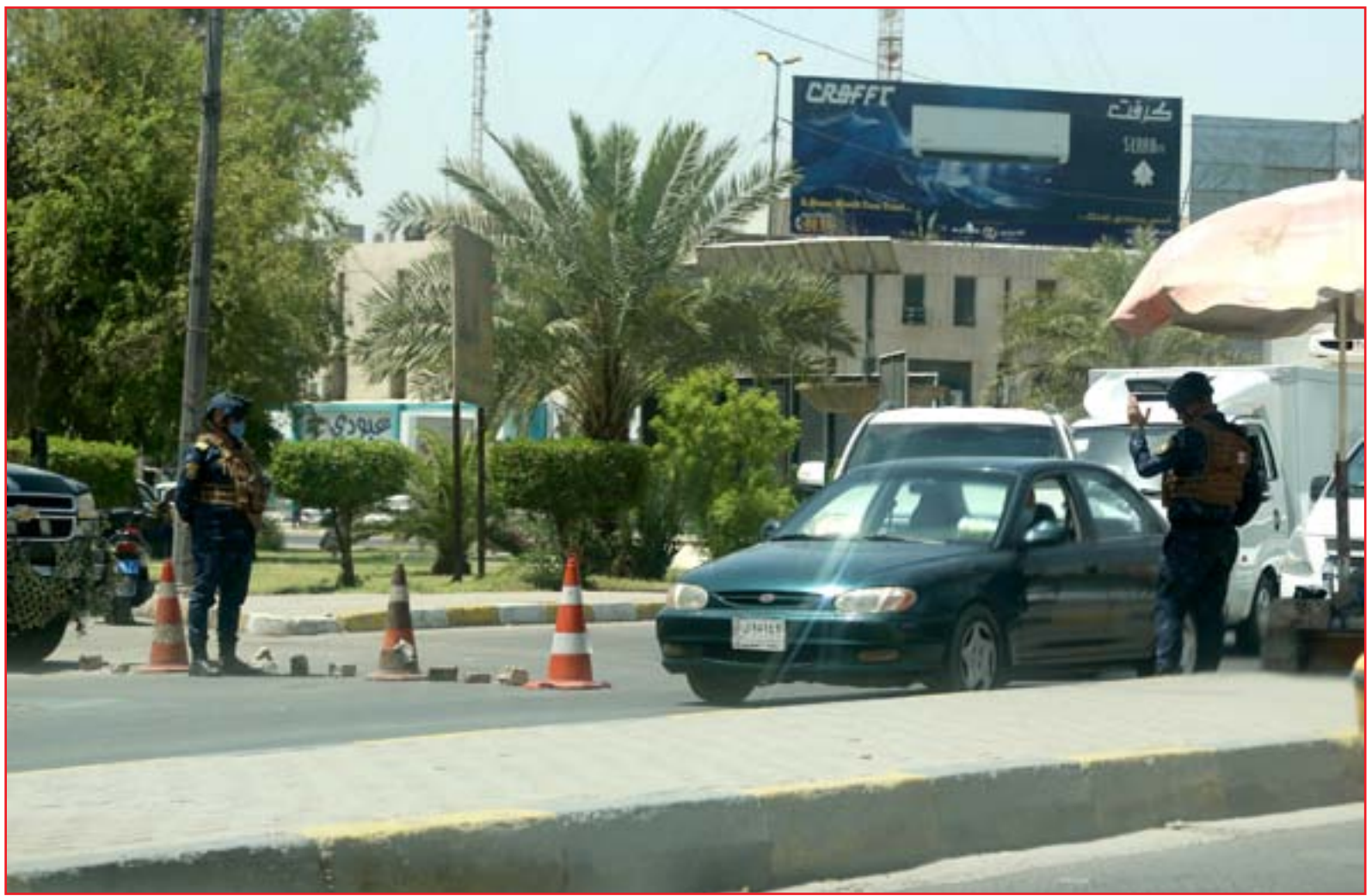
اجراءات مشددة تمنع المستنئين من الحظر بدون سابق انذار ..

قرار قيادة عمليات بغداد القاضي بإلغاء استثناءات الصحفيين من الحظر الشامل، ما هو إلا مصادرة للحريات الصحفية". واکد الصحفيون، وفق البيان، أن "القرار الاخير مجحف بحق الاسرة الصحفية، إضافة الى انه منعه من ايصال رسالتهم الاعلامية خلال فترة تطبيق الحظر الصحي الشامل، من اجل المساهمة في تجاوز أزمة جائحة كورونا".