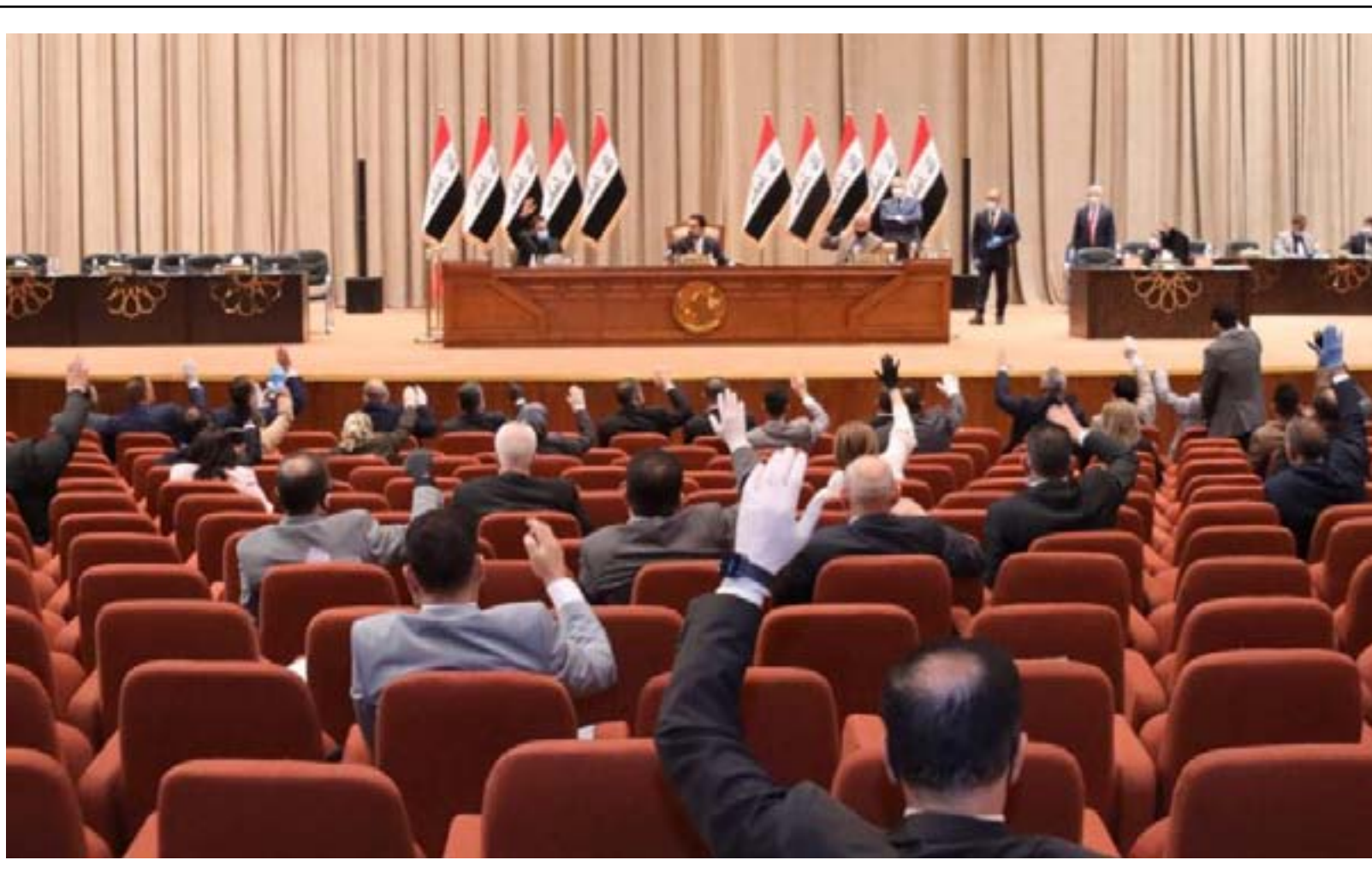
جلسة مجلس النواب أمس

وضمن خطته التشفية اصدر مجلس الوزراء في جلسته الاخيرة مجموعة من القرارات من بينها الموافقة على إعادة ترتيب أولويات بنود الإنفاق، وذلك انسجاماً مع الإصلاح المالي والاقتصادي الذي تتبناه الحكومة العراقية. بحسب بيان للحكومة. وتشمل الحزمة الأولى، رواتب كبار موظفي الدولة، وازدواج الرواتب، ومعالجة الموظفين الوهميين، والرواتب التقاعدية محتجزي رخصاء وما يتقاضاه موظفو الكيانات المنحلة للنظام السابق من مرتبات تقاعدية وفق قانون التقاعد وضمن الحدود الدنيا للرواتب التقاعدية.