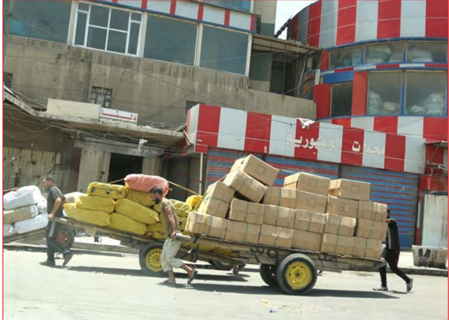
المحال التجارية تشكو البضائع من دون السماح لها بالعمل ..