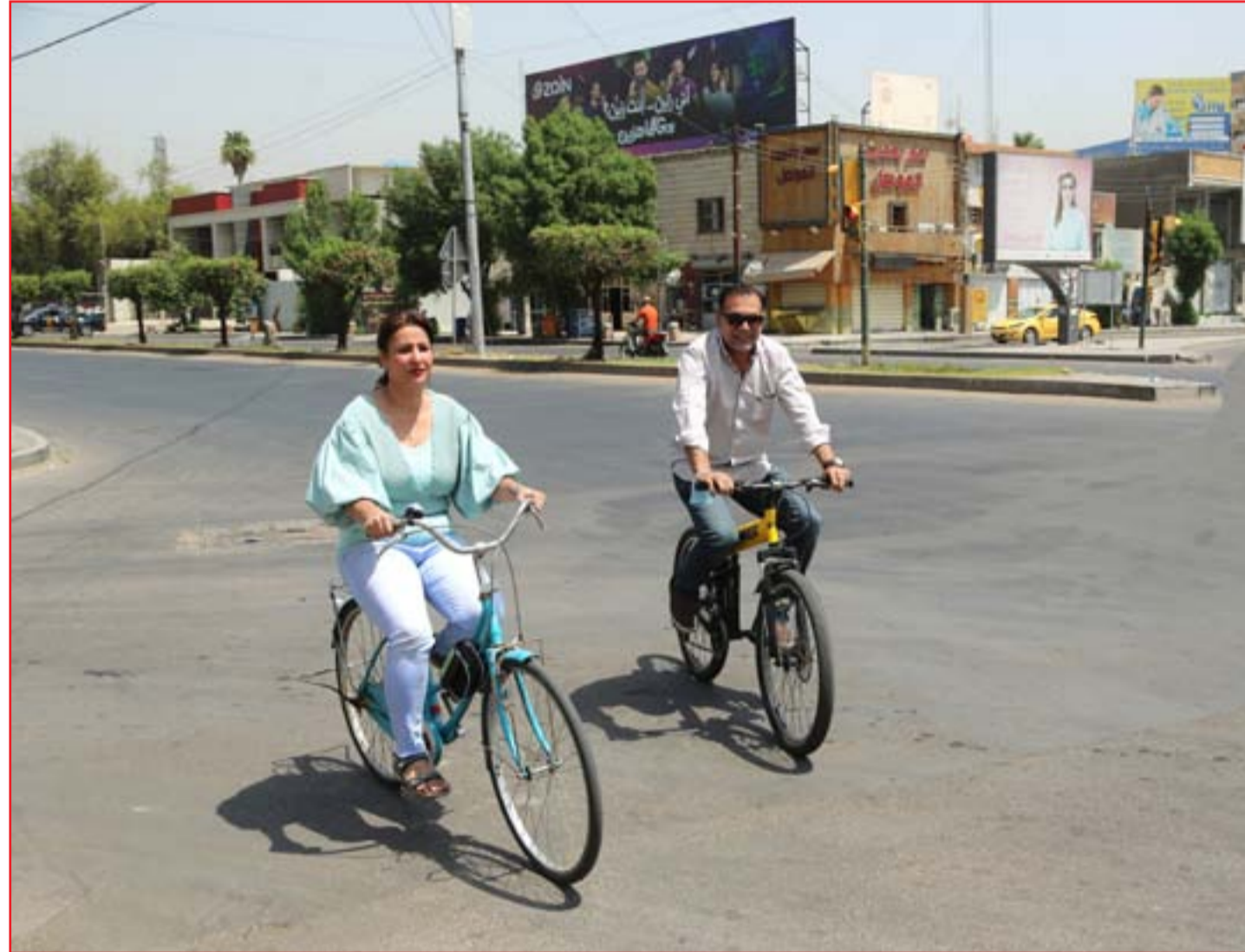
بغداديون يستعينون بـ "البايسكلات" للتنقل في ظل الحظر الشامل.

التعديل الذي أضافته المالية النيابية حدد حجم الاقتراض الخارجي بـ (9) مليارات دولار، وحجم الاقتراض المحلي بـ (15) تريليون دينار، لافتة الى ان "هذا التعديل أزم ان تكون الفائدة لهذه القروض لا تتعدى الفوائد المعتمدة دولياً". وفي الثلاثين من شهر أيار الماضي كشف تقرير لـ (المدى) عن وجود توجه حكومي نحو الاقتراض من