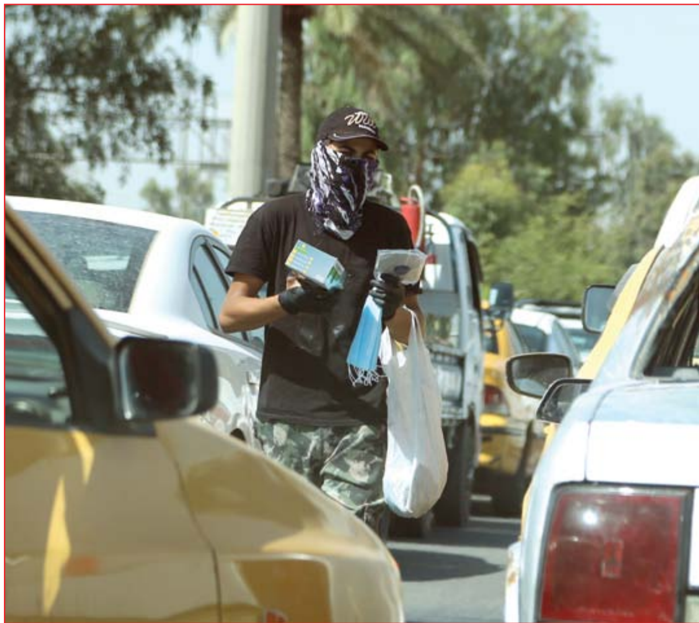
الباعة التجولون يعملون من أول أيام الحظر الجزئي ..