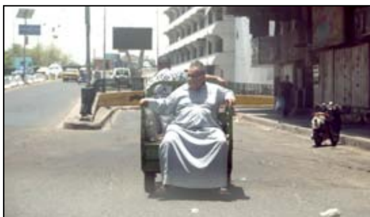
بغداد بعد الساعة السادسة مساءً ...

أكدت وزارة الصحة تسجيل ١١٠٦ إصابة بكورونا يوم امس، فيما سجلت ١١٥٠ حالة شفاء وهي اعلى نسبة تسجل منذ ظهور الفايروس. وقالت وزارة الصحة في بيان تلقته (المدى) انه "تم فحص (١٠١٣٥) نموذج في كافة المختبرات المختصة في العراق لهذا اليوم؛ وبذلك يكون المجموع الكلي للنماذج الفحصية منذ بداية تسجيل المرض في العراق (٣٨٠٠٥)". وأضافت ان "المختبرات سجلت (١١٠٦) إصابة جديدة موزعة كالتالي: بغداد / الرصافة