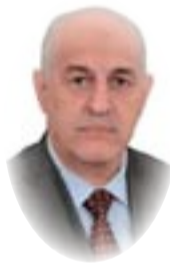
القاضي سالم روضان الموسوي

المختصمين ، ولا يتعدى أثره إلى الغير باستثناء بعض أحكام القضاء الدستوري والقضاء الإداري حيث تسري آثاره على من لم يكن ممثلاً فيه عند التصدي للقواعد القانونية العامة والمجردة والأوامر الإدارية ذات الصبغة العامة، ولا يجوز للقضاء أن يتولى تفسير النصوص القانونية بشكل منفرد أو بناء على طلب من جهة ما لأن هذا العمل يخرج من اختصاصه وكان للمحكمة الاتحادية العليا أكثر من قرار رفضت فيه أعطاء التفسير للنصوص القانونية لأنها