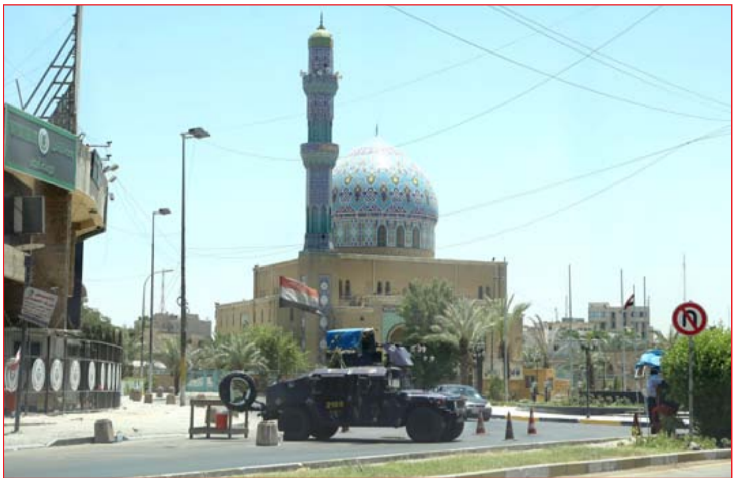
... (عسة: محمود رؤوف)

ورفض الموسوي الكشف عن اسم المرشح الذي اتفق عليه المكون التركماني. ■ التفاصيل ص 3