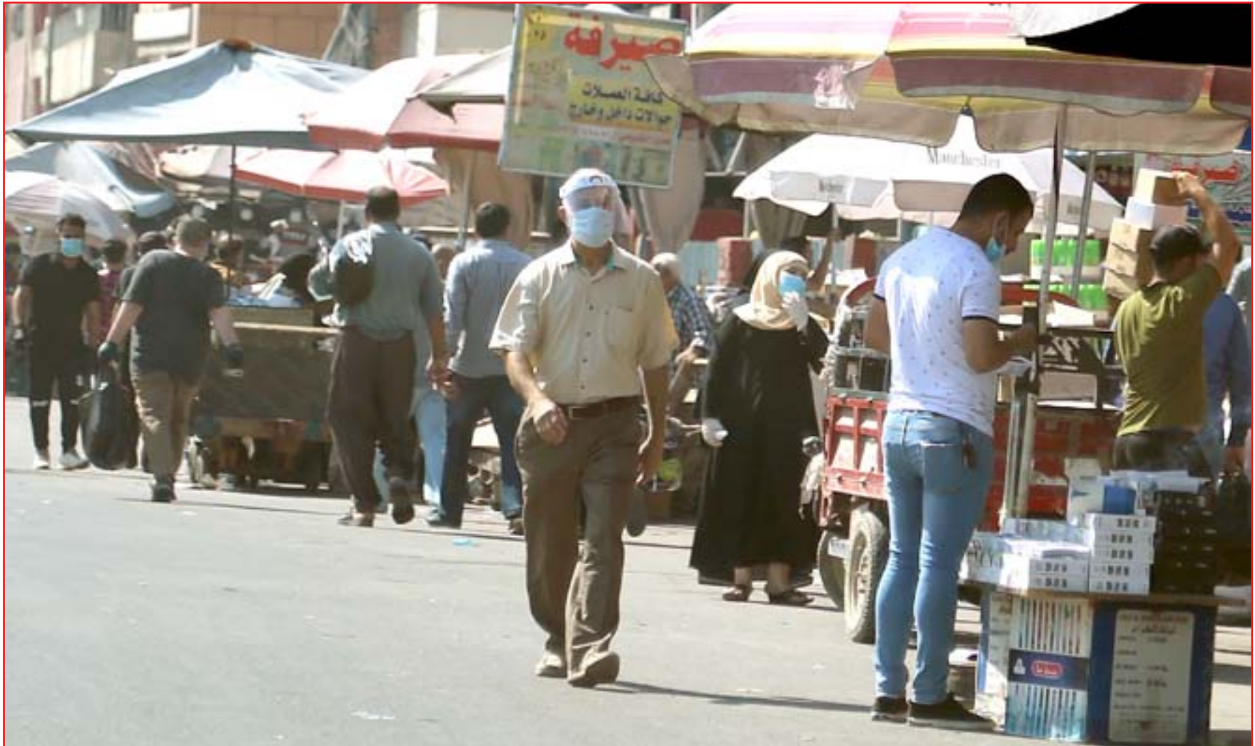
الالتزام بالارشادات الصحية للبس الكمامة ..