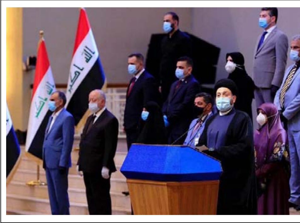
جانب من اعلان التحالف الجديد قبل يومين

في الفترة المقبلة هي تمكين منهج الاعتدال لدعم الاستقرار السياسي وإبعاد العراق عن التخندق الإقليمي والصراعات، وكذلك التأكيد على إجراء انتخابات برلمانية مبكرة نزيهة وعادلة، ودعم جهود الإصلاح والتخلص من الآثار التوافقية غير المجدية المعطلة لمسار الإصلاح والبناء".