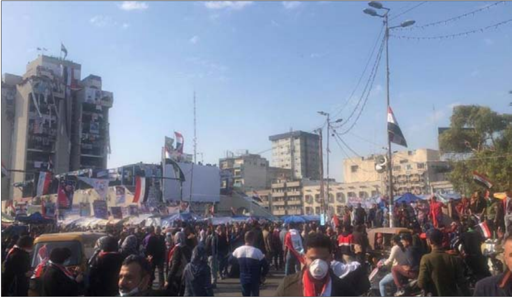
متظاهرون في ساحة التحرير.. ارشيف

وفي الايام الاخيرة من شهر حزيران الفائت، بدأت صفحات على منصات التواصل الاجتماعي التحشيد الى تظاهرات كبيرة قرب المنطقة الخضراء، في الاول من تموز لدعم اجراءات الحكومة لمنع فوضى السلاح. وفي ليلة الجمعة الماضية، خرج عدد من متظاهري ساحة التحرير، على قلة اعداده، في مسيرة مؤيدة لاعتقال عدد من المسلحين المتهمين بهجامة مطار بغداد والمنطقة الخضراء وبعض المعسكرات العراقية.