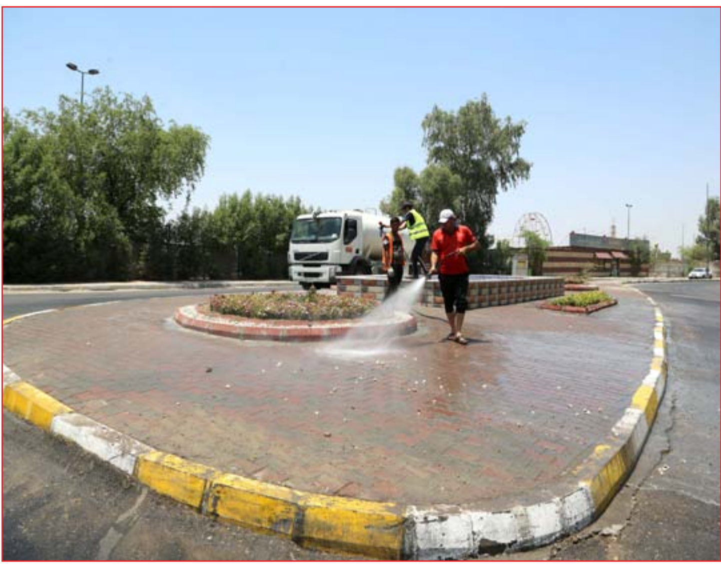
عمال أمانة بغداد يستغلون حظر التجول لتنظيف شوارع بغداد ..