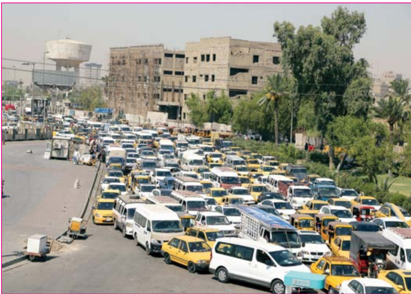
اختناقات مرورية تملأ شوارع العاصمة بعد يوم من استهداف الخضراء...

6 فالح الحمراني يكتب: مكائنة العراق في ظل الأزمات العالمية المستفحلة