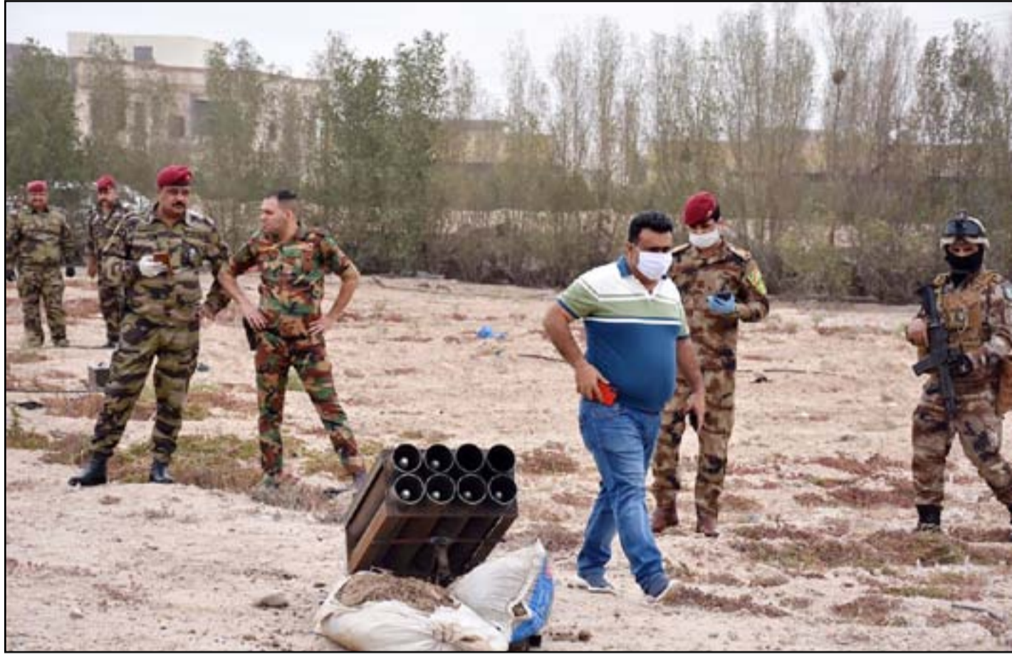
منصة استهدفت المنطقة الخضراء... ارشيف

مع قرب استئناف الحوار الاستراتيجي بين بغداد وواشنطن، عادت ما تعرف بـ "جماعات الكاتيوشا" لاستهداف المنطقة الخضراء وسط العاصمة بالصواريخ. بالمقابل حاول بعض المتظاهرين، اقتحام المنطقة الحكومية للوصول الى السفارة السعودية، تنديدا بما اعتبروه اساءة للمرجع الاعلى علي السيستاني.