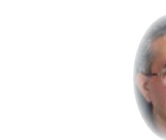
د. مهند البراك

واجترارها، فوزير الثقافة يدعى إصابته (كذباً) بكورونا ، ثم يواجه الفايروس ويعقد معه إتفاقيه سياسية خطيرة ، مضونتها (النهار لي ، و الليل لك) ، لكي يشيع ثقافة الشجاعة و المواجهة مع الفيروسات ، و هذا الدور موكل لخطط وزارة الثقافة التي تساعد بنشر الوعي الصحي بين المجتمع، و الخطاب المسكوت عنه يكشف أن شر البليّة ما يضحك (والحمد لله) على الثقافة . وكشفت لنا كورونا عن وجه سياسة وزارة الصحة التي تؤدي عملاً دعائياً وترويجياً لقائد تيار سياسي ، إذ قام السيد رئيس الوزراء بافتتاح مشفى (السندويج بيتل) الذي تبرع به (السيد) وتجاره ، على الرغم من أنهم كانوا سبباً في تفشي النعمة (والحمد لله) ، في حين أن جهات أخرى قامت بالعمل نفسه أو أفضل منه ولم توجه إليهم كلمة شكر (والحمد لله)، ويطول الحديث في مجال الصحة ، فقد كشفت لنا كورونا أن أحد الأحزاب ذا الجناح المسلح المعاند يسيطر على استيراد الأدوية ، وقد أنحمت خزائن قائده بملايين الدولارات من قومسيونات الشركات ، و الخاوات