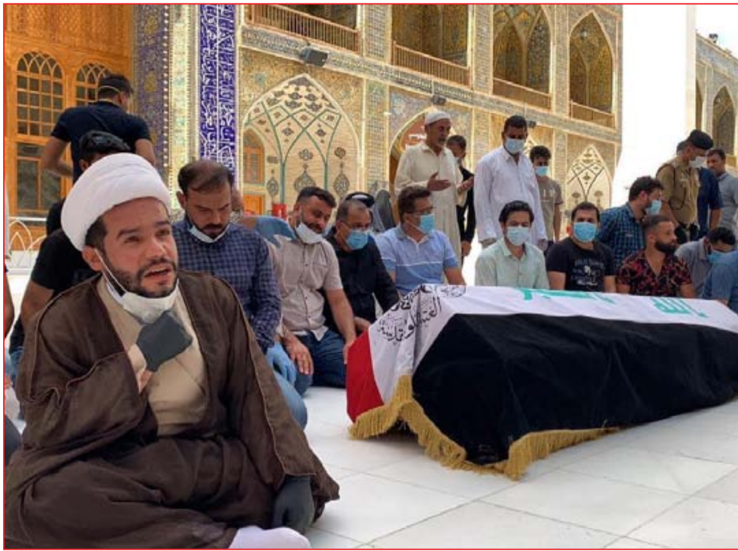
جثمان الهاشمي يوارى الثرى في مقبرة وادي السلام ..