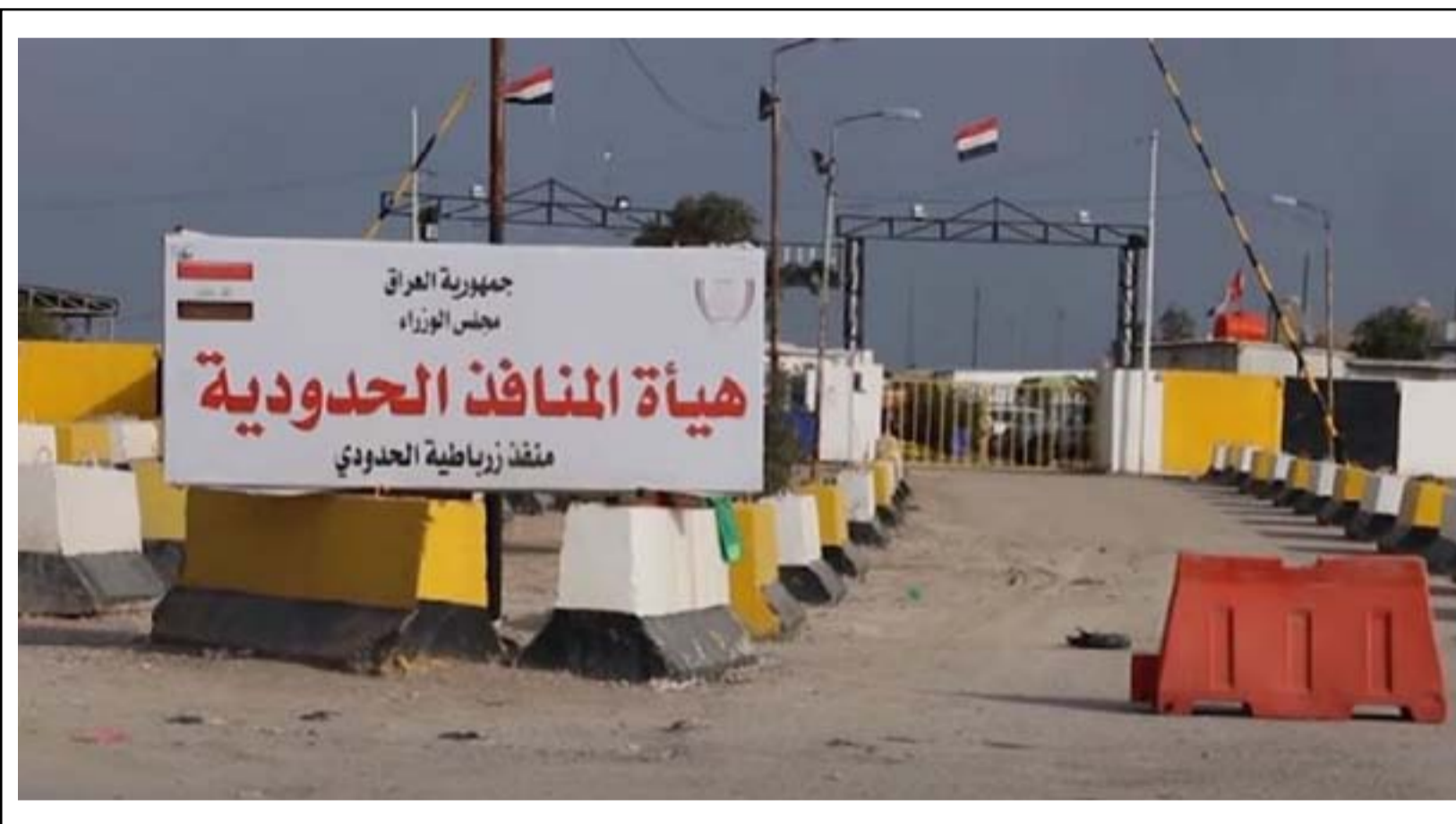
منفذ زرباطية مغلق بسبب فايروس كورونا

وأشارت إلى أن التعاون المشترك وتنفيذ سير المعاملات الكمركية وفق الضوابط والتعليمات كان له الأثر الإيجابي في زيادة الإيرادات المتحققة من عملية الحركة التجارية المتوجهة نحو تعظيم موارد الدولة ودعم الموازنة الاتحادية في ظل الظروف المالية والاقتصادية الراهنة، مع الأخذ بنظر الاعتبار دعم المنتج والصناعة المحلية والالتزام بالتعليمات الصادرة وفق الروزنامة الزراعية ومحاربة سياسة إغراق السوق بالمنتجات غير الضرورية لضمان استقرار الأسعار في الأسواق المحلية". وبيّنت أن الارتفاع الحاصل في نسبة الإيرادات المتحققة في المنافذ الحدودية جاء بالرغم من إغلاق المنافذ الحدودية البرية مع الجارتين إيران والكويت بسبب جائحة كورونا وكذلك قرار تصفير الرسوم الكمركية للمواد الغذائية والصحية والزراعية وكل المواد المعنية بمكافحة وباء كورونا المستجد.