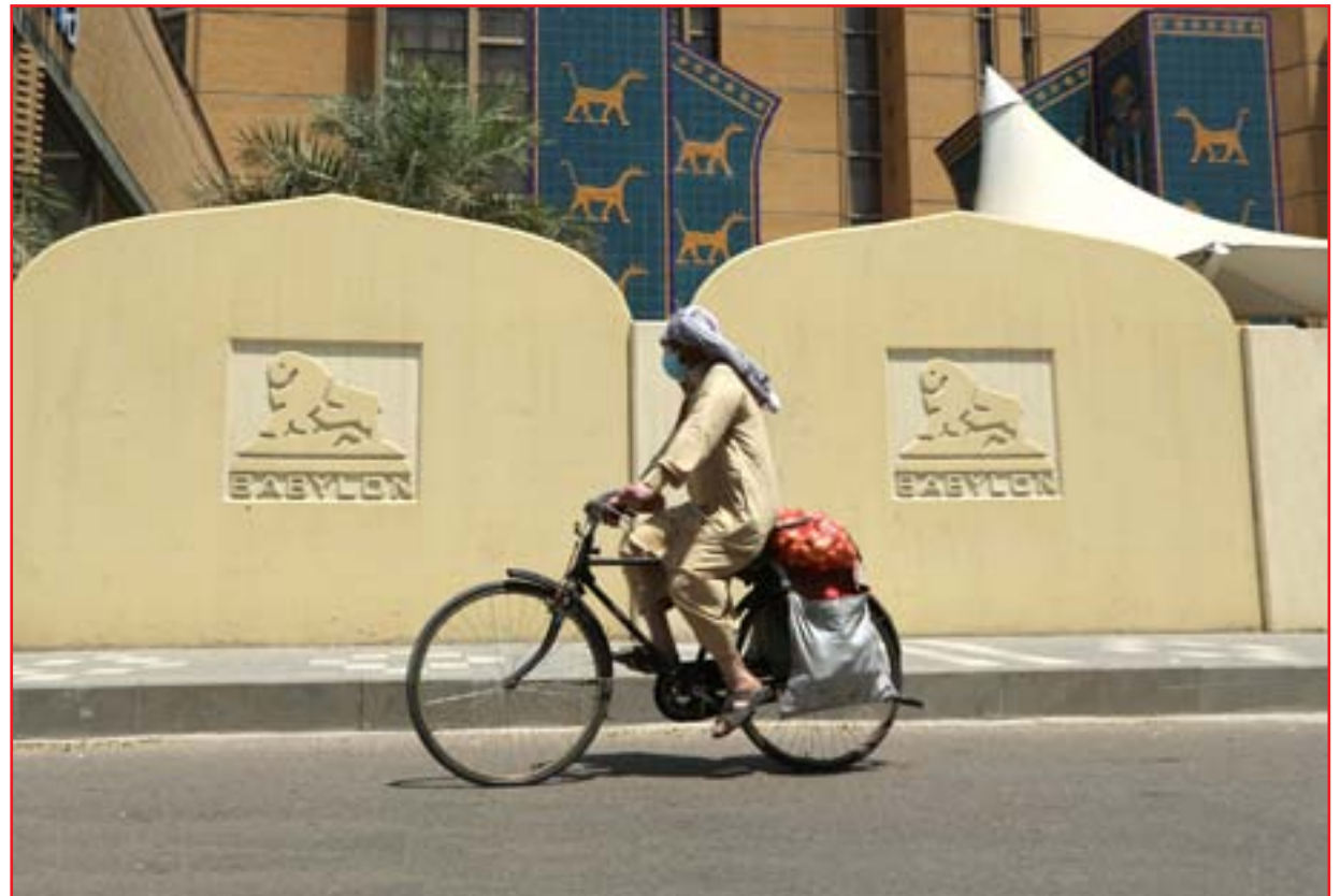
مسن يتبضع بـ"البيسكل" بسبب اجراءات حظر التجوال .. عدسة: (محمود رؤوف)