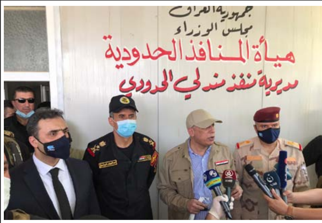
الكاظمي في منفذ منذلي أمس

ويضيف أن "إحكام السيطرة من قبل القوات الأمنية على هذه المنافذ ستكون بمثابة مقدمة بالتوجه إلى باقي المنافذ الحدودية وضبطها وتأمين دخول عائداتها إلى خزينة الدولة".