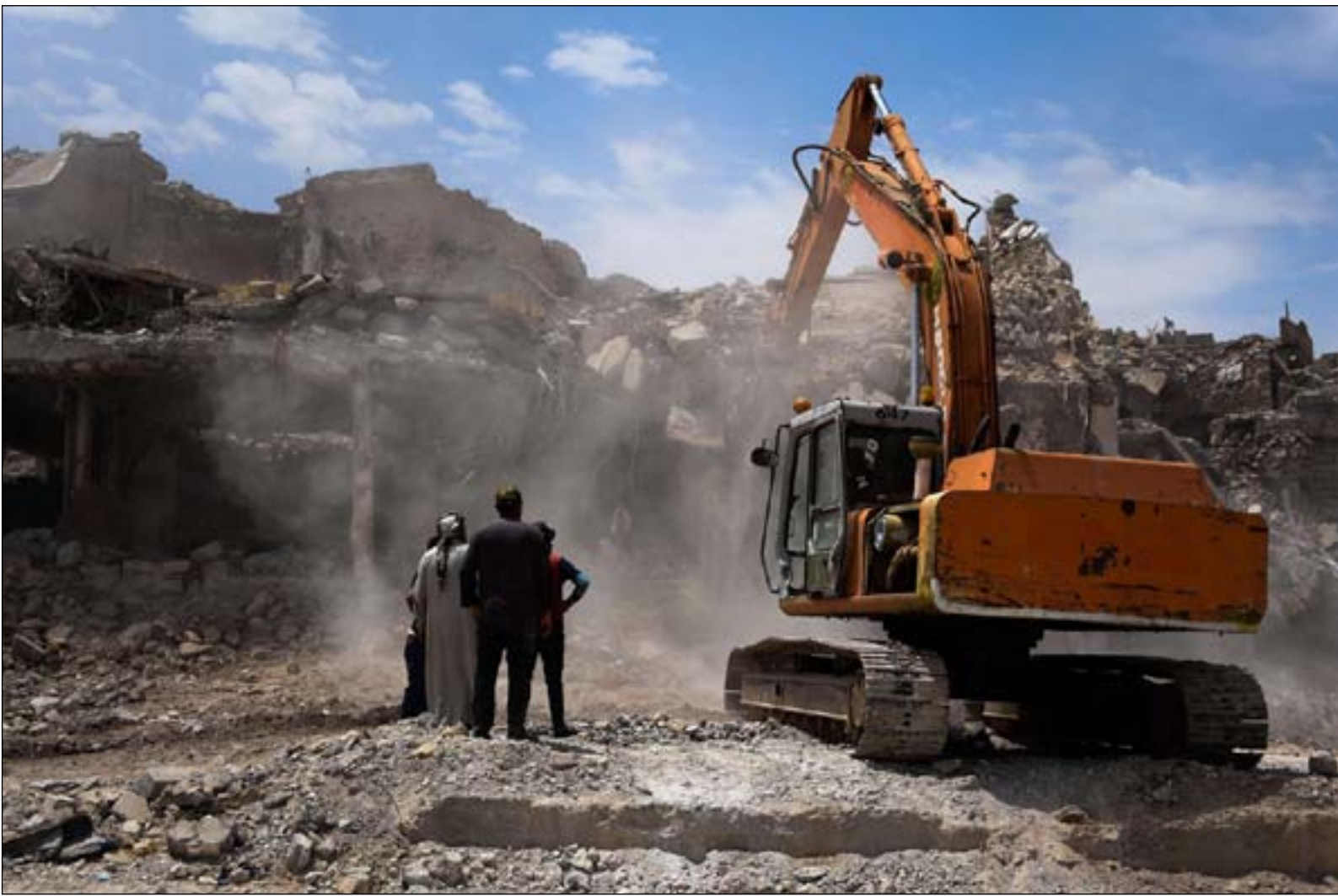
الدمار ابرز معالم الموصل بعد ثلاث سنوات من التحرير

وقال الجبوري في حديث متلفز، عن الذكرى الثالثة لتحرير الموصل، ان "كل من يزور الموصل يتفاجأ بما وصلت اليه من انجاز مشاريع وخدمات وفي كل احيائها"، مشيرا