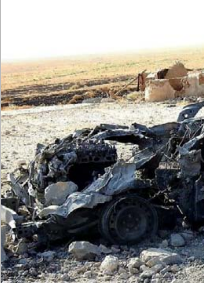
قوة عسكرية قرب حمرين.. ارسيف

والى الجنوب من مناطق العمليات، قتلت القوات الامنية خمسة انتحاريين بعد محاصرة وكر لهم غربي بغداد، مؤكدة مقتل مقدم وإصابة جندي أثناء العملية. وجرت العملية في منطقة ترتبط مع الفلوجة وعامرة الفلوجة، حيث كانت "الزيدان" التي جرى فيها الحادث، التابعة لقضاء ابو غريب نحو 20 كم غرب بغداد - مسرّحاً لهجمات "داعش" قبل 6 سنوات.