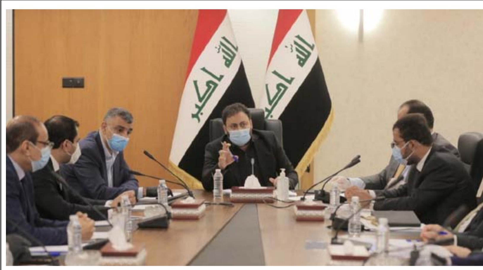
جانبا من اجتماع برلماني ناقش ملف الطاقة أمس

وقال العاني في تدوينته: إن "من حق الناس أن تعرف أين ذهبت ٤٠ مليار دولار على الكهرباء ومازالت يعاني الظلام والقيظ والمرض بينما المسؤولون عن ملفات فساد الكهرباء يسعون بالأضواء والتبريد والراحة". وأضاف "تساند خطوة رئيس مجلس النواب بفتح ملفات فساد الكهرباء منذ عام ٢٠٠٣ والتحقيق فيها"، خاتماً كلامه بـ: "العراق بدون كهرباء".