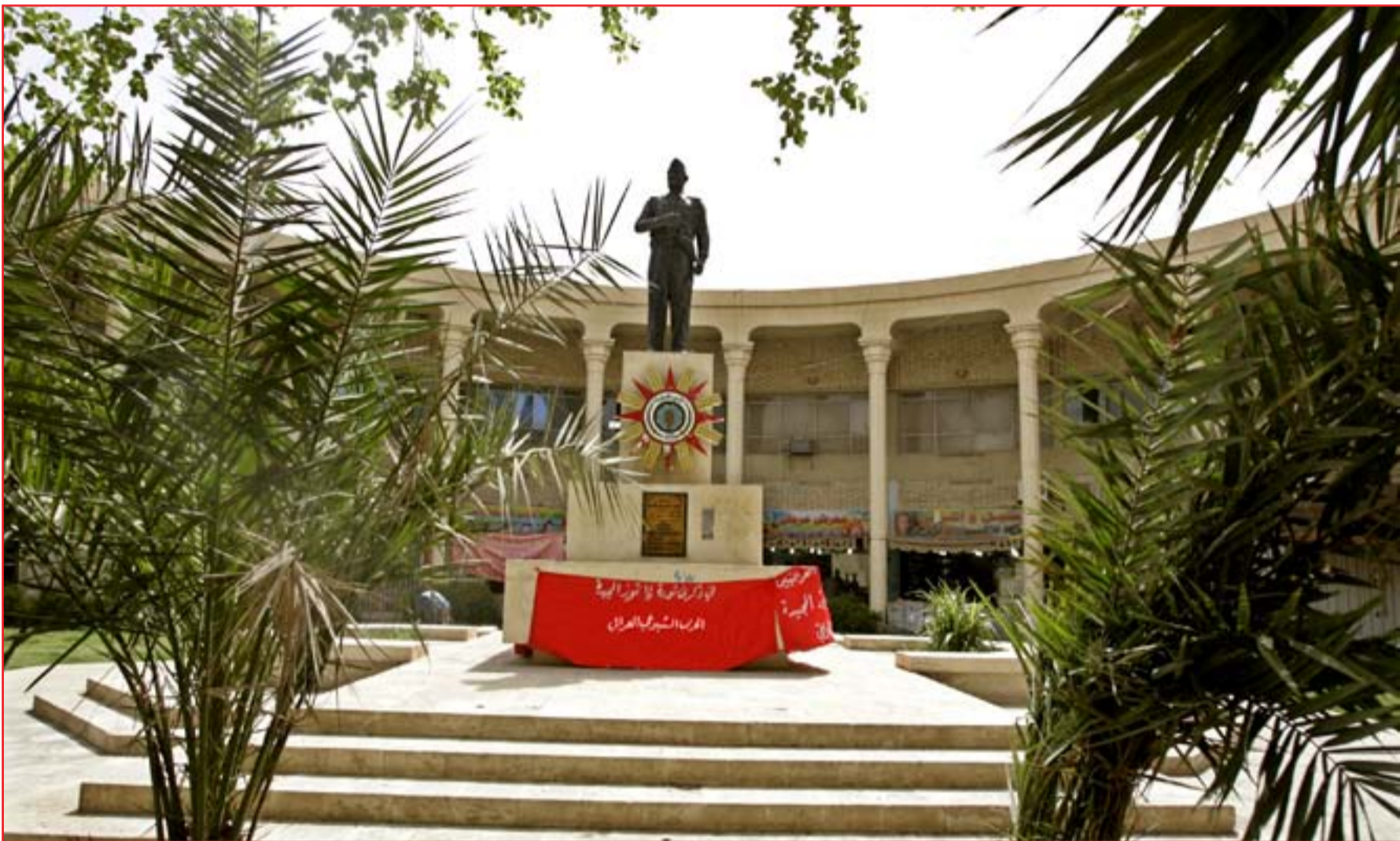
العراقيون يستنكرون عبد الكريم قاسم في الذكرى الـ ٦٢ لثورة ١٤ تموز..