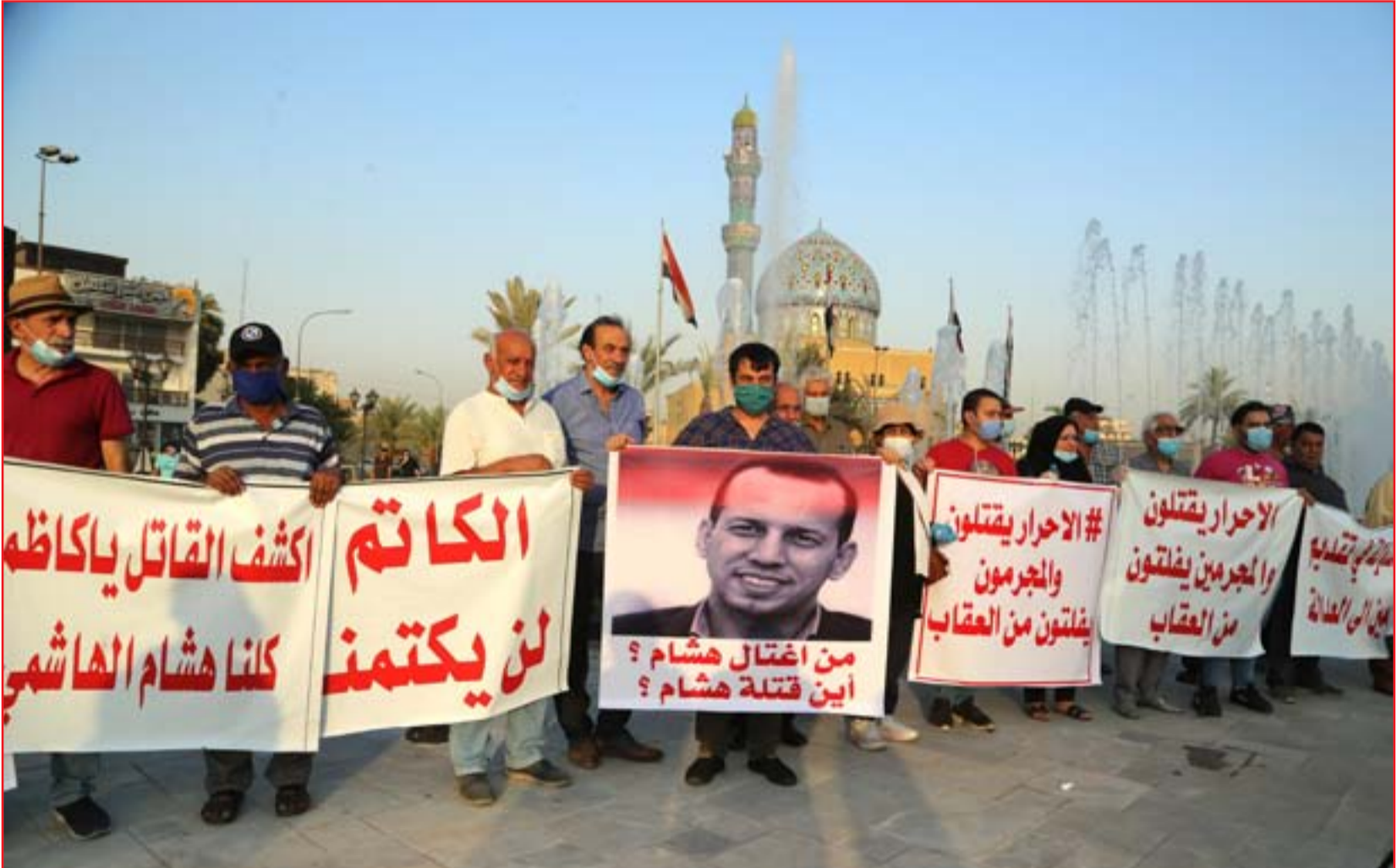
وقف في ساحة الفردوس طالب بالكشف عن قتل الناشطين والمتظاهرين ..

ويحدث رحيم العبودي، عضو الهيئة العامة لتيار الحكمة في تصريح ل(المدى) أن "التعديلات التي جرت على أجندة زيارات رئيس الوزراء الخارجية هي من غيرت مواعيد زيارته إلى الولايات المتحدة الأمريكية والمقرر