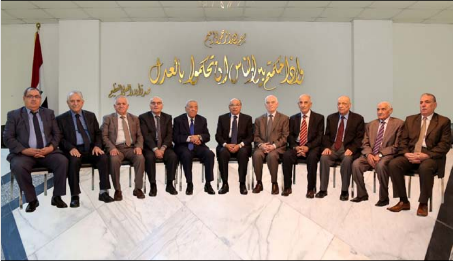
أعضاء المحكمة الاتحادية

وقضت المحكمة الاتحادية العليا بعدم دستورية المادة (٣) من قانونها رقم (٣٠) لسنة ٢٠٠٥ التي تخول مجلس القضاء صلاحية ترشيح رئيس وأعضاء المحكمة، مطالبة من مجلس النواب بتشريع مادة بديلة تتفق مع أحكام الدستور. وكان مجلس القضاء الأعلى أبدى في يوم ٢٢/١/٢٠٢٠ اعتراضه على تعيين القاضي المتقاعد من محكمة