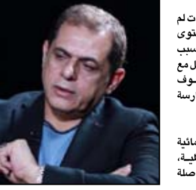
الكتاب والتلفزيون ومواقع التواصل الاجتماعي اليهم كان الأقرب إليك؟