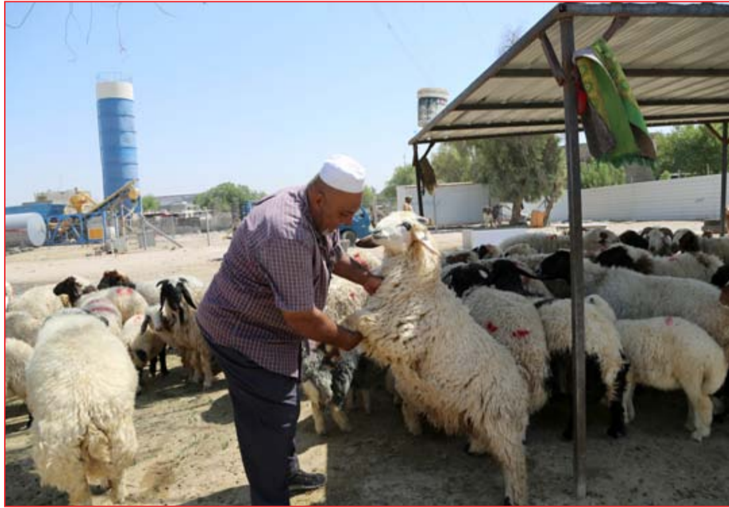
حظر التجوال وتفشي كورونا يُعيد ممارسات وطقوس العيد عند المسلمين ..