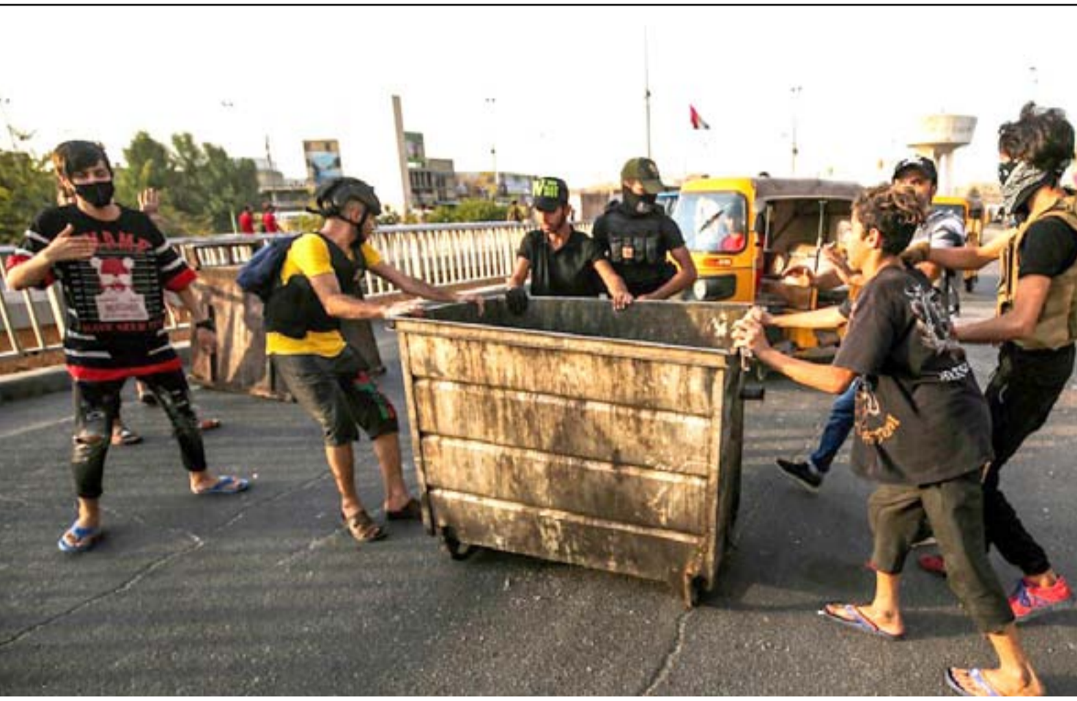
محتجون في ساحة التحرير .. أرشيف

بعد ليلتين من المصادمات الدامية بين متظاهرين وقوات أمنية في ساحتي التحرير والطيران وسط بغداد، عاد هدوء حذر إلى الساحة المركزية للتظاهرات في العاصمة، فيما تم اختطاف متظاهر في شرقي بغداد. وعلى النقيض من ذلك استمر التصعيد في مدن الوسط والجنوب، وبدأ متظاهرون غاضبون بغلاق طرق حيوية ومحطات للطاقة احتجاجاً على سوء تجهيز التيار الكهربائي، فيما حدثت مصادمات مع قوات الأمن.