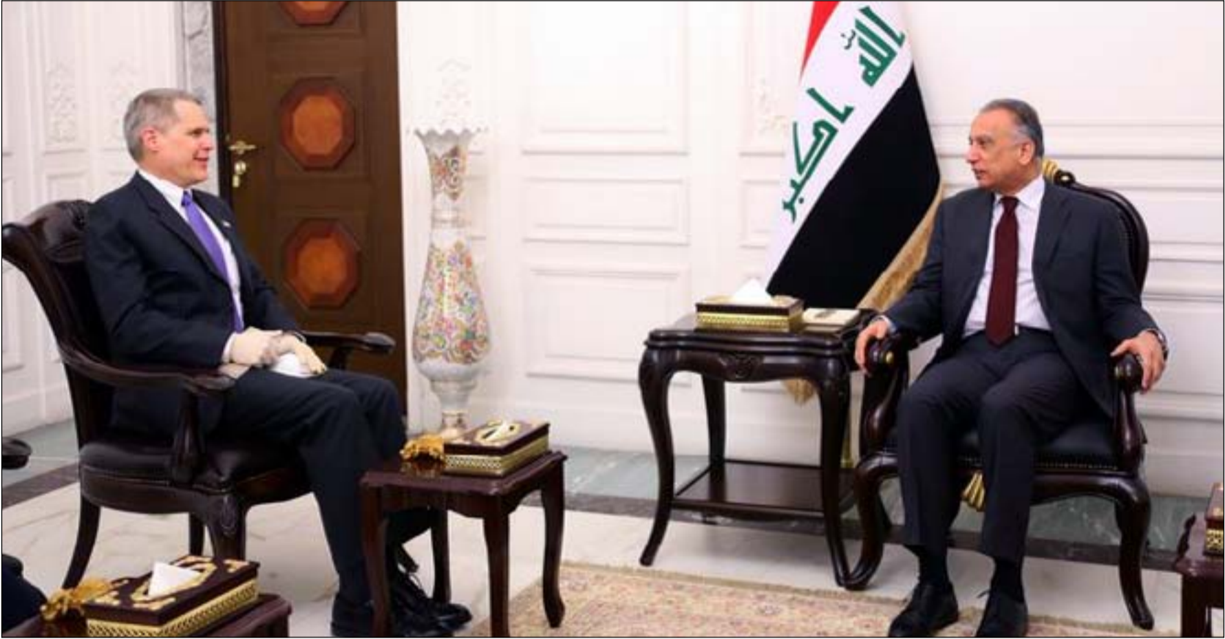
الكاظمي خلال لقائه السفير الأميركي... أرشيف

سيكون عالي المستوى برئاسة رئيس مجلس الوزراء وعضوية وزراء الخارجية والمالية والتخطيط وبعض الوزراء الآخرين وقيادات أمنية وعسكرية، مشيرا إلى أن الوفد العراقي سيطلب تعديل كامل للاتفاقية الاستراتيجية الموقعة في العام ٢٠٠٨ بين العراق والولايات المتحدة الأمريكية. ويضيف عضو الهيئة العامة للتيار الحكمة أنه "من ضمن هذا التعديل ستكون هناك آلية لإخراج القوات الأمريكية بوضع جدول وسقف زمني مع وجود فقرة لمراجعة أداء الطرفين وتقييمه له للجدالات الأمنية والاقتصادية والصحية من أجل خلق مناخ مناسب لأداء الانتخابات البرلمانية المبكرة"، مؤكدا أن "الإنفاقية ستكون ذات سقف زمني يمتد بين سنة إلى خمس سنوات، وستخضع للتقييم بشكل دوري". ويتابع العبودي أن "مقابل هذه التعديلات المرتقبة على الاتفاقية ستدخل أكثر من عشر شركات أمريكية كبرى في مجال الاستثمار"، كاشفا أن "الحوارات التي ستنتقل في العشرين من آب المقبل سيحضرها رئيس شركة جنرال إلكتريك المتخصصة بالطاقة لتحديد مواعيد وسقوف زمنية للنفوس بواقع الطاقة في العراق".