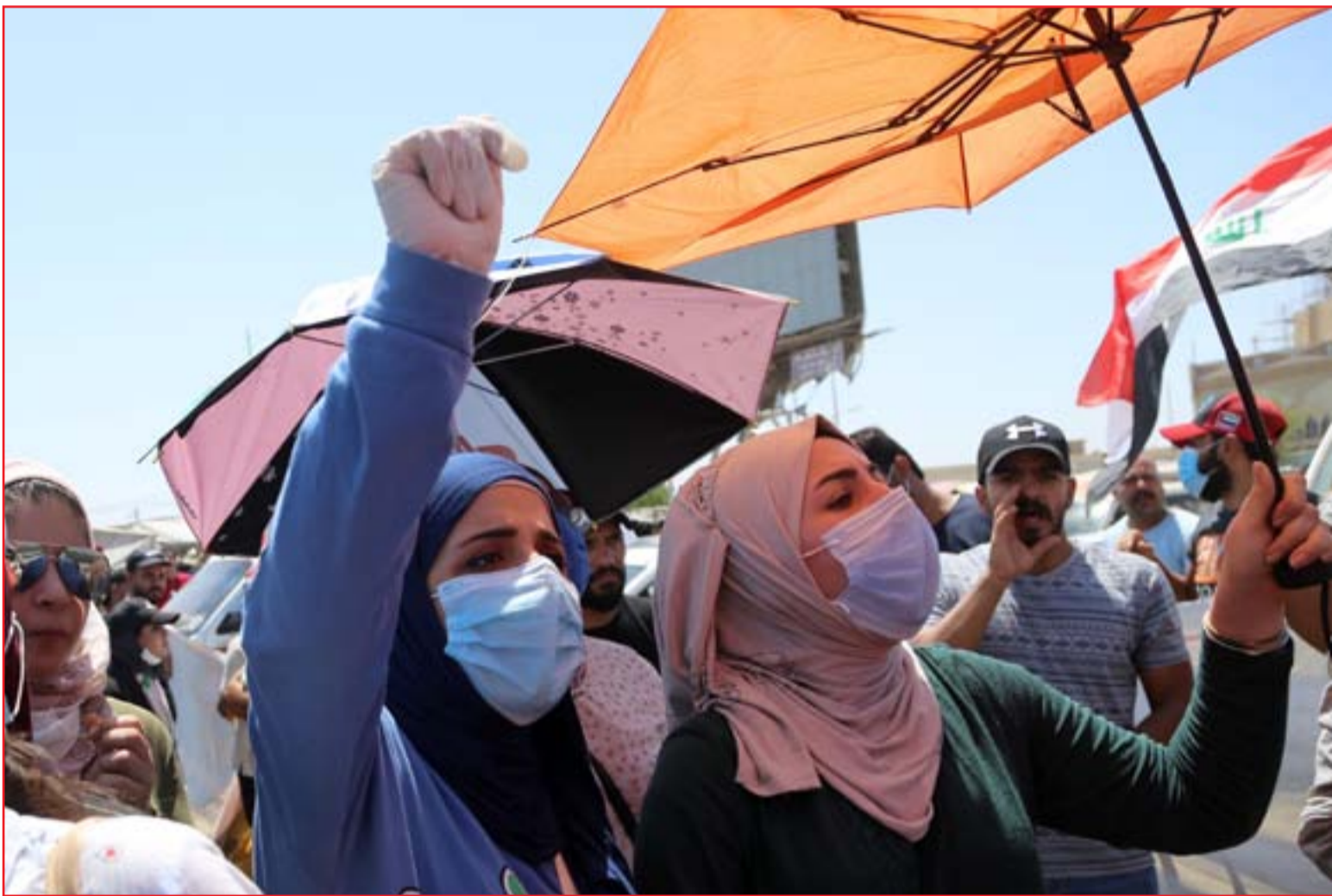
متظاهرون في منطقة الغلاوي أمس..

وأشار البيان الى انه "تم إنجاز إجراءاتها الكمبركية وفق الضوابط والتعليمات النافذة، وتنظيم محضر إخلاء أصولي من قبل مديرية منفذ أم قصر الشمالي / هيئة المنافذ الحدودية والجهات الأمنية والدوائر العاملة في المنفذ الحدودي".