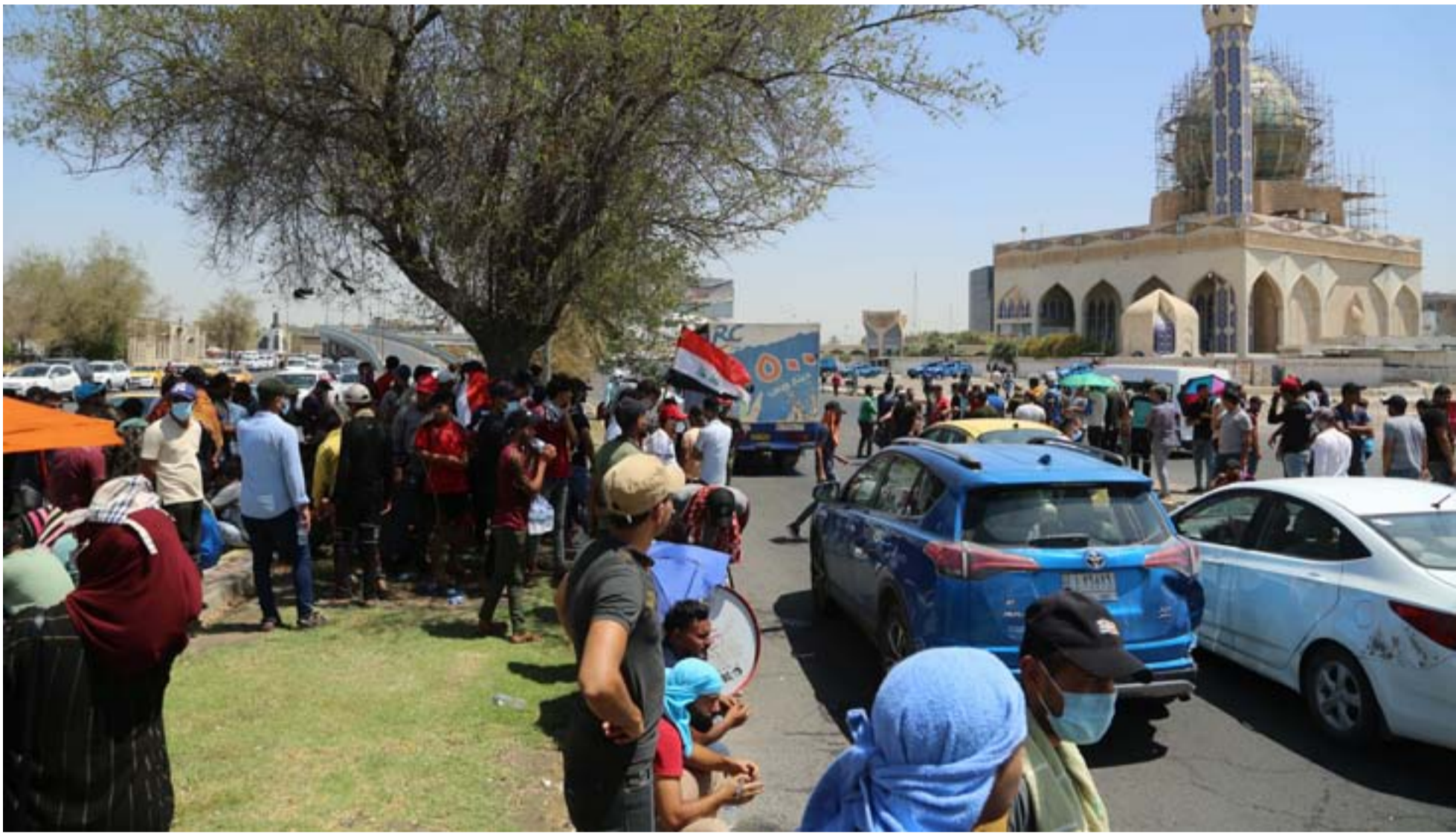
متظاهرون في منطقة العلابي أمس .. عدسة: محمود رؤوف