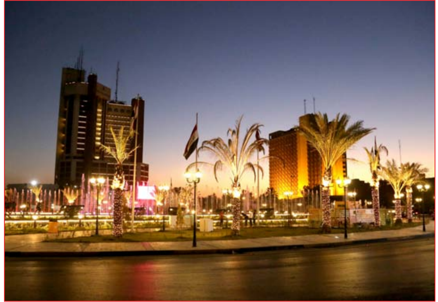
ساحة الفردوس بعد العاشرة مساءً ..

أمر القائد العام للقوات المسلحة مصطفى الكاظمي، أمس الاثنين، بإقالة قائد شرطة البصرة الفريق الركن رشيد فليح على خلفية الخروقات الامنية الاخيرة. وذكر مصدر حكومي ان "القائد العام للقوات المسلحة أمر بإقالة قائد شرطة البصرة رشيد فليح". وفي تطور لاحق، اعلن اللواء يحيى رسول الناطق باسم القائد العام للقوات المسلحة، تكليف اللواء عباس ناجي بديلاً عن فليح، واللواء عباس ناجي كان يشغل منصب معاون قائد الشرطة. وفي سياق متصل اعفى الكاظمي مدير الامن الوطني في المحافظة. وجدد عشرات المتظاهرين، أمس، مطالبتهم بإقالة المحافظ