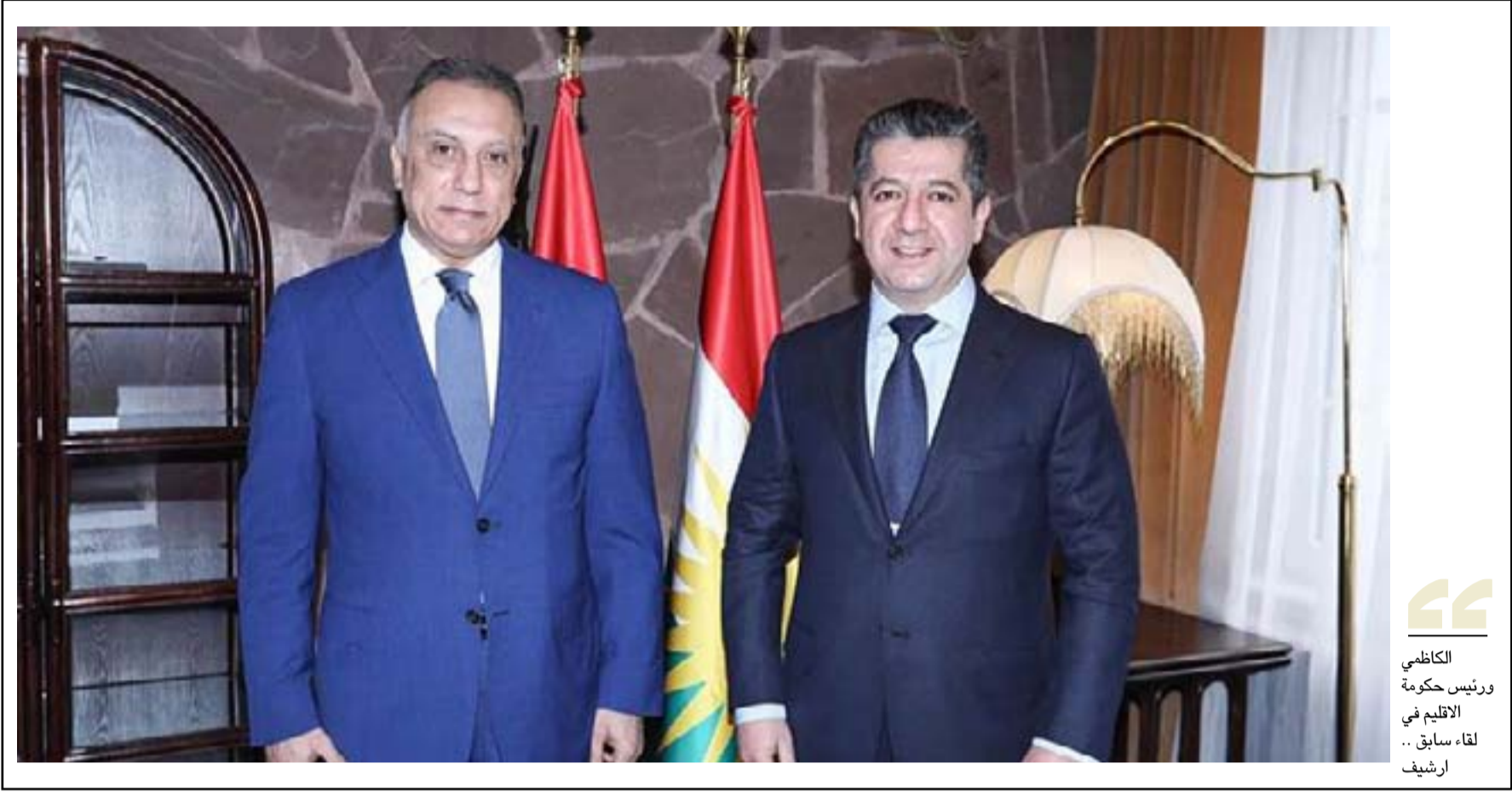
الكاظمي رئيس حكومة الاقليم في لقاء سابق..