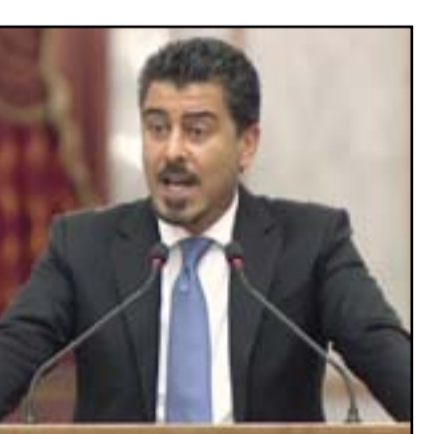
□ بغداد / المدى