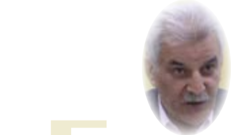
■ الدكتور باقر الكرباسي

إن الموضوعات المثارة تضيف رؤى جديدة الى المشاريع الوطنية ومنها المشروع الوطني الديمقراطي المستند الى تطور الدولة الوطنية وتشكيلتها الاجتماعية المعبر عن بالوطنية الديمقراطية الهادفة الى التطور الديمقراطي المستقل والتنمية الوطنية.