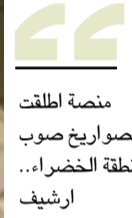
منصة أطلقت الصواريخ صوب المنطقة الخضراء... ارشيف

بعد ساعات من مغادرة رئيس الوزراء مصطفى الكاظمي، بغداد متوجهاً الى واشنطن، أعلنت فصائل مسلحة استهداف مطار بغداد - الذي انطلق منه الأخير في سفرته - بصاروخ كاتيوشا. وهذه الفصائل المعروفة بـ"جماعات الكاتيوشا"، كانت قد وسعت عملها منذ شهر تقريباً، باستهداف أرتال الدعم اللوجستي للقوات الاميركية على الطرق السريعة، ونفذت خلال الاشهر الثلاثة الماضية أكثر من ٣٠ هجوماً على شاحنات ومواقع عسكرية ودبلوماسية.