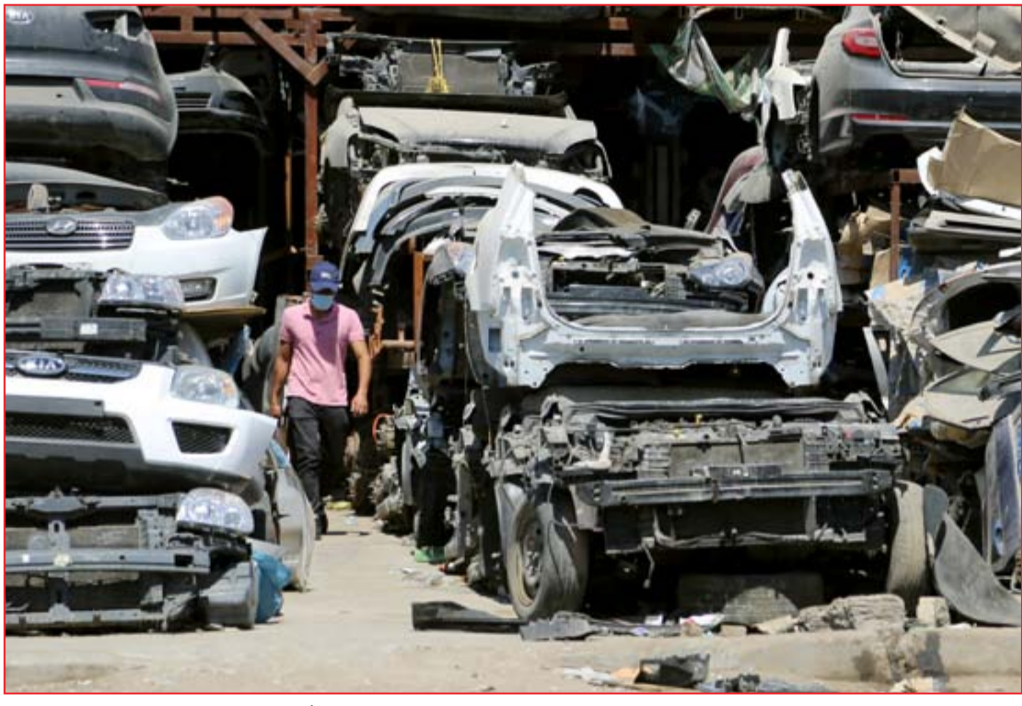
مقابر السيارات تُغلق الأرصدة في الأحياء الصناعية .. (عسدة: محمود رؤوف)