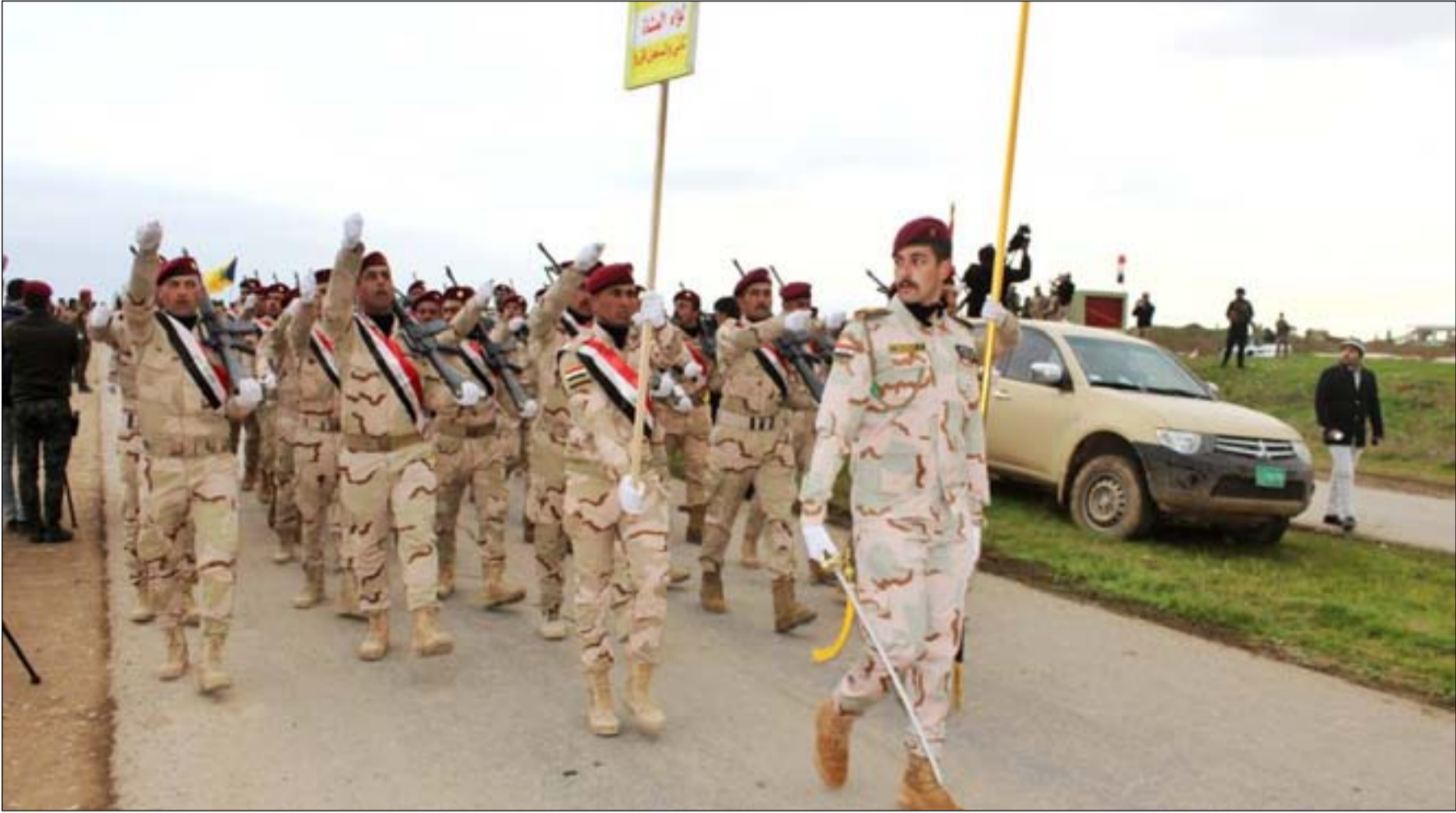
جنود خلال استعراض عسكري.. ارفشيف

ويضيف النائب عن كتلة الفتح أن القانون يقضي على البطالة التي يعاني منها الكثير من الشباب، مقترحاً منحهم رواتب تصل إلى ٢٥٠ ألف دينار شهرياً تماشياً مع الأزمة المالية التي يمر بها العراق. ويتابع: "هناك عدة مقترحات وطلبات ومناشدات وصلت إلى لجنة الأمن والدفاع البرلمانية تطالب بإعادة العمل بالتجنيد الإلزامي، مبيناً أن هذه المناشدات قدمها عسكريون ومستشارون وكتل سياسية ومواطنون". بالمقابل قال رئيس لجنة الأمن والدفاع النيابية، محمدرضا آل حيدر، في تصريح صحفي إن إرادات سياسية تعارض