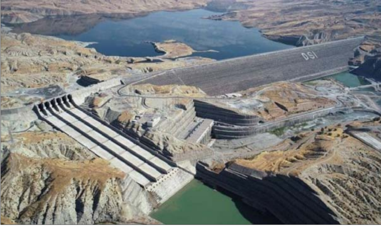
لقطة جوية لسد اليسو