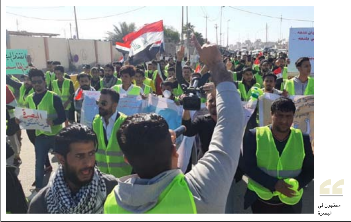
محتجون في البصرة

كبدية، تنازلت عن البعض منها مقابل ٢٥ مليون لكل قضية، بحسب ناشطين في البصرة.