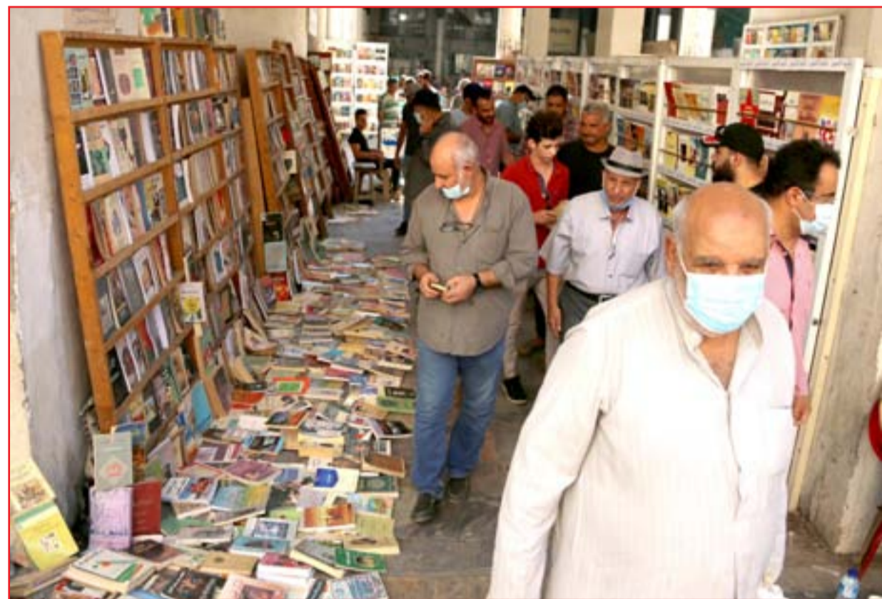
شارع المتنبي يستعيد لقه مع رفع حظر التجوال .. عدا: (محمود رؤوف)

نهرى دجلة والفرات بانها مثمرة واجابيه، مبينة أنها اقترحت على الأتراك منح شركائهم تنفيذ ثمانية مشاريع عملاقة في العراق. وفي ذات السياق اتهمت الوزارة الجانب الإيراني بأنه "غير متعاون" معها لحل مشكلة شح المياه في نهرى دجلة والفرات بانها مثمرة واجابيه، مبينة أنها اقترحت على الأتراك منح شركائهم تنفيذ ثمانية مشاريع عملاقة في العراق. وفي ذات السياق اتهمت الوزارة الجانب الإيراني بأنه "غير متعاون" معها لحل مشكلة شح المياه في