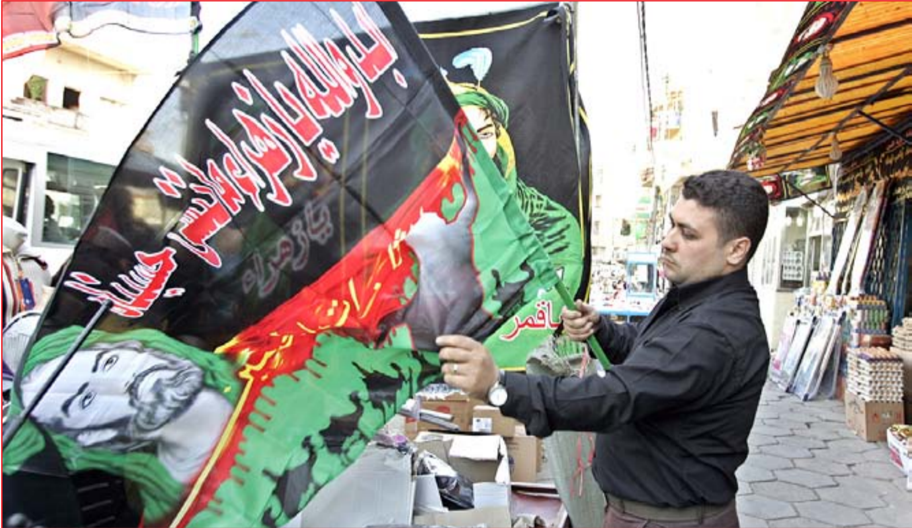
رايات عاشورا تملأ الأسواق...