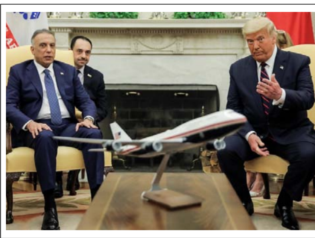
الكاظمي خلال لقائه ترامب قبل أيام

لكنه لم يُحل أي شخص في البصرة إلى القضاء على جرائم القتل.