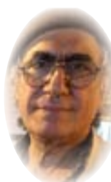
■ رشيد الخيون

حسن البنا(اغتيال1949): «خلصونا من الخاندار،(كامل، في نهر الحياة)، فأغتيال الخاندار(1948)، من قبل الجهاز الخاص، ولدعياش» أجهزة خاصة بالقتل، يقودها "أمرء الدم" . هكذا، يتم اغتيال أروع الناس المغتالين من أجل ماء نظيف، ووطن آمن، لا تبقى فيه الديمقراطية كذبة. يُقتل هؤلاء بتمهيد لدعياش، عبر برامج فضائيات الأحزاب الدينية وإعلامها، عبر خطبة وقذف، أو مقال يُنشر خارج الحدود ويحذر من «الجواسيس» للأميركان، عبر التثقيف بكتيب «دليل المجاهد» لأول ولي فقيه لحزب «الدعوة الإسلامية». اعتبر «عياش» الطيبية رهام يعقوب(جاسوسة)، وهي ليست أخصر المغتالين والمغتالات، بسلاحه الذي يجب علانية بالبصرة وبغداد، جنوبي العراق ووسطه متطاباً شرء، مع أن رهام لم تسلم «سيف ذي الفقار» لوزير الدفاع الأميركي، الذي أشعل المأساة ولم يُطفئها، بل الذي أهدى مجسم سيف علي بن أبي طالب، كرم بأفخم المناصب والقصور، ورهام تعرف من أين ينبع مجلة والفترات، وصاحبهم، الذي أهدى السيف، يجهل ذلك، من حقها الضراخ من أجل الماء، لأنها تعرف منيع ومجرب مجلة والفترات، تعرف الفرات نهرًا عراقياً وليس مصرياً، مثلما صرح «عياش»