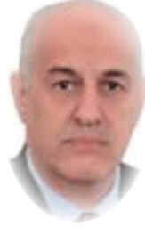
■ القاضي سالم روضان الموسوي

لها حقاً وذلك من خلال نظر دعوى لم تكن تلك الجهة ممثلة فيها والزم الادعاء العام أن يبادر إلى تحريك الدعوى خلال فترة محددة وأرى أن في هذا القرار صياغات غير دقيقة تشير الإشكال عند تطبيقه وفي أدناه نص القرار ومن ثم سأوضح أهم معوقات تطبيقه . قرار رقم 141 لسنة 2002 ( استناداً إلى أحكام الفقرة 2 من المادة الثانية والأربعين من الدستور، قرر مجلس قيادة الثورة ما يأتي: أولاً - 1 - إذا توصل القاضي من خلال دعوى معروضة عليه الى وجود حق للدولة جرى التجاوز عليه أو عدم الوفاء به فعليه إصدار قرار بدعوة الجهة المتجاوز على حقها للمطالبة به -2 على الجهة المتجاوز على حقها إقامة الدعوى للمطالبة به أمام المحكمة المختصة خلال 15 خمسة عشر يوماً من تاريخ تبليغها بقرار المحكمة بدعوته للمطالبة بالحق. 3- لعضو الادعاء العام تحقيق حالة من الحالات المنصوص عليها في الفقرة 1 من هذا البند تحريك الدعوى بالتنسيق مع الجهة مالكة الحق. ثانياً - 1 - يشكل وزير العدل هيئة في مركز الوزارة لدراسة الأحكام الصادرة وفق البند أو لا من هذا القرار لتقوم بعمل القاضي أو عضو الادعاء العام والأثار المالية المترتبة عليه لمصلحة الدولة ورفع توصية بذلك الى وزير العدل -3 يرفع وزير العدل توصية اللجنة إلى ديوان الرئاسة مشفوعة برأيه في تكريم القاضي أو عضو الادعاء العام ثالثاً - لوزير العدل إصدار تعليمات لتسهيل تنفيذ أحكام هذا القرار. رابعاً - ينفذ هذا القرار من تاريخ نشره في الجريدة الرسمية. ) وأرى في هذا القرار عدة إشكالات في الصياغة منها الآتي : 1. انه أشار إلى تحريك الدعوى وفي قانون