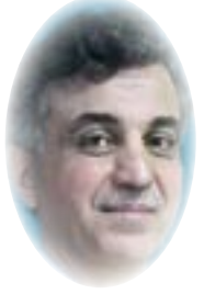
■ فارس كمال نظمي

في 3 تشرين الأول 1932، فقله التاريخ الأكثر حياداً والأقل شحناً بعواطف ما دون الدولة وما دون المواطنة، من بين الأحداث الأخرى، ليكون يوماً جامعاً لفكرة الدولة الفتية الخارجة لتوها من شرنقة التبعية والماسكة بأولي حقوق السيادة. هذا اليوم يمكن أن يحقق اختزاً اصغريا نسبياً لتنازع السرديات، نظراً لرمزيته (نهاية الانتداب البريطاني أي "الاستقلال" حتى وإن كان جزئياً ومتصلاً بقيود مع البريطانيين تنتقص من السيادة آنذاك)، ولعدم ارتباطه بحراك مجتمعي ذي إشكالية مذهبية أو أيديولوجية (ثورة العشرين وثورة 14 تموز)، أو بتخصيص ملك غير عراقي (فيصل الأول)، أو بخيار خلافي يتصل بأزمة تعريف مفهوم "الوطنية" بعد 1920 وبعد 2003. إن هذه الرؤية السيكوسياسية -القابلة للنقاش الخالف- لا تلغي إمكانية الاحتفاء الرسمي أو الشعبي ببقية الأحداث المنكورة قبل قليل أو بعضها تبعاً لقيمتها الموضوعية المؤثرة، إذ يمكن أن تكون جميعاً أجزاءً من الذاكرة السياسية الشرعية المعاصرة للمجتمع والدولة في العراق، بما يرضي جميع الأطراف. إلا أن اليوم/ العيد الوطني - في المرحلة الخلفية الحالية- يُنظر منه أن يمثل المنطقة الصفوية التي تنأى قدر الإمكان عن الأبلجة والتطييف والقومية، وتقترب قدر الإمكان من النماهي بسردية وطنية جامعة. فإعادة بناء هذه السردية في بلد يعاني من أزمة البحث عن معالم ورموزيات مشتركة، يتطلب إعادة تجميع الخيال السياسي والاجتماعي حول قضايا أساسية يكون الخلاف بشأنها أقل ما يمكن، ما يسمح للدولة أن تعيد موضوعة نفسها بوصفها كياناً مختصاً - من بين أشياء أخرى- بتخليص العلاقة سلمياً بين تاريخ المجتمع ومستقبله السياسي.