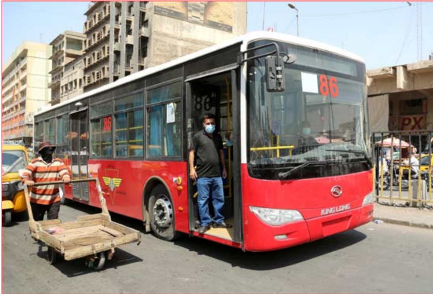
الباص الأحمر يستأنف عمله في بغداد ..

وجه رئيس مجلس الوزراء مصطفى الكاظمي، أمس الأربعاء، بإلغاء التصنيف المذهبي للمتابع للطلبة القبولين في الكلية العسكرية. ووجه أيضاً بأن يلغى هذا التصنيف أينما ورد في كل مؤسسات الدولة، واعتماد التوزيع الجغرافي حصراً في المعلومات المسجلة عن موظفي الدولة. وشدد رئيس مجلس الوزراء على أن تتبعت أجهزة الدولة، والأجهزة الأمنية على وجه الخصوص عن كل ما من شأنه إثارة الفرقة، وزرع أسباب التباعد بين أبناء الوطن الواحد والدم الواحد، مشيراً إلى أن "الدماء التي سالت من أجل التراب العراقي كانت كلها بلون الشهادة والبطولة، ولم تسال عن تصنيفها قبل أن تفتدي العراق الواحد الموحد". بحسب بيان مكتبه، يشار إلى أن عضو مجلس النواب عن محافظة نينوى أحمد الجبوري، طالب، الكاظمي، أمس الأربعاء، بفتح تحقيق بشأن ارفاق حقل المذهب في استمارة قبول الطلاب في الكلية العسكرية. وقال الجبوري في منشور على تويتر إن لجنة القبول لطلاب الكلية العسكرية (دورة 111) وعددهم 250 لم تلتزم بتوزيع المقاعد بعدالة على المحافظات بحسب نسبها: البصرة / صفر، الانبار / صفر، ديالى / 23، القادسية / 15، بابل / 27، ذي قار / 15، نينوى / 8. وطالب النائب عن محافظة نينوى أحمد الجبوري، بفتح تحقيق بهذا الأمر.