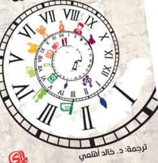
ترجمة: د. خالد أقلمني

بالكتابة، كما يتوقف عند بعض العراقل والصعوبات التي يواجهونها في