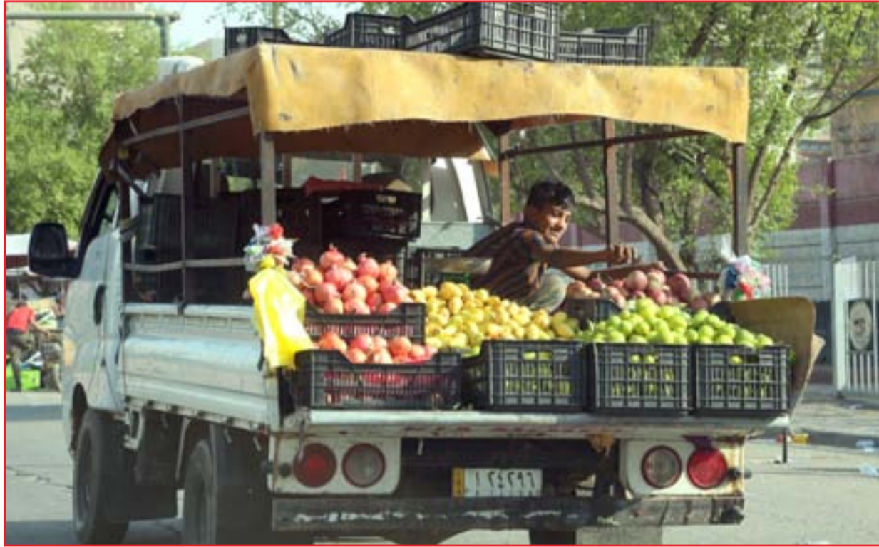
بانع جوال في إحدى مناطق العاصمة..