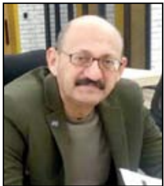
متابعة اخبار الفن وخصوصاً الفن التشكيلي، وانجاز مجلتي (باليت)، ماذا تقرأ خلال الحظر؟ العديد من الاشياء منها مراجعة كتب ومطبوعات متنوعة فنية أدبية. هل يساعدنا الحظر في تحطيم كورونا؟