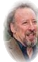
■ بقلم بيتر كورنبلو