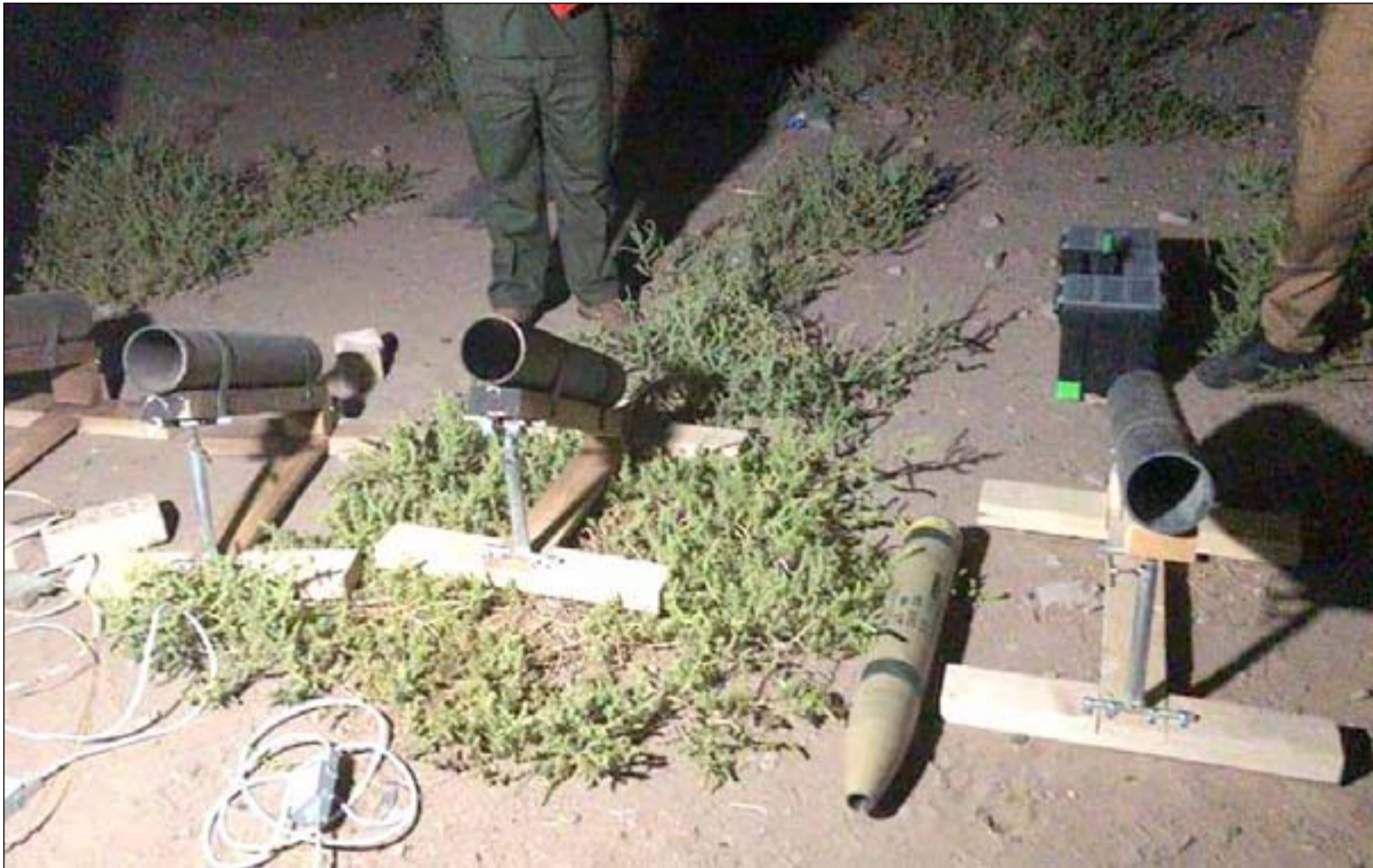
منصة لاطلاق الصواريخ موجهة نحو النقطة الخضراء... ارشيف

استهداف البعثات الدبلوماسية ان "القوى الشيعية والفعاليات الدينية ترى ان هيبة الدولة تحفظ بسلامة الهيئات الدبلوماسية الرسمية". واذاف ان رفض تلك الجهات لضرب السفارات "امر ليس جديدًا، ودايمًا ما تؤكد القوى السياسية على حماية