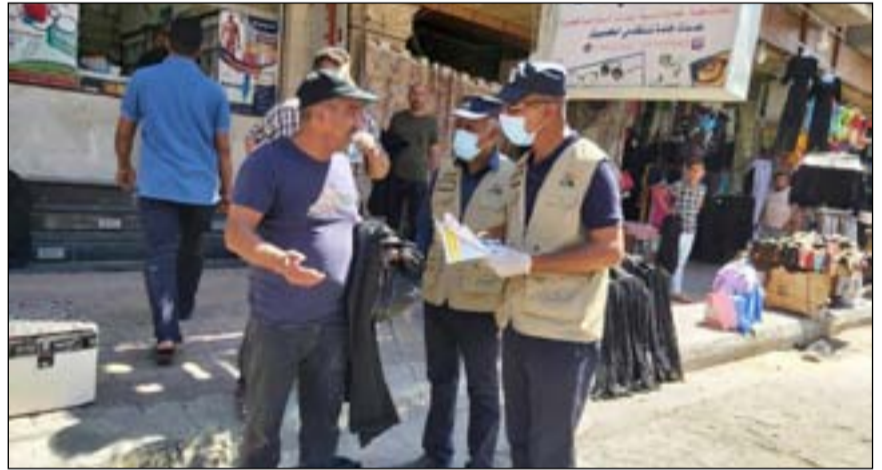
عناصر من الشرطة المجتمعية خلال حملة تقيفية

كما أوضح أن "مئات حالات العنف الأسري تمت إحالتها إلى مديرية حماية الأسرة والطفل في الوزارة ومراكز الشرطة والمحاكم بناء على رغبة المعنف".