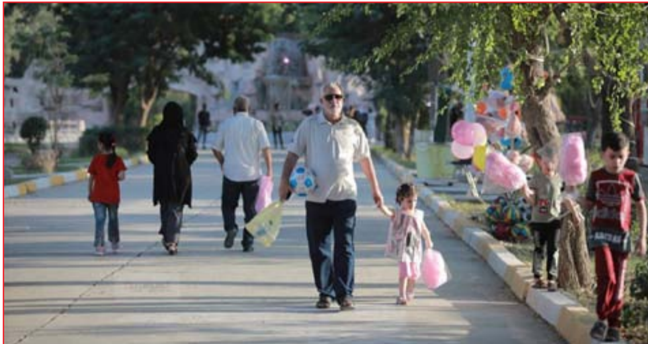
الحياة تعود إلى متزهات بغداد وباقي المحافظات بعد قرار اللجنة العليا للصحة والسلامة الوطنية بافتتاحها مع الالتزام بالتباعد الاجتماعي والوقاية الصحية