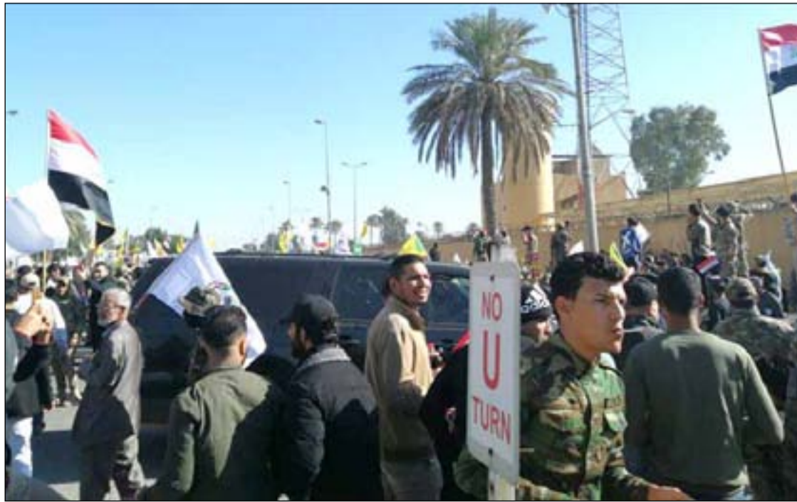
تظاهرة لفصائل الحشد أمام السفارة الاميركية ... ارشيف

موقف العراق يشكل مخاطر محتملة من مختلف الاتجاهات، اذا ما ادت هجمات من