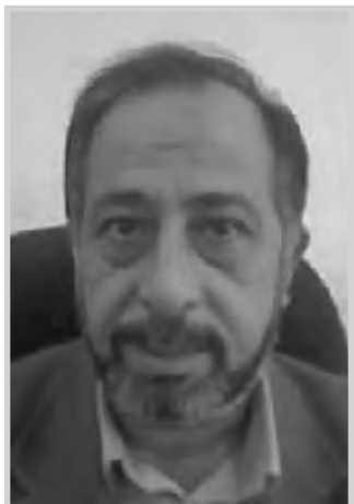
كربلاء / المذبح

بعد أكثر من سنتين لم ير المواطن في كربلاء أي مشروع استثماري جديد يحقق له طفرة نوعية تتجاوز تلك التي تجري على أرض الواقع من تخطيط شارع هنا وصنع جدران هناك، ومن مشاريع أهدمت فيها أطراف عديدة ومنها الدول المانحة والقوات متعددة الجنسية والجانب العراقي بمقاوليه ومسؤوليه. تلك الحقيقة يعرفها من يعمل في لجنة الاعمار التابعة لمجلس المحافظة الذين يؤكدون في كل لقاء إن مجلسهم الجديد لم يتسلم ديناراً واحداً من الحكومة الجديدة، وبالتالي جعلهم هذا الأمر الواقعي جداً أن يلجأون إلى طريقة