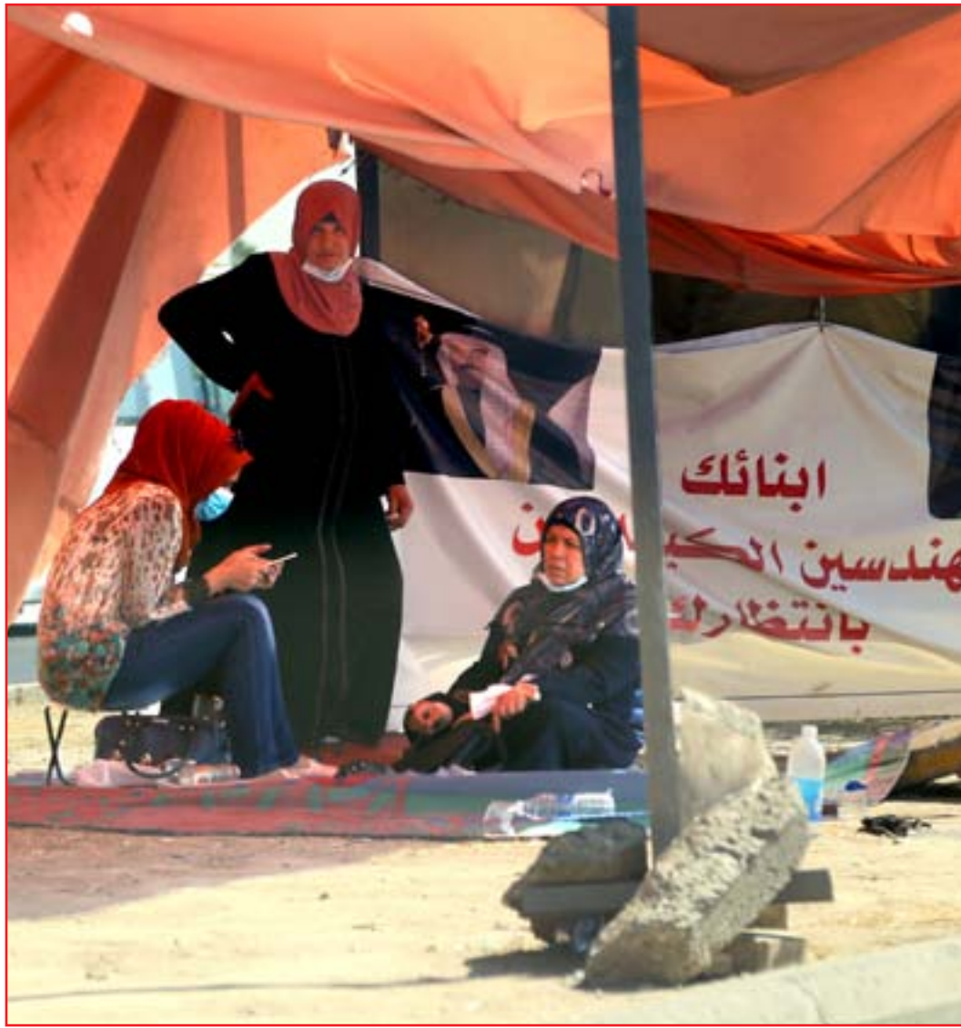
خيمة للمعتصمين أمام وزارة النفط...