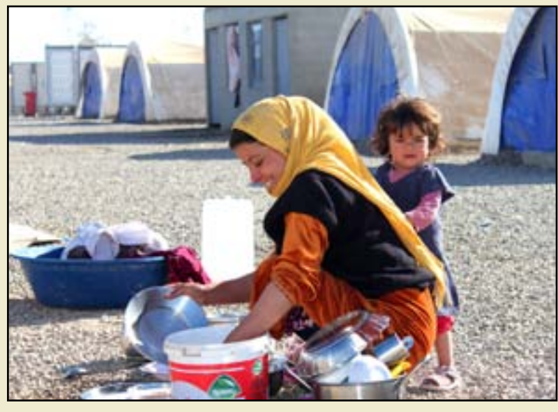
بغداد / يسار جوييدة

حكومة مصطفى الكاظمي، والتحديات التي تواجهها، جعلتها تتشغل عن ملف النازحين. عديد النازحين في الوقت الحالي، يتجاوزون المليون نازح، بمن فيهم أولئك الذين استقروا في مدن إقليم كردستان. وتؤكد وزارة الهجرة أن عديد النازحين في المخيمات يزيد قليلا عن ٣٥ ألف أسرة نازحة. مصادر سياسية تؤكد أن ملف النازحين، غير مقرر له أن ينتهي قبل موعد الانتخابات المبكرة في حزيران من العام المقبل. ذلك أن الملف مرتبط بقضايا رئيسة شائكة أبرزها قضية تواجده الميليشيات في المحافظات المحررة، وهجرتهم على المشاريع والمؤسسات الحكومية، فضلا عن قضية "الانتقام العشائري" من أفراد الأسرة، إذا كان أحدهم منتميا للتنظيم الإرهابي. فالخطط الحكومية لإعادة النازحين إلى ديارهم، ما تزال "رهينة التخصيصات المالية"، يقول