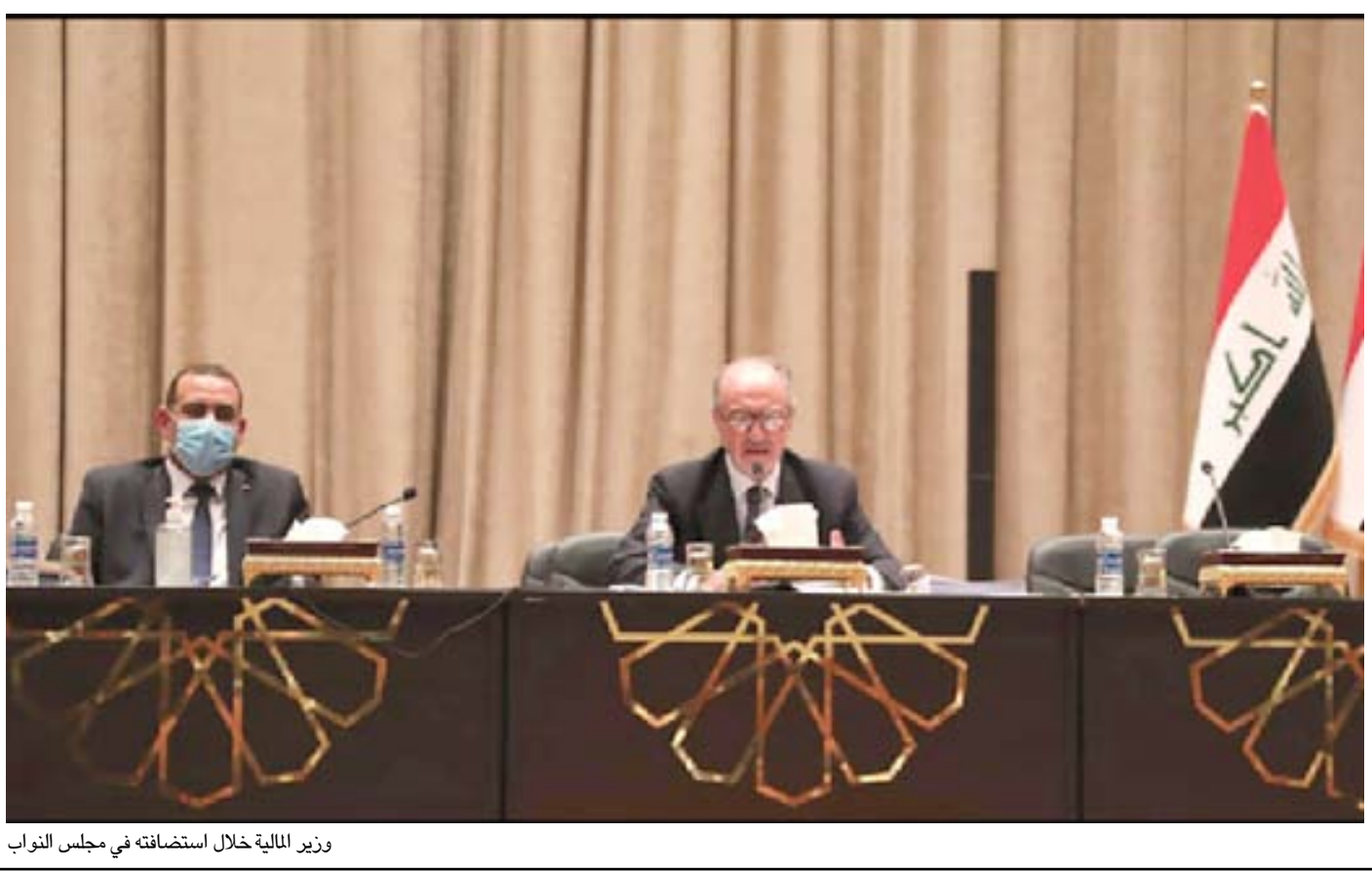
وزير المالية خلال استضافته في مجلس النواب

ويشير البيان إلى أنه "لمعالجة هذا النقص في السيولة المالية، سعت الحكومة العراقية إلى استصدار تشريع برلماني يمكنها من الاقتراض بشروط مبررة، وقد تم استخدام الأموال المتوفرة عبر الاقتراض الداخلي والبالغه بحدود ١٥ تريليون دينار عراقي حتى نهاية الشهر الماضي لتمويل الرواتب والوفاء بالتقديرات الأساسية الأخرى، وخصوصاً ما يتعلق منها بالصحة والأمن، بينما اقتصر استخدام القروض الدولية على تمويل المشاريع التنموية". وتتابع الوزارة أن "وزارة المالية تقوم في الوقت الحاضر بإعداد خارطة طريق مفصلة لتمويل التقديرات الأساسية للأشهر الثلاثة المتبقية من السنة المالية، ستقوم بعرضها قريباً على مجلس النواب الموقر، وستشتمل هذه الخطة زيادة قدرة الوزارة