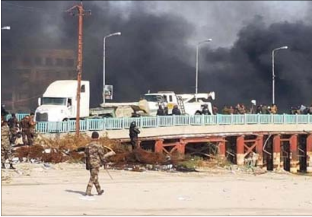
مسلحون بزى عسكري يقتلون المحتجين على جسر الزيتون .. اشراف

ويعد عام من اندلاع التظاهرات الجماهيرية يستذكر ابناء الناصرية