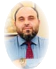
■ علي المدن

لماذا هذه الثورة العراقية عظيمة؟ لماذا تستحق أن تسمى ثورة العراق الكبرى منذ تأسيس الدولة إلى يومنا هذا؟