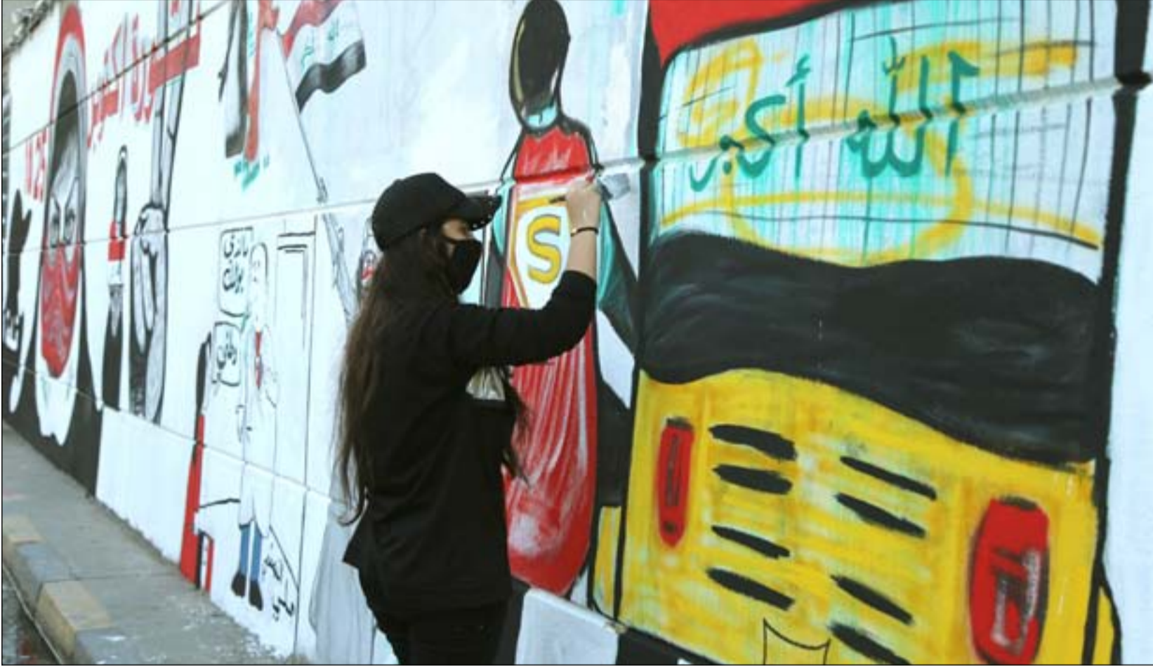
استعدادات لاستقبال الذكرى الأولى لاحتجاجات تشرين في نقف التحرير أمس...