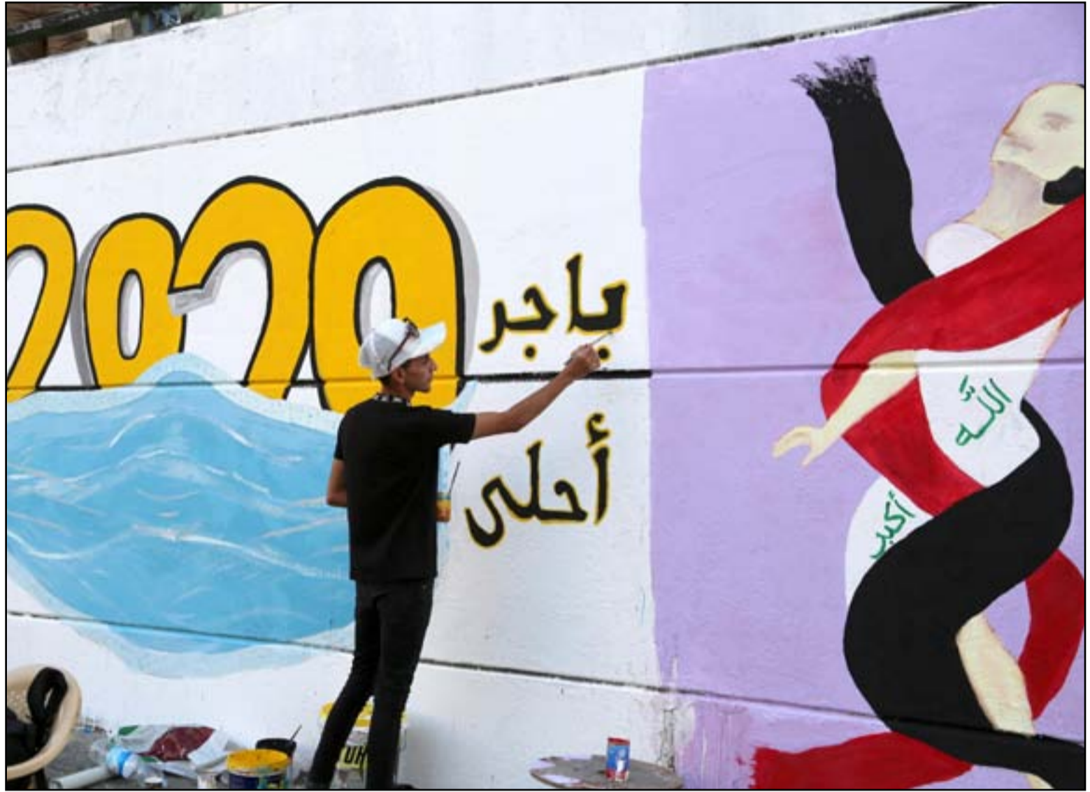
التحرير تستعد للذكرى الأولى لاحتجاجات تشرين ...

وكنك موجهة للإفراج عن كل المختطفين"، مضيفاً: "لا نعرف ما الذي سيحدث، قد يعود القمع والقمصة، لكننا سننطلق بالظاهرة، وفي البداية سننطلق مسيرة لتخليد الشهداء واستذكارهم واشعال للشموع وقراءة سورة الفاتحة على ارواحهم".