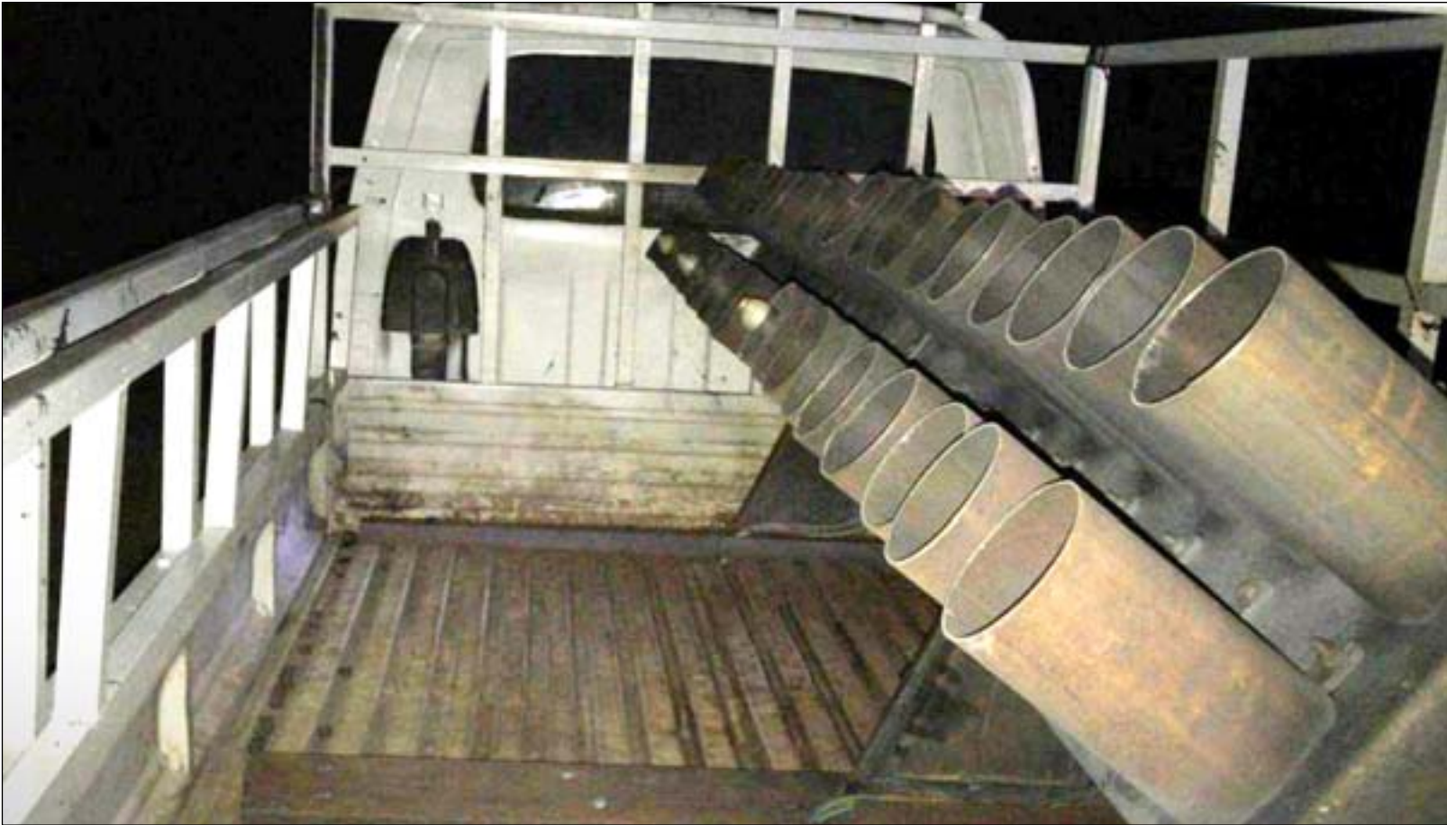
منصة صواريخ مثبتة على سيارة مدنية.. اربيل

في غضون ذلك، اكد سالم جمعة، وهو نائب سابق عن نينوى، قيام "لجنتين امينيتين" في المحافظة، احداهما جاءت من بغداد مكونة من الاستخبارات والمخابرات ومشاركة مع اقليم كردستان، بالتحقيق في الهجوم على مطار اربيل مساء الاربعة الماضي.