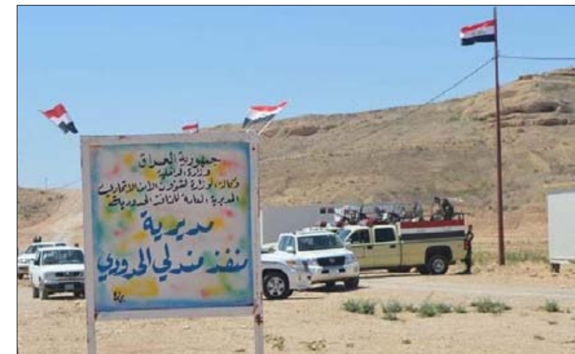
قوة عسكرية في منفذ حدودي مع إيران.. أرشيف