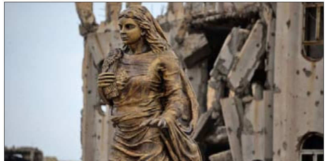
احد التماثيل الجديدة في الموصل