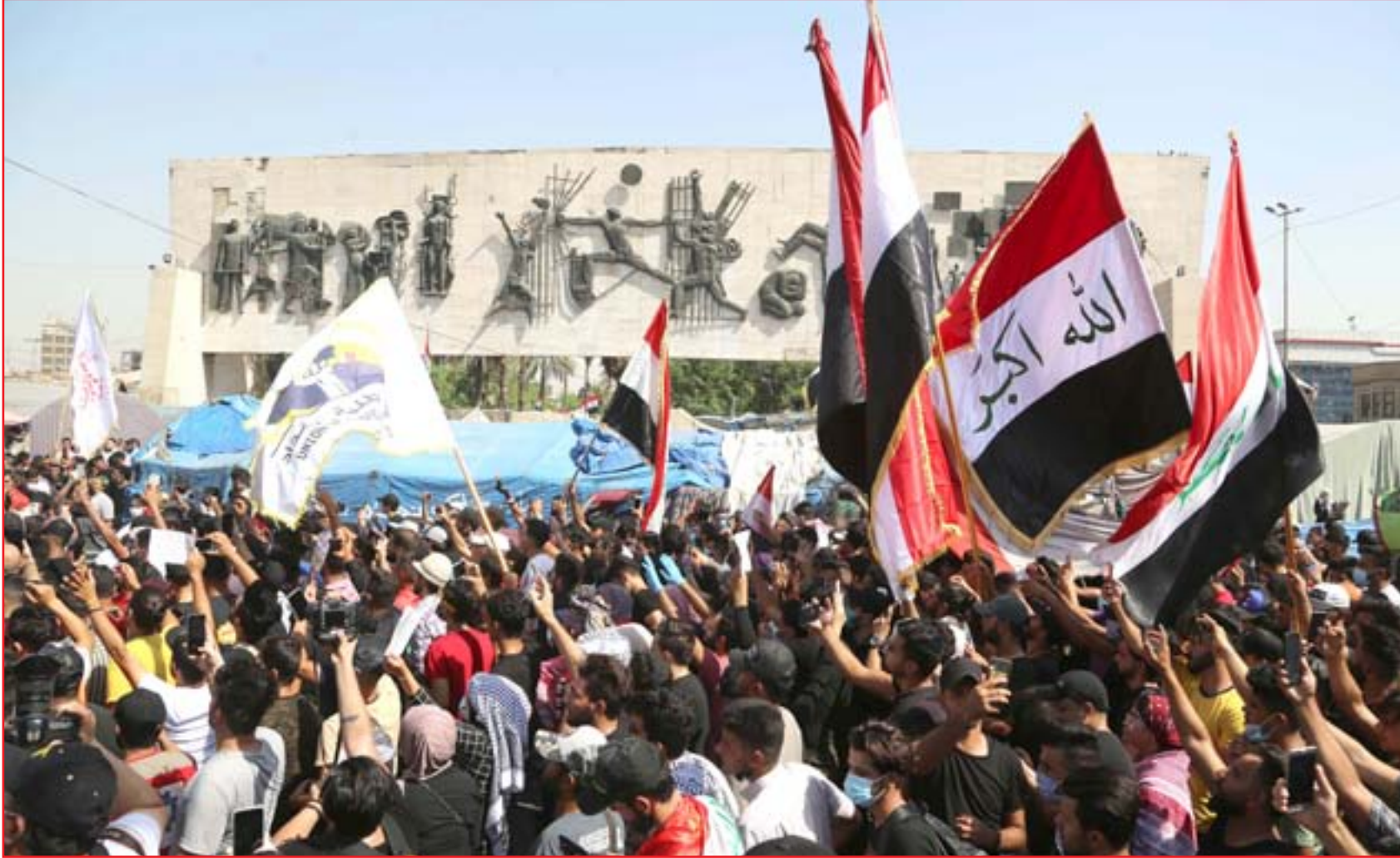
ساحة التحرير في ذكرى سنوية تشرين يوم الخميس ... عداة: (محمود رؤوف)