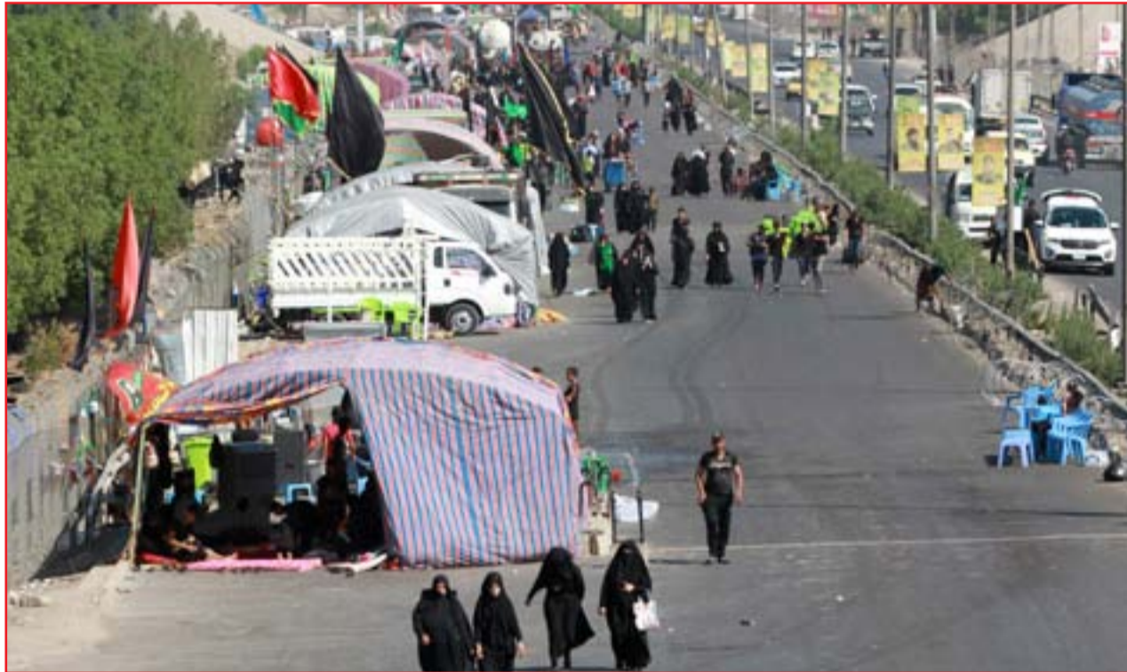
أمس.. زائرون يتوجهون سيراً على الاقدام الى كربلاء..

للأسبوع الثاني على التوالي، تتسارع وتيرة "دخول داعش" من خارج الحدود الى داخل الاراضي العراقية، فيما لا يعرف حتى الآن السر وراء عمليات التسلسل الجديدة بشكل واضح، ويرجح امنيون في مناطق شمال بغداد، وجود مخطط لاعادة انتشار التنظيم بمساعدة خلايا من الداخل، مستغلة الاوضاع غير المستقرة في البلاد. ولاتزال الحكومة العراقية، وجهات معنية بالملف الامني، تؤكد اهمية الاستعانة بالتحالف الدولي، فيما تتعرض تلك القوات الى هجمات صاروخية وتهديدات من "خلايا الكاتوشا".