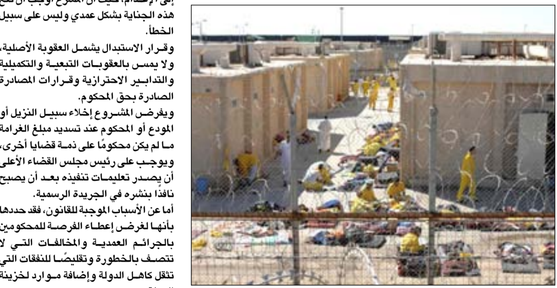
معتقلون في احد

ويمنع القانون تقسيط المبلغ، حيث أوجب تسديده دفعة واحدة وفق الطرق القانونية الحسابية المتبعة لدى حسابات الحاكم. مبالغ الغرامات سوف تقيّد إيراداتها لخزينة الدولة بعد اكتساب قرار قبول طلب الاستبدال الدرجة القطعية، أي بعد أن يصبح القرار نهائياً لا يمكن الطعن فيه. في مقابل ذلك، وضع القانون نوعاً من الرقابة على سلوكيات المستفيدين منه، حيث ذكر أن من حصل على قرار استبدال عقوبته بغرامة، في حال ارتكابه جريمة جنائية عديدة خلال ثلاث سنوات من حصوله على قرار الاستبدال، فإنه سيفقد عقوبته السابقة دون الحق له في استعادة مبلغ الغرامة. وبهذا، فإن المستفيد الذي يرتكب جريمة جديدة من النوع التي حددها المشرع، سيواجه عقوبتين، الأولى عن الجريمة التي استبدل عقوبتها بالغرامة، من دون استرجاع مبلغها، والثانية عن الجريمة التي ارتكبها لاحقاً. والجنائية وفق قانون العقوبات العراقي، هي الجريمة التي تكون عقوبتها محددة بالسجن أكثر من خمس سنوات وصولاً إلى الإعدام، حيث أن المشرع أوجب أن تقع هذه الجنائية بشكل عمدي وليس على سبيل الخطأ. وقرار الاستبدال يشمل العقوبة الأصلية، ولا يمس بالعقوبات التبعية والتكليفية والتدابير الاحترازية وقرارات المصادرة الصادرة بحق المحكوم. ويفرض المشروع إخلاء سبيل النزير أو المودع أو المحكوم عند تسديد مبلغ الغرامة ما لم يكن محكوماً على نذمة قضايا أخرى، ويوجب على رئيس مجلس القضاء الأعلى أن يصدر تعليمات تنفيذه بعد أن يصبح نافذاً بنشره في الجريدة الرسمية. أما عن الأسباب الموجبة للقانون، فقد حددها بأنها لغرض إعطاء الفرصة للمحكومين بالجرائم العديدة والمخالفات التي لا تتصف بالخطورة وتقليصاً للنفقات التي تنقل كاهل الدولة وإضافة موارد لخزينة الدولة.