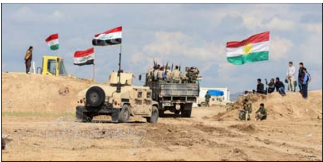
قوة مشتركة من الجيش والبيشمركة.. ارشيف

مع الجيش العراقي ويرحبون بهذه اللقاءات". أما فيما يتعلق بدور التحالف الدولي في المساعدة بتحصين التعاون والتنسيق الامني بين بغداد واربيل، فان المتحدث الجديد باسم التحالف الدولي الكولونيل واين ماروتو، قال للمونيتور بان اجتماعات على مستوى عال قد حصلت. وقال الكولونيل ماروتو "وزارة الدفاع الاتحادية ووزارة شؤون البيشمركة هما في طور تأسيس مراكز تنسيق مشتركة في كل من محافظات ديالى وكركوك وبنينوى. مراكز التنسيق هذه ستحسن من طبيعة التعاون بين القوات الخاصة الكردية والقوات الخاصة للجيش العراقي. بدوره يقوم التحالف