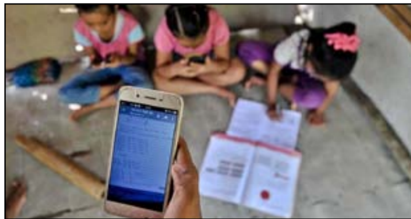
التربية قد تلجأ إلى التعليم الإلكتروني مجدداً

تزايدت المؤشرات على ضعف فرص البدء بالعام الدراسي الجديد قريباً، وسط ترقب عراقي شديد لارتفاع الإصابات وتوقعات بنفش عالي المستوى لغايروس كورونا بالتزامن مع تصاعد أعداد الإصابات وبدء موجة جديدة في العالم . وبعيداً عن المطالبات والتحديثات، دخلت وزارة الصحة ويشكل مباشر على خط " التحذير من بدء العام الدراسي " ما يندرج بأن أمر عدم البدء بالعام الدراسي أصبح وارداً بقوة .