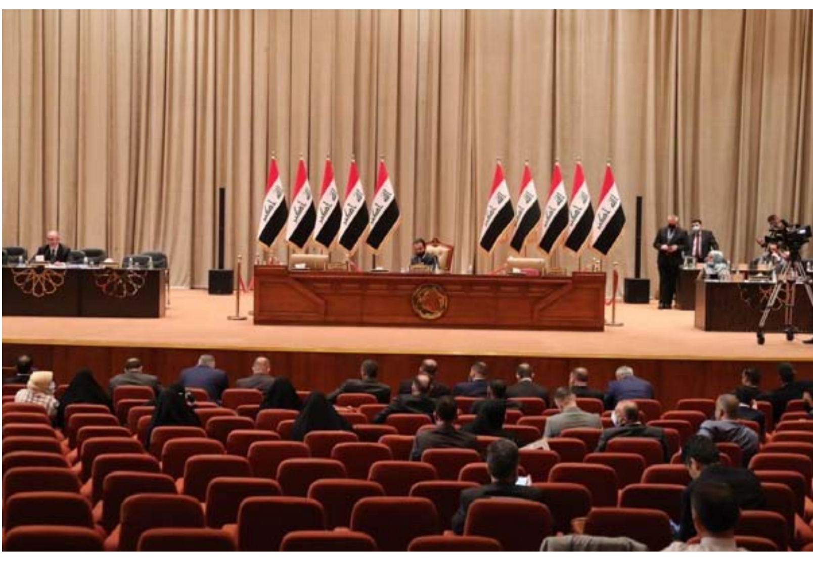
وزير المالية في جلسة برلمانية سابقة

وتساءلت اللجنة المالية النيابية أيضاً "ماذا بعد ذلك؟ وهل هذا هو الحل برأيكم؟ وماذا لو انخفضت اسعار النفط أكثر مما عليه هي الآن"، موضحة ان "الحكومة تحاول رمي الكرة امام مجلس النواب وتخيره بين الموافقة على اقتراض سيؤدي للتهلكة قريباً المتتمثلة بافلاس البلاد والذي ستتحمّل نتائجها الاجيال القادمة وبين تصريحات تحاول الضغط علينا بتصوير انه لا رواتب بدون مصادقة المجلس على ذلك الاقتراض". وتضيف "نود ان نؤكد لجميع ابناء شعبنا ان مسألة الرواتب ليست من مسؤولية السلطة التشريعية وهي من واجبات الحكومة البحتة ومن صلب التزاماتها امام شعبها"، مضيفة ان "اي محاولة لرمي الكرة على مجلس النواب هي تتصل عن تلك المسؤولية وعن الالتزامات الواجب على الحكومة القيام بها". من جانبها، اعتبرت اللجنة الاقتصادية النيابية ان "عدم الانتظام في صرف رواتب الموظفين هو عودة للخبط المالي". مبيّنة ان "قيام الحكومة بسحب مشروع موازنة 2020 وتقديمها لمشروع قانون اقتراض جديد وربطها بتأمين الرواتب بتصويت مجلس النواب على مشروع قانون الاقتراض هي سابقة لم تألفها طيلة عمل الحكومات السابقة". وتوضح اللجنة الاقتصادية في بيان اطلعت عليه (المدى) ان "مسؤولية تأمين الرواتب هي مسؤولية الحكومة وليس مجلس النواب وان استمرار الحكومة بالاقتراض سيؤدي الى افلاس الدولة وانهارها مالم تقم بإصلاحات حقيقية في كافة مفاصل عمل الحكومة".