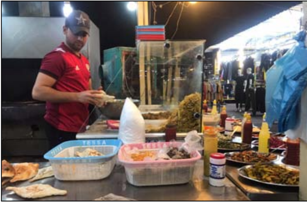
أحد محال الأكلات الشعبية في مدينة الصدر