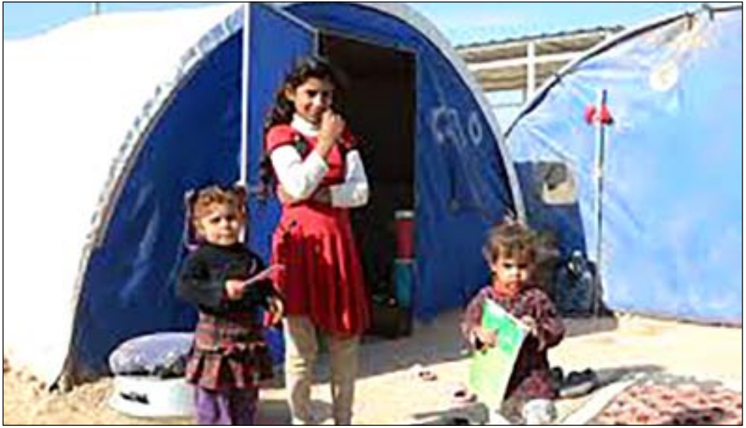
اطفال في مخيم للنازحين في دهوك.. ارشيف