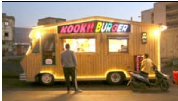
عدسة .. محمود رؤوف