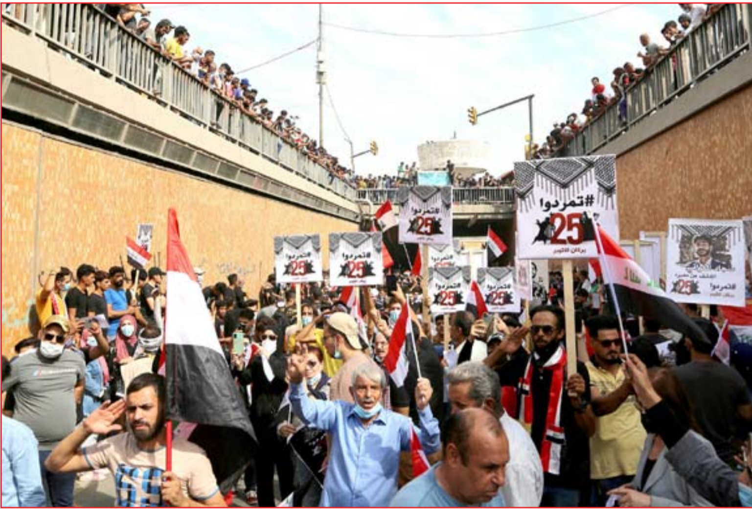
محتجون في نفق التحرير يوم أمس ..

6 فالح الحمراني يكتب، ظل بإيدن يخيم على أردوغان