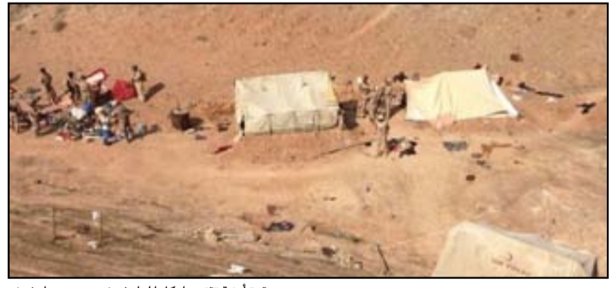
قوة أمنية تتحطم أوكار الداعش في حمير... أرشيف

كركوك، تمكنت من العثور على ٨ أوكار للإرهابيين في ناحية الرشاد ضمن سلسلة جبال حميرين". وأضافت انه، تم تدمير هذه الأوكار التي احتوت على براميل وقود ودراجة نارية ومواد غذائية ويطاريات تفجير و C٤ ومواد تفجير، فضلاً عن تجهيزات لوجستية". الى ذلك، أعلن الناطق باسم القائد العام للقوات المسلحة اللواء يحيى رسول، أمس الأحد، القبض على أحد عناصر داعش المكنى بـ "أبي عائشة" في منطقة الغزالية ببغداد.