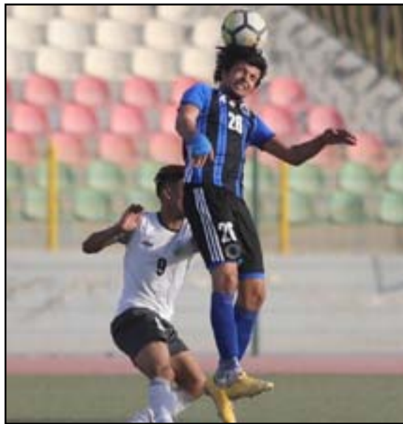
الطلبة يتطلع إلى تجاوز عقبة نفط البصرة