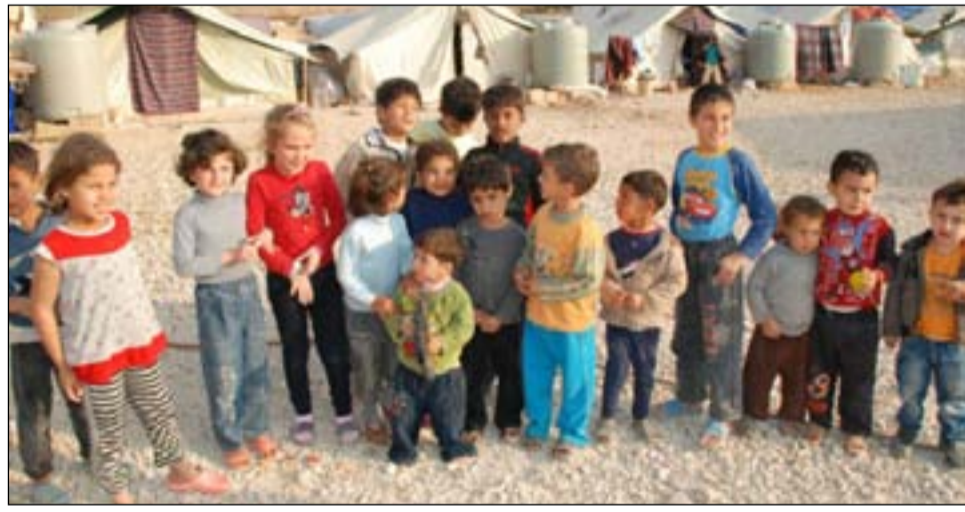
اطفال إيزيديون في أحد مخيمات دموك... ارشيف

ومضى بقوله "تحتاج الى مراكز تأهيل خاصة، العلاج النفسي بشكل عام ضعيف في العراق. حالياً ليست هناك برامج للتعامل مع هؤلاء الاطفال الذين كانوا جنوداً سابقين لداعش، وهذا الشيء خطر جداً بالنسبة لمستقبلهم، حيث من الممكن انزلناهم بامور اراهبية". على الرغم من الشروع بمبادرة جديدة بدعم من منظمة الهجرة العالمية لتأسيس خط هاتفي ساخن خاص بالناجين من ضحايا داعش والمقيمين في المناطق الريفية النائية، فإنه من المتوقع ان تكون هذه الخطوة غير كافية بسبب النطاق الواسع للمشكلة التي تواجهها. ■ عن: مدلل ايست أي