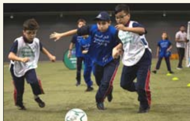
تواصل فعاليات دعم مونديال 2022

استضاف برنامجاً "معهد جسور" والجيل المبر" لإرث بطولة كأس العالم FIFA قطر 2022"، ندوة ناقشت القوة الناعمة للدبلوماسية الرياضية بالتعاون مع مكتب منظمة الأمم المتحدة للتربية والعلم والثقافة (اليونسكو) لدول الخليج واليمن، تحت عنوان "مقدمة حول الدبلوماسية الرياضية: من المفهوم إلى الممارسة" بهدف توفير منصة لمشاركة رؤية عالمية حول سبل الاستفادة من قوة الرياضة لتحقيق الأهداف الوطنية، وشهدت إسهامات قيمة من سياسيين ودبلوماسيين وأساطير في عالم كرة القدم، وفي حديثه خلال الندوة، التي عقدت عبر تقنية الاتصال المرئي، قال الدكتور حمد بن عبد العزيز الكواري، وزير الدولة ورئيس مكتبة قطر الوطنية: "تقدم دولة قطر نموذجاً فريداً للدبلوماسية الثقافية التي حوّلت الرياضة إلى وسيلة مثالية للتقريب بين الشعوب. وقد تراكفت خطواتنا في استضافة الفعاليات الرياضية الكبرى مع إنجازات تعزز من صورة الدولة ودورها كداعية للسلام واحترام الثقافات الأخرى وتنوعها، ولا شك أن الرياضة تدعم هذه الرسالة وتعزز قيمتها". من جانبه أكد حسن النوداي، الأمين العام للجنة العليا للمشاريع والإرث، أن الإرث الأساسي للمونديال يتجسد في تعزيز الدبلوماسية بين الشعوب