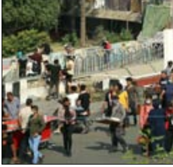
متظاهرون في ساحة التحرير أمس الال . عداة: محمود رؤوف

واضاف ابو رغيف بقوله "النفوذ الإيراني اعرق، أما النفوذ الأميركي فهو اقوى".