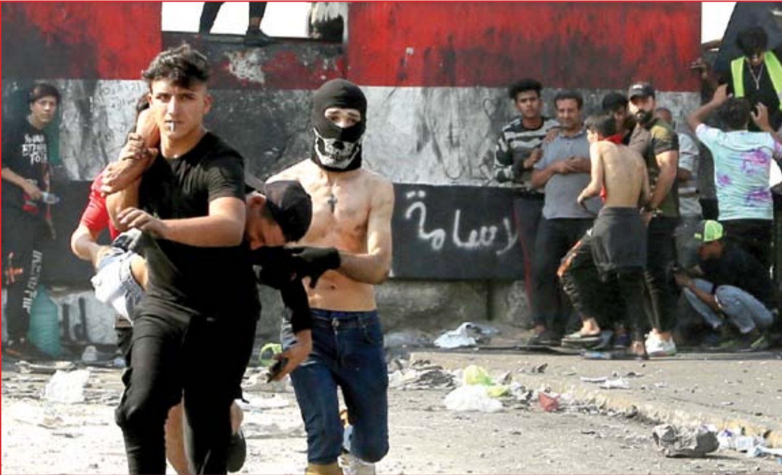
محتجون على جسر الجمهورية يوم أمس ...