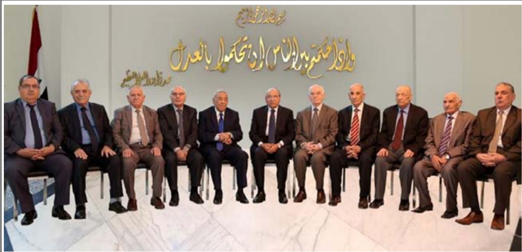
أعضاء المحكمة الاتحادية.