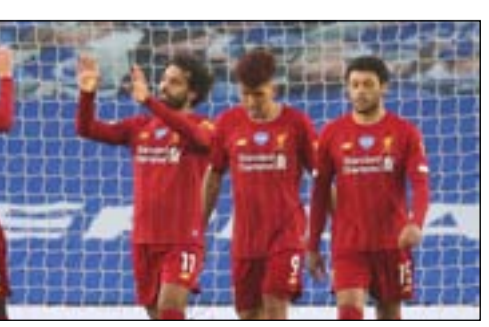
ليفربول يتطلع للصدارة الأوروبية

وكان فريق ليفربول لكرة القدم قد خرج من الدور ربع النهائي من النسخة الماضية من دوري أبطال أوروبا لكرة القدم بعد خسارته أمام فريق أتلتيكو مدريد الإسباني.