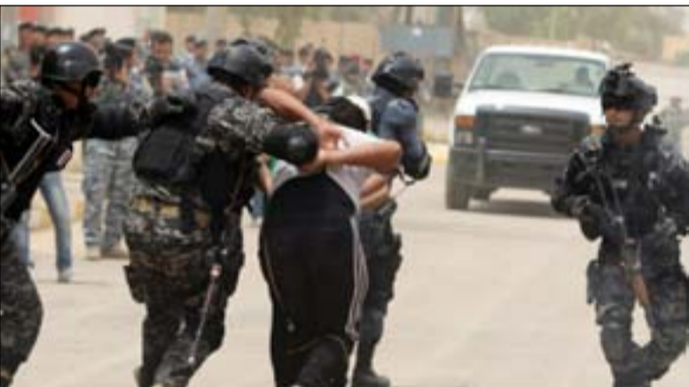
القبض على عناصر من تنظيم داعش... أرشيف

لا ينتهي التنظيم ولكن يقل ترابطه، مثلما حدث مع تنظيم القاعدة بعد مقتل زعيمه أسامة بن لادن. وقال الوائلي في تصريحات لموقع الحرة: "تنظيم داعش بعد خسارته للأرض التي سيطر عليها في العراق وسوريا وخسارته للخلافة المزعومة، كان أهله وقوته في اعتماده على شخصية القائد وهو أبو بكر البغدادي"، مؤكداً أنه بعد مقتل البغدادي انتهت أسطورة تنظيم داعش بسبب ارتباط التنظيم بمؤسسه. وأشار إلى أن التنظيم قد ينفذ عمليات جهادية وانحارية في أماكن مختلفة، لكن لن يستطيع السيطرة على مساحات شاسعة"، مؤكداً أن "حلم الخلافة انتهى". ويقول الكاتب الأردني حسن أبو هنية، المختص في شؤون الجماعات الإسلامية، إن التنظيم نجح في تفادي أزمة مقتل البغدادي، واستطاع الانتقال لقيادة جديدة، مشيراً إلى أنه لم يتم إلحاق هزيمة كاملة بالتنظيم. وأضاف أبو هنية أن التنظيم تخطى مرحلة السيطرة على الأرض وفكرة الخلافة، وعاد مرة أخرى إلى حالة المنظمة تعمل بشكل لامركزي، تلائم حرب العصابات، وقال: "خلال الفترة الماضية شاهدنا تنامي نسق العمليات بعمليات التنظيم في العراق وسوريا وفي جنوب شرقي آسيا، وتابع نرى عودة التنظيم بغض النظر عن شكل هذه العودة لكن هناك تصاعداً في العمليات".