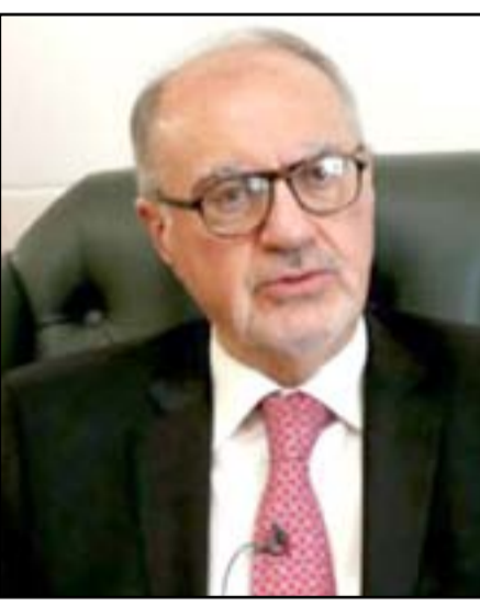
وزير المالية علي علاوي.. ارفشيف

المتعلقة باستيراد الكهرباء والوقود والديون الخارجية والبطاقة التموينية ودعم المزارعين"، مبينا أن "المبلغ المتضمن في الاقتراض الجديد يغطي الرواتب والنفقات لما تبقى من العام الحالي والشهرين الأولين من العام المقبل". وأكد أن "مجلس النواب من حقه المطالبة بتخفيض المبلغ المتضمن في قانون الاقتراض لكن هذا واقع البلد المالي"، مؤكدا "صعوبة السيطرة على النفقات كليا في ظل بناء الدولة على قاعدة غير مستقرة ماليًا وبنفقات مبنية على افتراضات غير واقعية كأسعار النفط المرتفعة". وأوضح أن "الية تسديد الاقتراض الداخلي تتم من خلال الإيرادات المتحققة من النفط والفوائد المترتبة افتراضيا من خلال التفاهم مع المصارف والبنك المركزي من دون الخضوع لضوابط الأسواق". وتابع علاوي أن الحكومة اتخذت إجراءات على المدى القصير لتعظيم الإيرادات ولديها خطة متكاملة لغرض مواجهة الأزمة الاقتصادية.