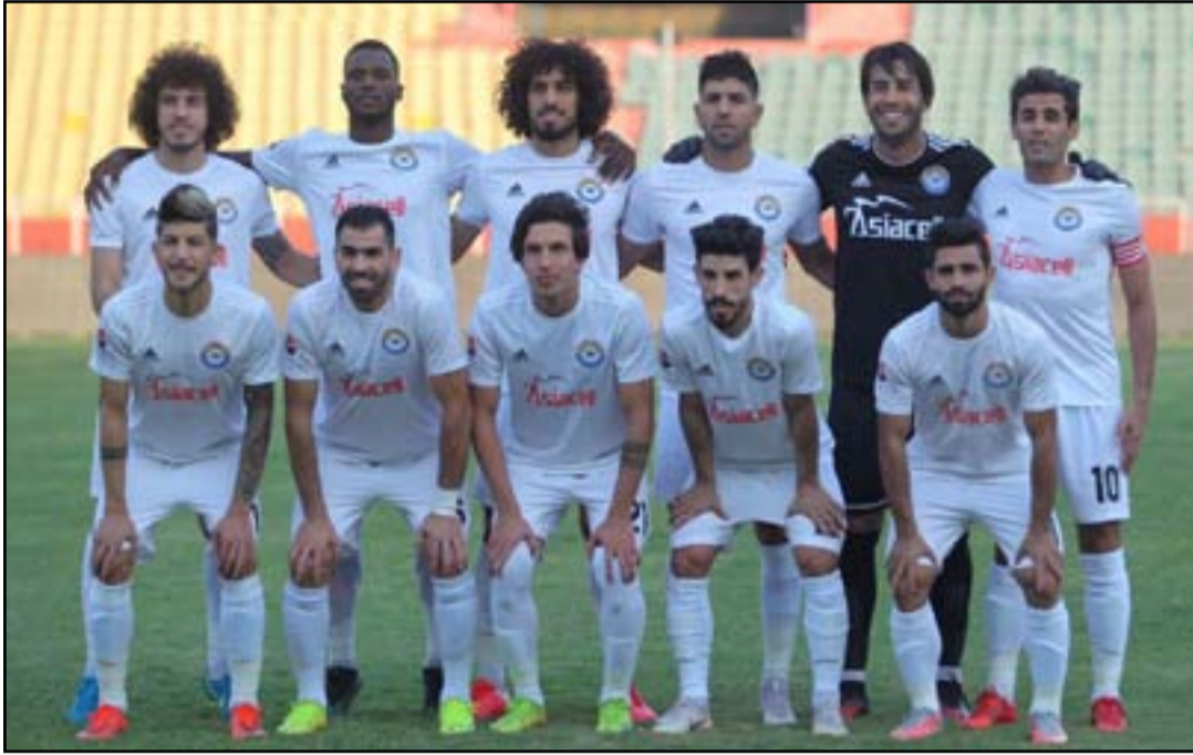
الزوراء يسعى للتخلص من نفس التعادلات

مباريات الجمعة وسيشهد يوم غد الجمعة إجراء خمس مباريات على ملاعب العاصمة بغداد والمحافظات حيث ستجري أربع منها في الساعة الثانية والنصف ظهراً حيث يلتقي فريق النفط الرابع برصيد أربع نقاط على ملعب الشعب الدولي فريق أمانة بغداد الثامن عشر برصيد خال من النقاط، ويواجه فريق الحدود الحادي عشر برصيد نقطتين فريق نبط البصرة السادس عشر برصيد نقطة واحدة على ملعب التاجي، ويلعب فريق القاسم الرابع عشر برصيد نقطة واحدة على ملعب الكفل بالأولمبي في محافظة بابل فريق أربيل الرابع برصيد أربع نقاط ويستقبل فريق الديوانية الثامن برصيد أربع نقاط على ملعب كربلاء الدولي في محافظة كربلاء المقدسة فريق الكرخ التربوي السابع برصيد أربع نقاط تلحقها في الساعة السادسة مساءً مواجهة فريق نبط الوسط المختصر برصيد ست نقاط وفريق نبط ميسان العاشر برصيد نقطتين.