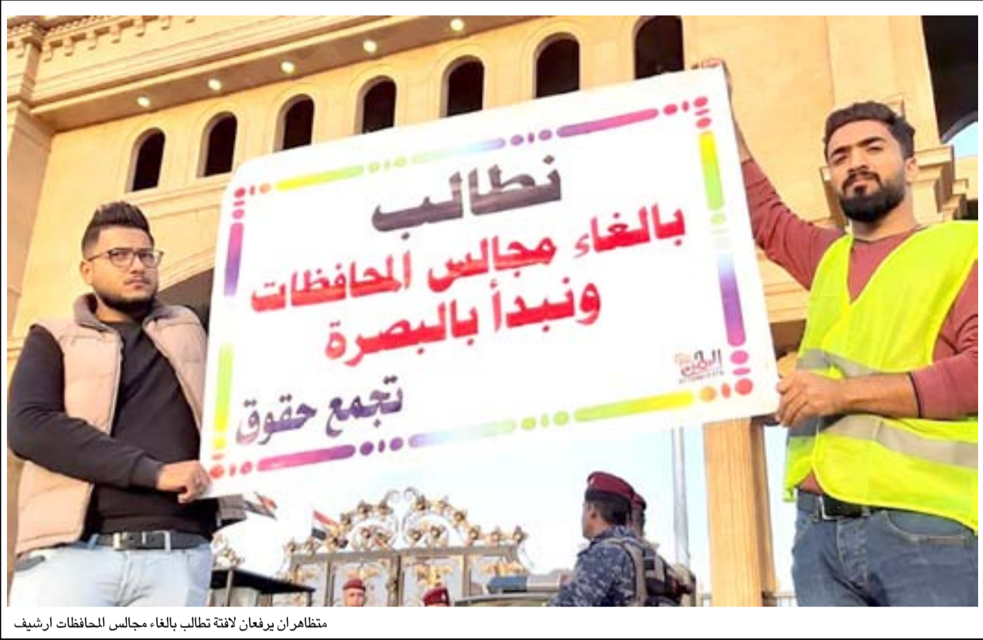
مظاهرات يرفعان لافتة تطالب بإلغاء مجالس المحافظات ارسيف