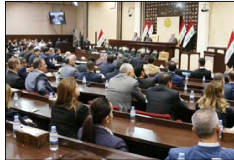
جلسة مجلس النواب.. ارفشيف