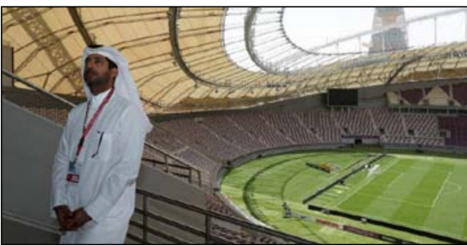
الاستدامة تعزز تحضيرات قطر لضيافة المونديال

دعم ممارسات التشغيل المستدام في قطاعات الضيافة المرتبطة بالمونديال، وتسليط الضوء على الجهود المتواصلة في قطر لتعزيز أفضل الممارسات على صعيد الاستدامة. وناقش المشاركون في المؤتمر دور المونديال في ترك إرث يتماشى في تطبيق معايير التشغيل المستدام في قطاع الضيافة.